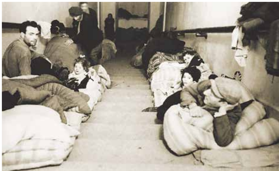
Židovské rodiny ubytované v Castel Gandolfo.