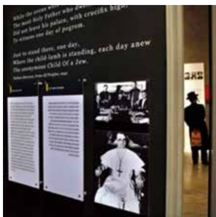
Jad Vašem.