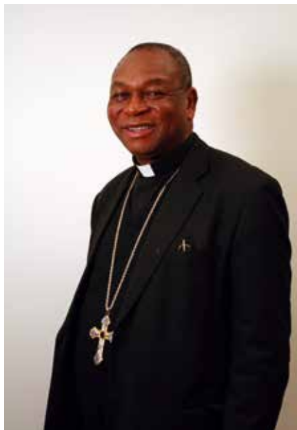
John Olorunfemi kardinál Onaiyekan

Dobře jste rozlišili mezi různými druhy migrantů. Jedni utíkají, aby si zachránili život, protože se nacházejí v nebezpečných situacích. To byl případ většiny syrských uprchlíků, kterých bylo mnoho, přicházeli pěšky a prakticky téměř zaplavili Evropu. Bylo jich tolik, že přinutili dané země, aby si jich všimly. Některé země uprchlíky vytlačily do dalších zemí, jiné je přijaly. Faktem ale zůstává, že utíkali, aby si zachránili život. Jsou to lidské bytosti a zaslouží si nějaké útočiště. Ale i tato forma pomoci musí mít nějaká pra-