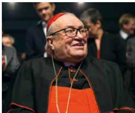
Karl kardinál Lehmann