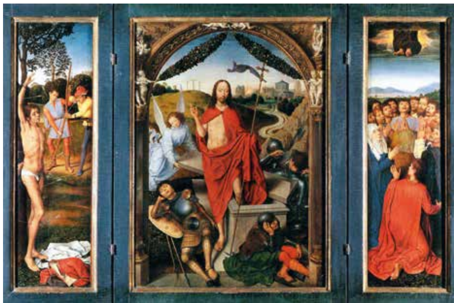
Hans Memling: Triptych Zmrtvýchvstání (cca 1490).

Katecheze papeže Františka na generální audienci