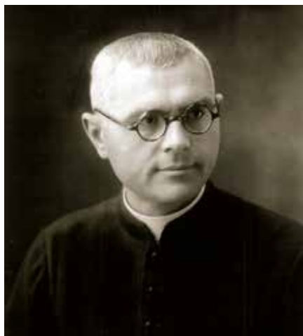
Služebník Boží Andrzej Cikoto

Narodil se 5. ledna 1891 ve vsi Tupalščizna u města Ašmjany na severovýchodě dnešního Běloruska, tehdy v carském Rusku, a pocházel z polské katolické rodiny. Absolvoval gymnázium v Ašmjanech a následně studoval v letech 1909 až 1913 v kněžském semináři ve Vilniusu. Poté pokračoval na teologické akademii v Petrohradě, kde ho 13. června 1914 vysvětil na kněze arcibiskup Wincenty Kluczyński. Studia na akademii ukončil doktorátem teologie v roce 1917. Nejprve působil dva roky jako kaplan ve farnosti svatého Kazimíra v Maladzečně poblíž Minsku a zasloužil se zde o otevření polské školy. Poté nastoupil v roce 1919 se souhlasem biskupa Matulewicze do kněžského semináře v Minsku, kde vyučoval fundamentální a dogmatickou teologii a vykonával funkci prokurátora. V době polsko-sovětské války odcestoval na Litvu a na žádost biskupa Matulewicze vstoupil do řádu Mariánů Neposkvr-