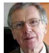
Ferdinand Peroutka, jr., novinář a publicista

Ferdinand Peroutka, jr. (Mezititulky redakce)