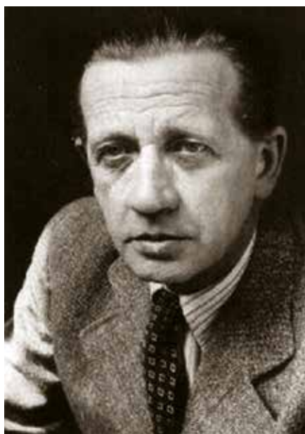
Ferdinand Peroutka.

Peroutkova chvála katolictví nekončí: „Katolicismus složil do této země něco z dědictví velmi starých kultur. Nebyl to dar, jehož třeba želeť. Je-li kde jaký půvab v této zemi, naleznete jistě, že jest dědictvím po katolicismu... Pokuste si