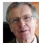
Ferdinand Peroutka, jr., novinář a publicista

Ferdinand Peroutka, jr. (Mezitimulky redakce)