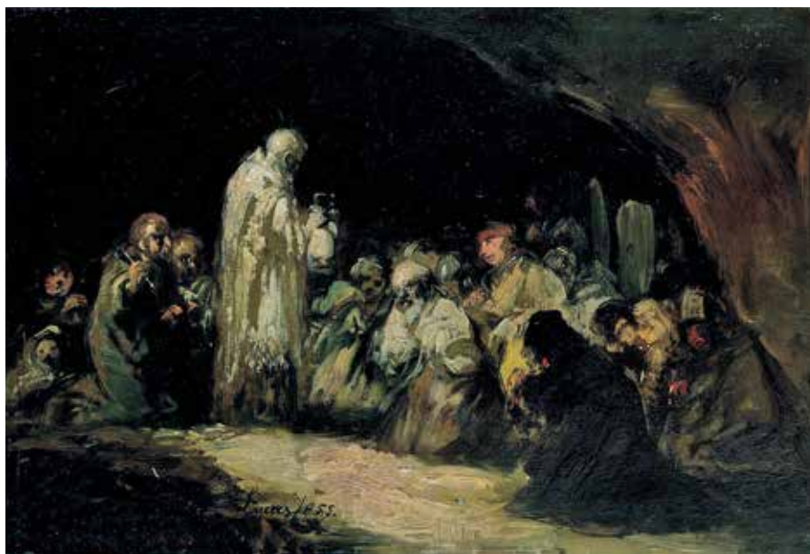
Eugenio Lucas Velázquez: Svaté přijímání (1855).

Homilie papeže Františka při mši svaté v italském městě Molfetta