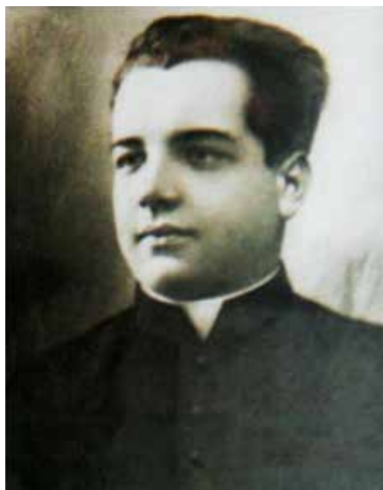
P. Michał Rapacz.

pravděpodobně vydán v dubnu 1946 na komunistické schůzi v Trzebini. Jeden z účastníků této schůze jej varoval, stejně jako další farníci, kteří mu radili, aby raději utekl. On to ale odmítl a v jednom ze svých posledních kázání pronesl: „I kdybych měl zemřít, nepřestanu hlásat Evangelium a nezřeknu se svého kříže.“