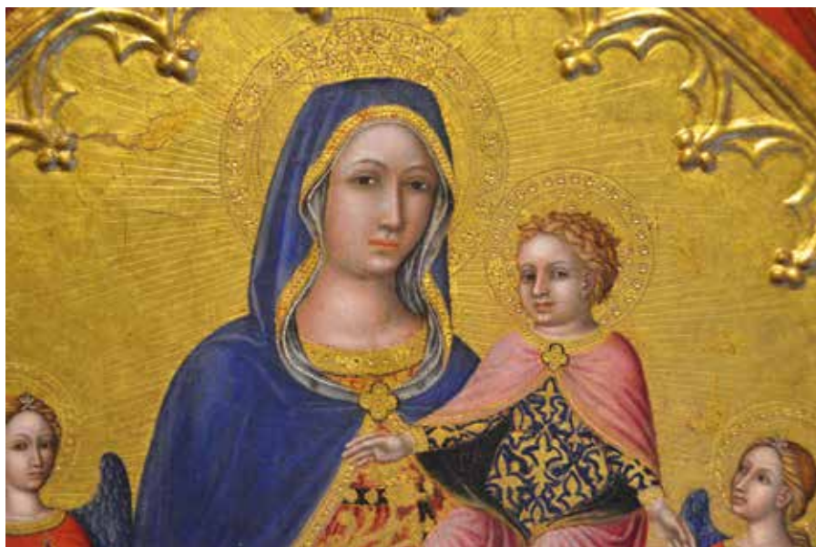
Maestro di Stefano: Matka milosrdenství.

Maria, mistrovské dílo Nejvyššího, zázraku věčné Moudrosti, dive všemohoucnosti, propasti milosti, přiznávám se všemi svatými, že jenom ten, který tě stvořil, zná výšku, šířku a hloubku milosti, které ti udělil.