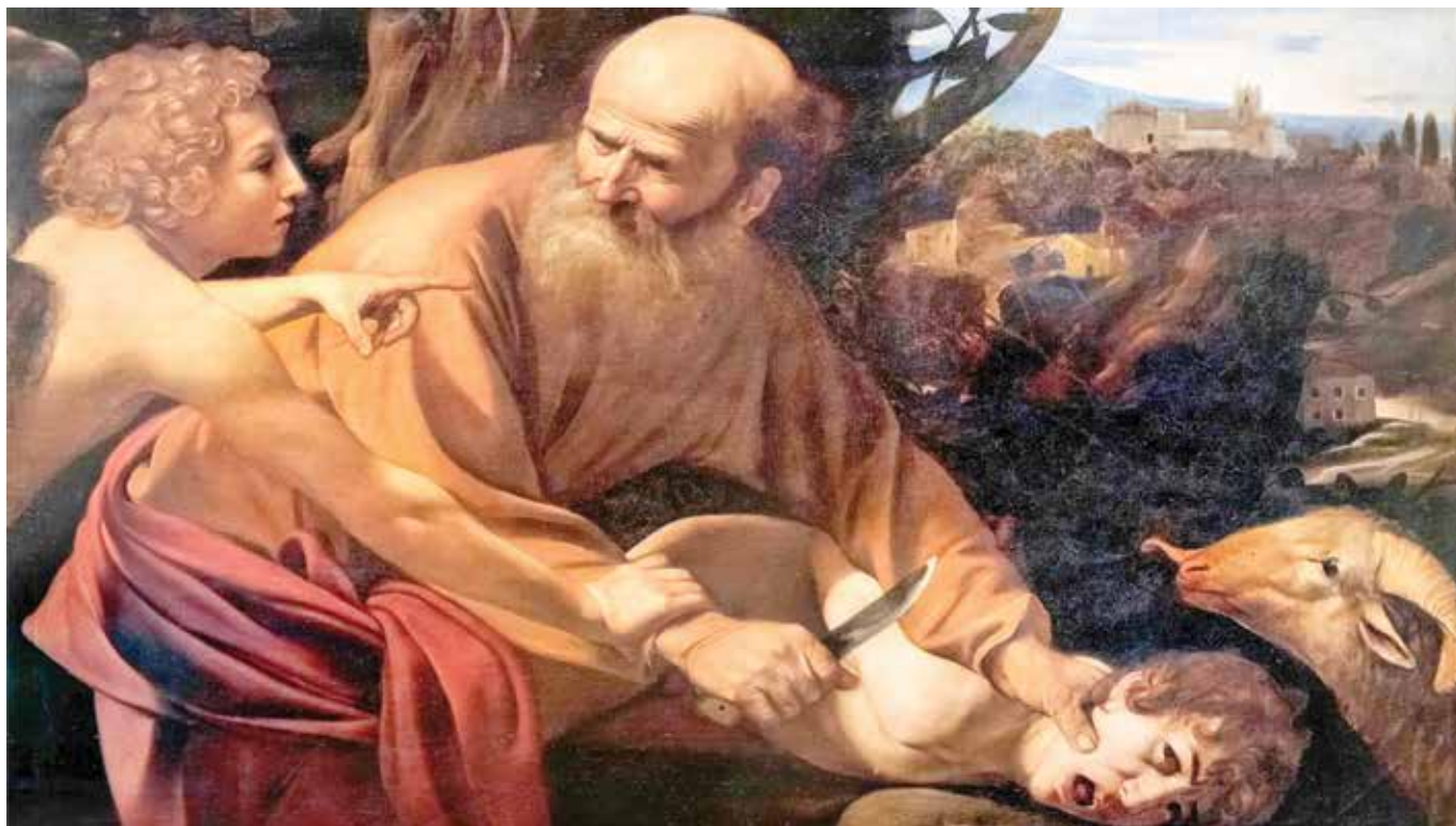
Caravaggio: Obětování Izáka (1594/1596)

sofů práva. Vždyť např. jestliže se dnes (přibližně od dob osvícenství) s odkazem na přirozené právo všeobecně deklaruje „přirozená“ rovnost všech lidí, v antice se s odkazem na totéž přirozené právo argumentovalo ve prospěch „přirozeného“ rozdělení lidí na svobodné a otroky (Platón, Aristoteles, Cicero, Gaius...). Nelze zde nezmínit drsná slova dánského právního filosofa Alfa Rosse (1899–1979) v jeho publikaci On Law and Justice (Londýn 1958), že totiž „přirozené právo, stejně jako děvka, poslouží každému. Neexistuje ideologie, která by se nedala obhajovat odvolávkou na právo přírody“ (s. 260). Prostě: přirozené právo je považováno za značně „kaučukový“ pojem.