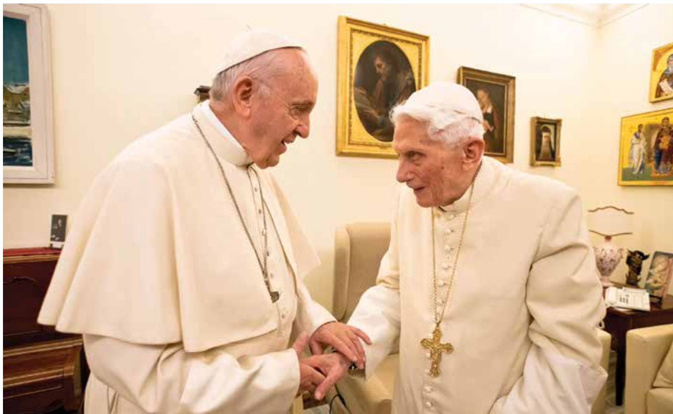
Papež František na návštěvě u emeritního papeže Benedikta XVI. v klášteře Mater Ecclesiae ve vatikánských zahradách 21. prosince 2018.

František a Benedikt chválí iniciativu, jež má studovat základy lidské důstojnosti.