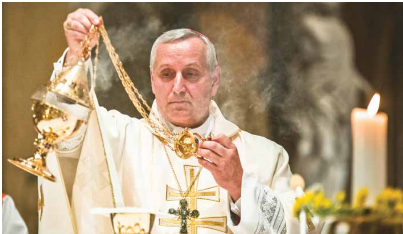
Mons. Vlastimil Kročil.