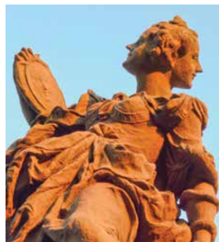
Matyáš B. Braun: Alegorie Moudrosti.

V kontemplativní modlitbě zakoušíme, ochutnáváme Boha, jeho podstatu