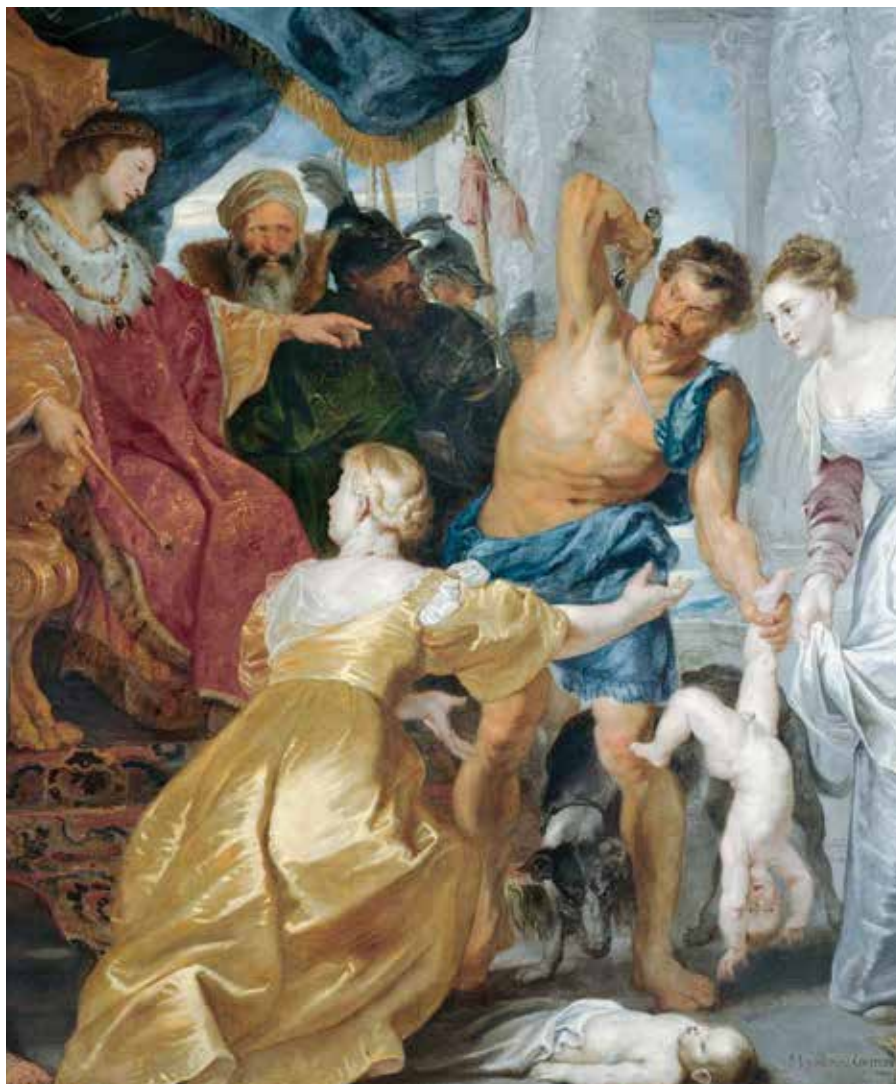
Peter Paul Rubens: Král Šalamoun (1617)

Šalamounovi se připisuje též Kniha Přísloví, Kniha Kazatel a Žalmy 72 a 127. Krom těchto knih hebrejské Bible se mu připisují i knihy Šalamounova Moudrost, Šalamounovy Žalmy a Šalamounovy Ódy, které nejsou součástí Bible.