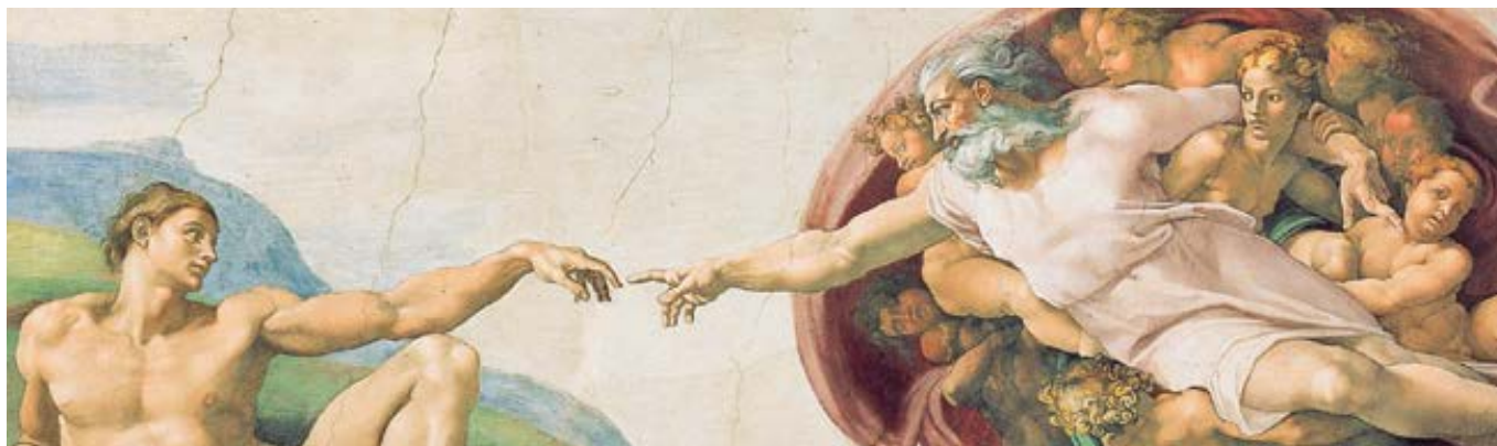
Michelangelo Buonarroti: Stvoření Adama (1508–1512)