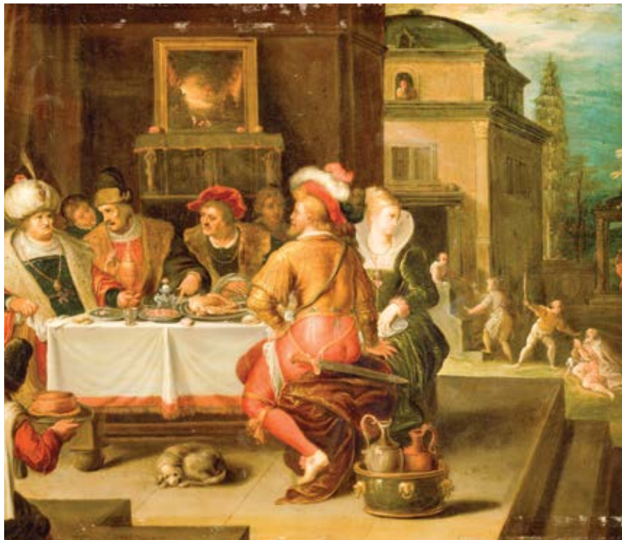
Frans Francken ml.: Podobenství o boháči a Lazarovi (1615)

Na závěr se podívejme ještě na jedno podobenství, které víc než kterékoli jiné popisuje dnešní svět, peklo a nedostatek lásky a soucitu. Popisuje i křesťanské chápání soucitu, podobenství o boháči a Lazarovi. Boháč šel po smrti do pekla. Někdo se divil proč, vždyť přece nikomu neublížil. Dokonce ani Lazarovi ne, který jej – řekněme to upřímně – otrávoval, když mu ležel pod stolem. Komu z nás by asi takové stolování vyhovovalo?! Problém nebyl v tom, že by boháč učinil něco zlého, ale v tom, že neučinil