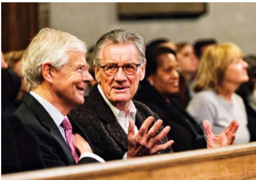
Luke March (vlevo) a Michael Palin (vpravo).

Blíží se doba dovolených, začaly prázdniny. A tak se množí zas různé věrohodné studie: „V rámci výkonu zaměstnání je pro pozitivní vliv na duševní zdraví ‚nejúčinnější dávkou‘ jeden pra-