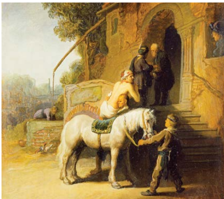
Rembrandt: Milosrdný Samaritán (1633)

Zlatá nit, táhnoucí se jejím myšlením a která napohled zoufalým aspektům jejího života dodávala určitou stálost, byl hluboký soucit s trpícími, soucit, který byl téměř ztotožněním s nimi. Celoživotním zájmem Weilové a předmětem jejího uvažování a skutků byly propasti, které oddělovaly lidi od sebe navzájem. Toužila, aby všechny takové propasti