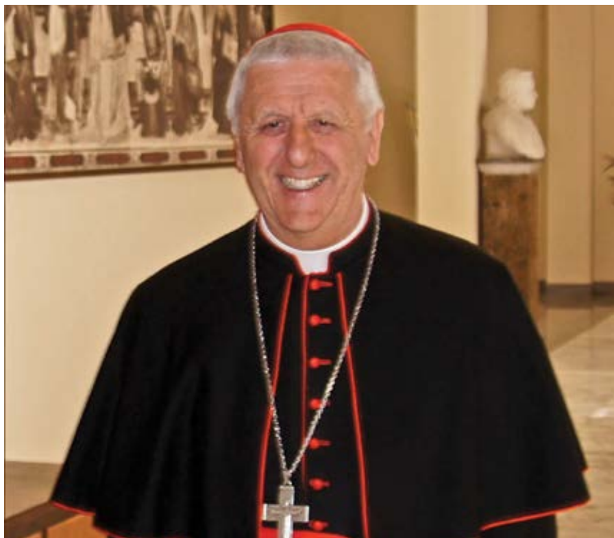
Mons. Giuseppe Versaldi.

Církev potřebuje jasně formulovaný dokument o genderu. Prosili nás o to biskupové při návštěvách Vatikánu, stejně jako rodiče a katoličtí vychovatelé, se kterými jsme se setkali v různých zemích světa – vysvětluje kardinál Giuseppe Versaldi genezi nedávno vydaného dokumentu Kongregace pro katolickou výchovu. Vatikánský text genderovou ideologii odmítá, vybízí však k dialogu o některých problémech, které jsou předmětem genderových studií.