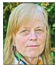
Francis Phillips Catholic Herald Přeložil Pavel Štíčka

Láska, sebeobětování a sebeovládání, jež promlouvají z tohoto dopisu, na dlouho zůstanou v mysli čtenáře této pečlivě prozkoumané a dojemné rodinné historie.