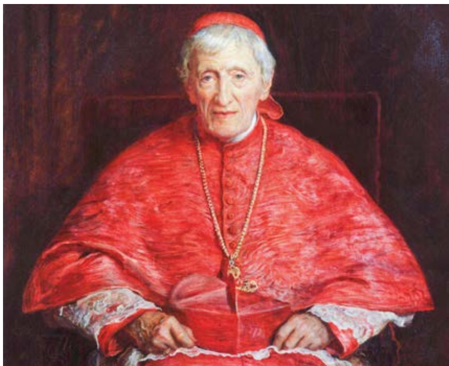
John Everett Millais: John Henry Newman (1881)

„Ve středu ráno jsem se probudila v posteli v kaluži krve. Manžel už byl v letadle na cestě do Atlanty,“ řekla