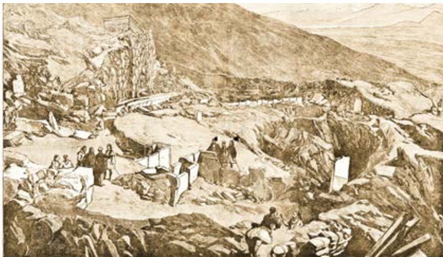
Vykopávky Heinricha Schliemanna v akropolis v Mykénách.

N: Číst antickou řeckou literaturu? Myslíš třeba Homéra nebo Hésioda? Něco nám o nich říkali ve škole a jsem spokojený, že to mám již za sebou. Kdybych se do četby jejich děl pustil, asi bych se unudil k smrti. Možná je to můj osobní problém, ale fantastický literární žánr přímo nesnáším. Trápit se nad nekonečnými popisy boje o Tróju by pro mě byl asi hodně bolestný trest. To už mi připadá zajímavější sci-fi literatura, která má alespoň nějaké reálné základy. Smyšlen-