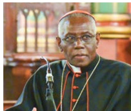
Mons. Robert Sarah.

Píšete, že „Kristus nikdy neslibil svým následovníkům, že budou tvořit většinu“ (s. 34), a dále pokračujete: „I přes největší úsilí misionářů církev svět neovládla. Poslání církve je misí lásky a láska neovládá“ (s. 35). Dříve jste napsal: „Je to, malý pozůstatek, který zachránil víru.“ Dovolte tedy směly