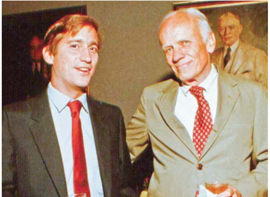
Novinář Walter Isaacson a Walker Percy, 1982.

Následovalo ještě pět dalších románů, které se postaraly o to, že Percy se stal jedním z nejčtenějších spisovatelů na americké scéně. Přestože hlavním tématem táhnoucím se jeho romány a esejemi jako červená niť je určitá nedůvěra k svě-