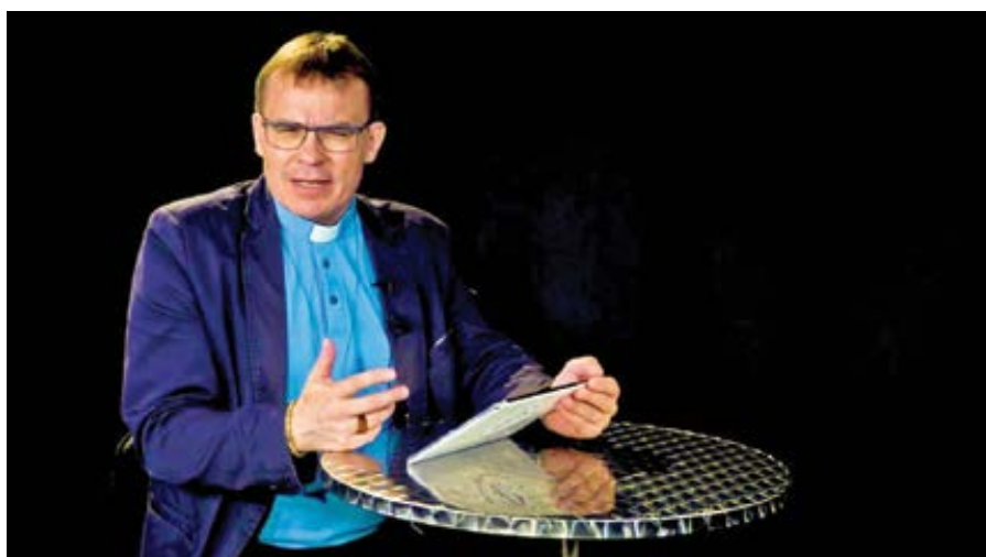
Mons. Tomáš Holub.

Pokud jde o tzv. odpovědné rodičovství, lze u něj obecně rozlišit dvě základní otázky. První otázkou je, kdy mají manželé dostatečný důvod odložit početí