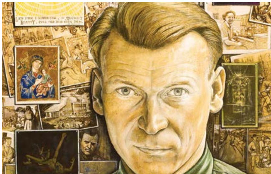
William Kurelek: Auto-Portrét (1957)