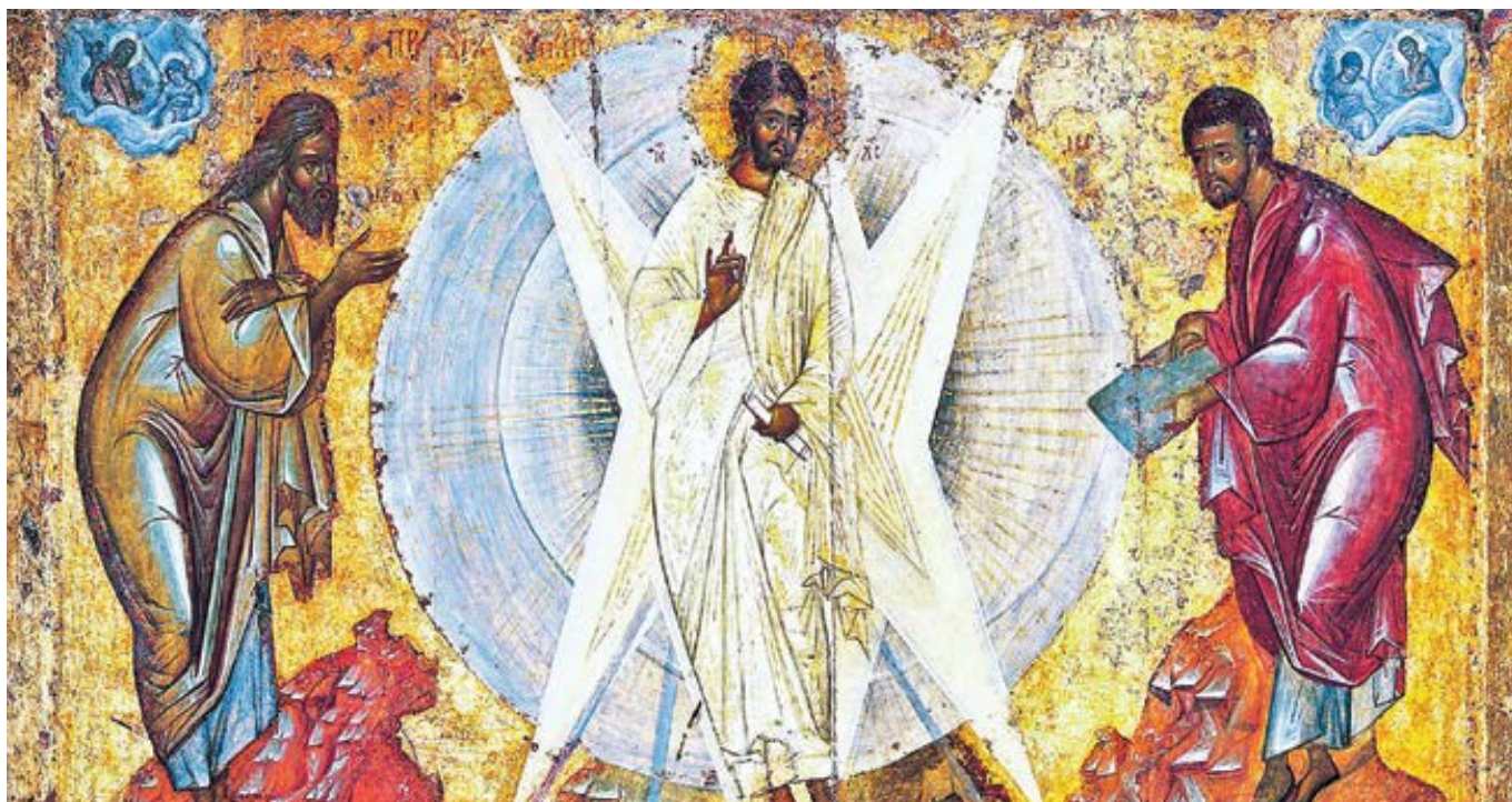
Feofan Grek: Proměnění Páně (kolem 1400)