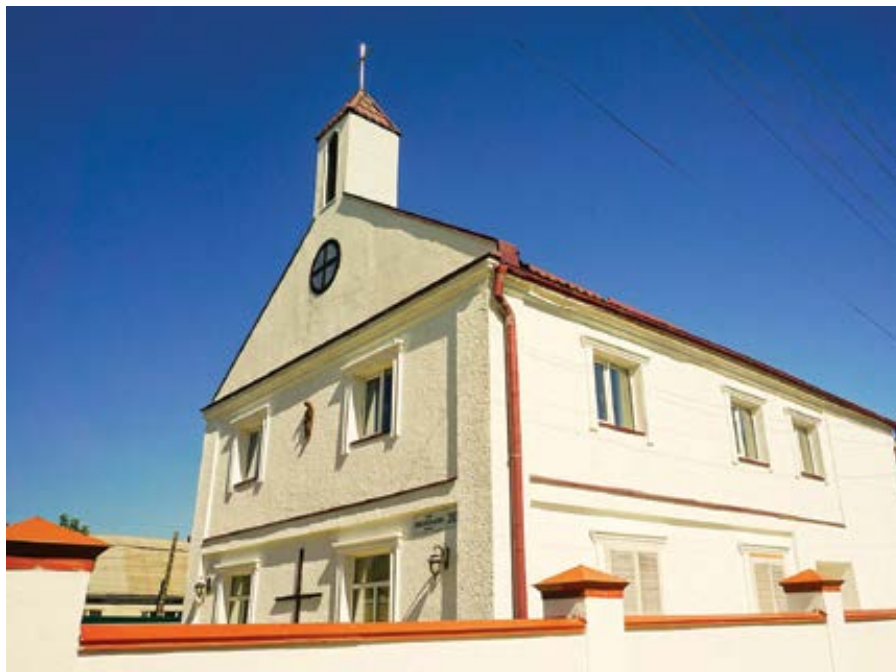
Kostel sv. Archanděla Michaela v kyrgystánském Biškeku.