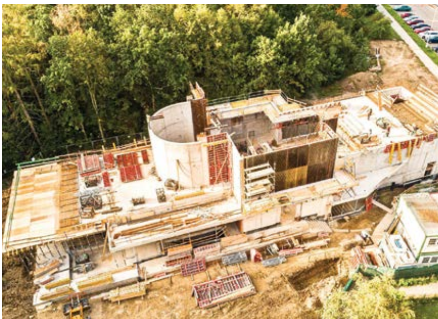
Stavba kostela Krista Spasitele na pražském Barrandově.

„Uprostřed sídliště Barrandov se zatím nad terénem – v půdorysu latinského kříže s centrálním presbytářem – objevily jen vysoké železobetonové stěny. Už do konce roku je ale zaklene atypická monolitická střecha s šestimetrovým kruhovým světlíkem. Přilehlá štíhlá zvonice pak i neznalému návštěvníkovi prozradí, že tým Josefa Majera z divize 9 buduje v Praze nový kostel. První po více než dvaceti letech.“ Toto sdělení se objevilo v komerčním věstníku společnosti Metrostav. Obvykle z takových periodik nepřinášíme horké novinky, ale tohle stojí za to: „Budování kostela Krista Spasitele na Barrandově je velmi specifické nejen z pohledu stavby, ale také investorského prostředí – nesmíme například stavět v neděli či ve svátek. Ve smlouvě máme také zakotveno, že se na stavbě nesmí nejen kouřit, ale ani klít a mluvit vulgárně. Na staveništi tak neuslyšíte jediné sprosté slovo.“ Bude to požehnané dílo!