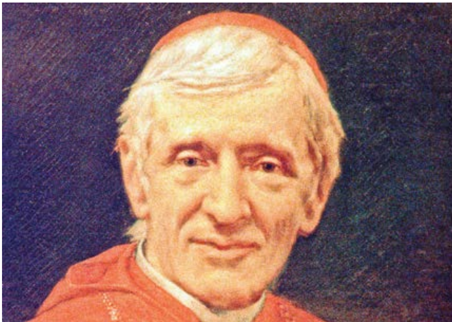
Mons. John Henry Newman.

Blahoslavený John Henry Newman byl jedním z nejvýznamnějších konvertitů z anglikanismu ke katolicismu v 19. století. Byl již váženým anglikánským teologem, když založil Oxfordské hnutí, které si kladlo za cíl navrátit anglikánskou církev k jejím katolickým kořenům. Poté však konvertoval ke katolické víře. Proslul jako vynikající myslitel a papež Lev XIII. jej jmenoval kardinálem. Zemřel v Birminghamu roku 1890 ve věku 89 let, poté, co založil birmingham-