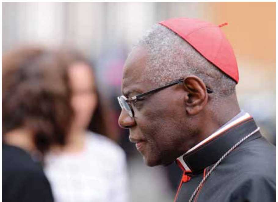
Kardinál Robert Sarah.

„... Pokud si vytváříme liturgii pro sebe, odvádí nás to od Boha. Stává se z ní směšná, vulgární, nudná divadelní hra. Nakonec budeme mít liturgii, která připomíná varietní představení... Věřící pak odcházejí domů... aniž by se osobně setkali s Bohem nebo jej zaslechli v nejniternějších hlubinách srdce... Naším referenčním bodem by měl být samotný Bůh. Máme však... různá pojetí liturgie, která jdou tak daleko, že zapíříčňují vzájemné