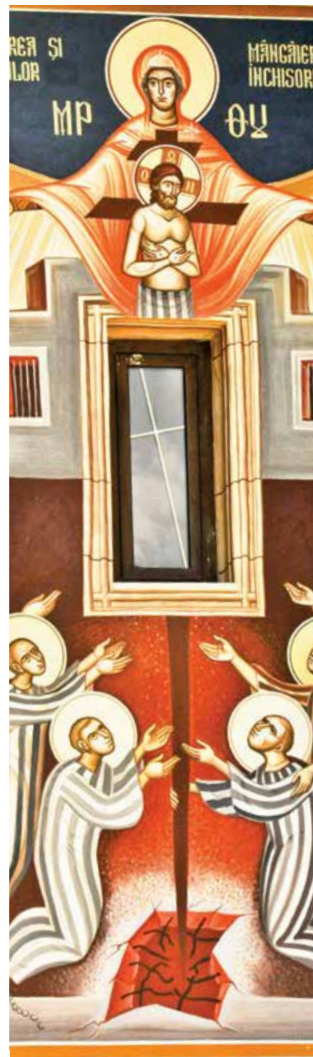
Freska na pravoslavném kostele sv. Jana Křtitele, Neamț, Rumunsko.

Druhá světová válka skutečně znamenala významný obrat. Zatímco papež Pius XI. v encyklice Mortalium animos z roku 1928 ekumenismus ještě zásadně odmítá a jeho přívržence nazývá panchristiani (všekřesťané), za Pia XII. již byla vydána roku 1949 instrukce Ecclesia catholica , v níž se iniciativy ve prospěch ekumenismu schvalují a biskupům se ukládá nad nimi nejen bdít, nýbrž je i podporovat. Plná přihláška katolické církve k ekumenickému hnutí na Druhém vatikánském sněmu je pak programově zakotvena v koncilním dekretu Unitatis redintegratio z roku 1964. Tento dokument v sobě