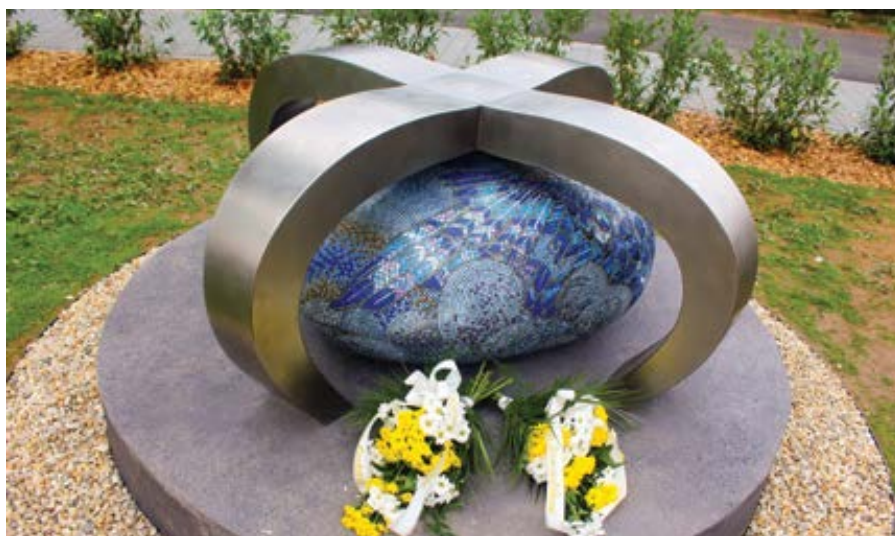
Památník Tomáši kardinálu Špidlíkovi v Boskovicích.

Připomenu zde akce, jež pořádám ve spolupráci s Orlem, jednotou Boskovice a pod záštitou Ministerstva kultury. V lednu 2019 si široká veřejnost připomněla 100. výročí narození kardinála Špidlíka v Muzeu regionu Boskovicka, kde bylo představeno fotoalbum s jeho citáty. V únoru jsem uspořádala koncert