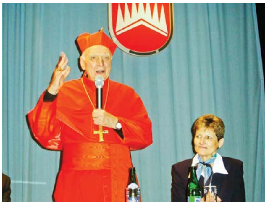
Kardinál T. Špidlík při návštěvě v Boskovicích v roce 2004.