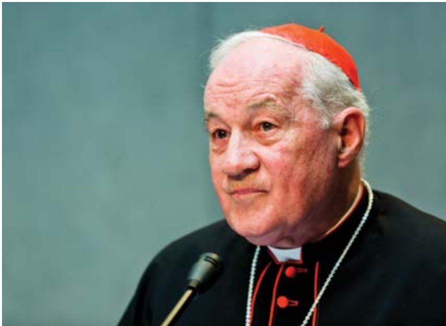
Mons. Marc Ouellet.

Rodí se první katolická banka v Česku! Tak hlásal novinku titulek serveru Aktuálně.cz . A ono fakt! „Biskupství česko-budějovické vstoupilo do největší české záložny Artesa. Biskupství získalo ve společném družstvu prostřednictvím majoritního akcionáře Artesa Capital podíl 9,5 procenta akcií. Biskupství brzy požádá Českou národní banku o nabytí kvalifikované účasti, aby mohlo dále navýšit svůj podíl a získat v záložně majoritu. ... Biskupství chce nejenom navýšit kapitál a požádat o bankovní licenci, ale hlavně rozšířit služby pro klienty. Artesa zavede ještě v letošním roce systém zvýhodněných půjček pro začínající podnikatele a rychlé půjčky na nákup nemovitostí, uvedla PR manažerka Artesy. Biskupství chce ze záložny Artesa vybudovat silnou banku.“ Vida! Proč ne!