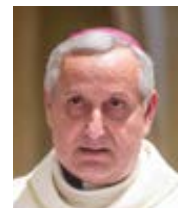
Mons. Vlastimil Kročil biskup českobudějovický