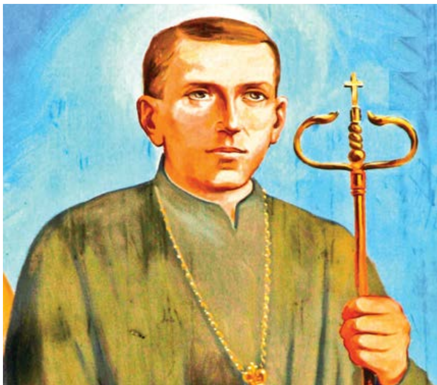
Bl. Nykyta Budka.

Blahoslavený Nykyta byl jednou hvězdou z celého souhvězdí svatých. Byl vysvěcen v roce 1905 ctihodným Andrejem Šeptyckým, metropolitním arcibiskupem, který dal později služebníku