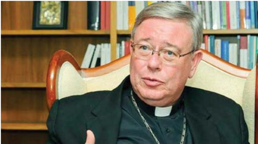
Mons. Jean-Claude Hollerich SJ.

Japonsko, s nímž se papež František setká za necelé dva týdny, je moderní zemí, která ztratila směr a neví čím se v životě řídit, říká kardinál Jean-Claude Hollerich SJ. Tento lucemburský arcibiskup Zemi vycházejícího slunce dobře zná. V Japonsku pracoval 17 let jako jezuitský misionář.