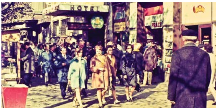
Václavské náměstí říjen 1970.

Maturitu jsem složila na tři jedničky a jednu dvojku, na vysokou školu jsem nesměla a musela jsem nastoupit do práce. Jenže tu byl problém. Jako dcera politického vězně jsem nemohla sehnat zaměstnání, všude mě odmítli. I to byla jistota. Současně tehdy platilo, že každý občan musel