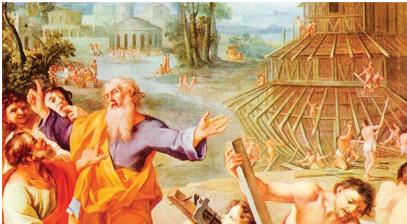
Francouzský mistr kolem roku 1675: Stavba Noemovy archy.