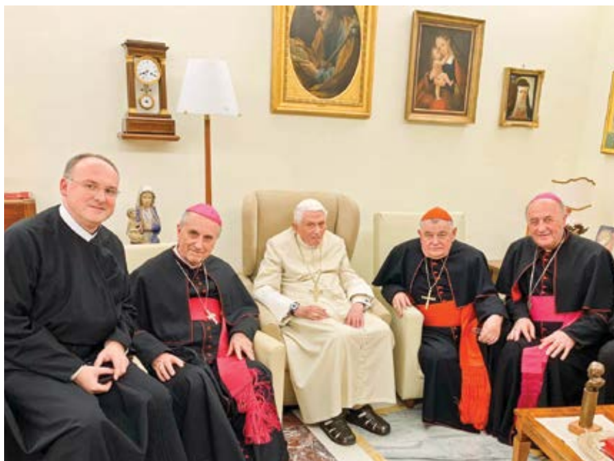
Emeritní papež Benedikt XVI. přijal 11. listopadu 2019 české biskupy.