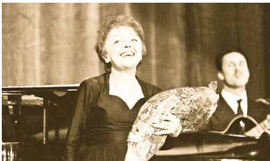
Edith Piaf.

Narodila se do nesnesitelné chudoby jako Edith Giovanna Gassion 19. prosince 1915. Jméno dostala podle Edith Cavell, odvážné britské zdravotnice, kterou zavraždil jeden Němec samopalem, protože pomohla utéci několika vojákům spojeneckých jednotek. Edithina matka, prostitutka, ji opustila, když byla ještě nemluvnětem. Nejdříve se o ni starala její matka (babička). Jakmile se o ní dověděl její vlastní otec, který se vrátil z vojny, když jí byly dva roky a našel ji dokonce v zoufalém zdravotním stavu, tajně ji unesl. Svěřil ji do opatrování své matce,