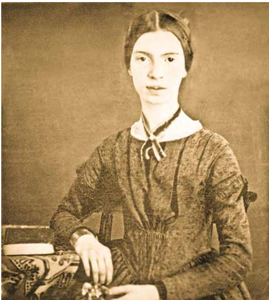
Emily Dickinson.

Ve všech kulturách se vyskytují pohádky, mýty nebo příběhy, které vypráví o tzv. cestě hrdiny. Je to cesta, na kterou se musí vydat každý člověk (jednotlivec), když chce dozrát. Tato cesta má několik neměnných složek. Například Janko se vydá na cestu. Rozhodne se tak, protože chce-li dozrát, musí z rodičovského domu odejít. Loučí se s ním matka. Na cestě potká mudrce nebo jinou podobnou postavu, která mu dá např. prsten, kouzelnou hůl nebo zázračné boty, které