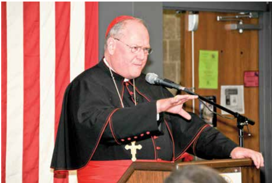
Kardinál Timothy Dolan.

Guvernér Andrew Cuomo odpověděl na výzvu newyorského arcibiskupa v dlouhém rozhovoru pro New York Times , ve kterém kardinála Dolana zařadil k „náboženské pravici“. Ten pak v odpovědi na svém blogu guvernéra, který se často označuje za katolíky, vyzval k opětovnému zvážení svých deklarací, protože „redukování lidských práv předčasně narozených na katolickou kauzu je uráž-