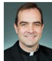
P. Carter Griffin Mercatornet Přeložila Michaela Vošvrđová

A to je tak vzdálené od nenávisti, jak jen může být.