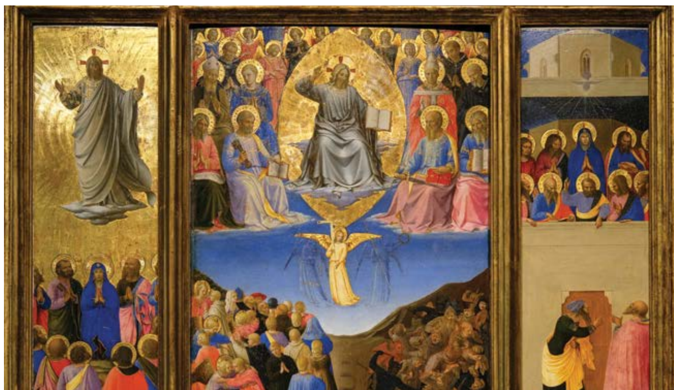
fra Angelico: Triptych – Nanebevstoupení, Poslední soud, Seslání Ducha svatého (1447–1448)