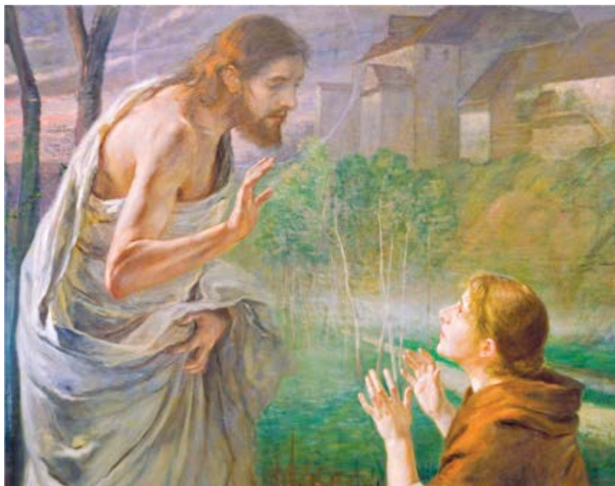
Fritz von Uhde: Nedotýkej se mě (1894)

A tady se dostáváme k vlastnímu smyslu onoho zjevování oslaveného Krista některým ženám a učedníkům ve čtyřicetidenním období od velikonoční neděle k nanebevstoupení. Ježíš jistě mohl „vstoupit na nebe“ hned při svém Zmrtvýchvstání. Ve skutečnosti byl Ježíš „u Otce“ skutečně již od svého Vzkříšení, ona čtyřicetidenní lhůta byla nutná pro nás jako jakýsi čas příprav a vedení k plnému pochopení pravdy, jako čas vnitřního budování Kristovy církve. Ona vidění žen a apoštolů bývala často napadána jako subjektivní výmysly zdrcených Ježíšových přátel či jako dodatečné snahy o smysluplný výklad Je-