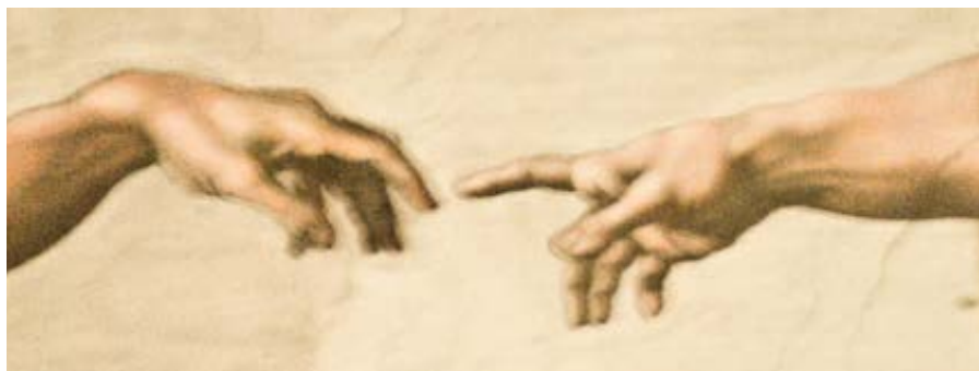
Michelangelo Buonarroti: Stvoření Adama (1508–1512)

Říká-li někdo, že potrestání démonů a bezbožných lidí je dočasné a že bude mít v nějaké době konec, nebo že dojde k opětovnému navrácení démonů a bezbožníků, anathema sit. Justiniánův edikt, r. 543