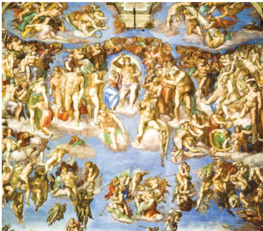
Michelangelo Buonarroti: Poslední soud (1536–1541)