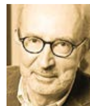
Sandro Magister L'Espresso Přeložil Pavel Štíčka

„V této souvislosti mezi německými katolíky existuje jasná tendence chápat právní uznání homosexuálních svazků a rovné zacházení s nimi, pokud jde o manželství, jako věc spravedlnosti. [...] Pokud si vztahy, v nichž jsou živé hodnoty jako láska, přátelství, spolehlivost, věrnost a vzájemná oddanost, zaslouží uznání z morálního hlediska, pak je třeba také uvažovat o jejich liturgickém uznání. [...] Mnozí si myslí, že je správné a pozitivní nabídnout obřad požehnání i homosexuálním pářům.“