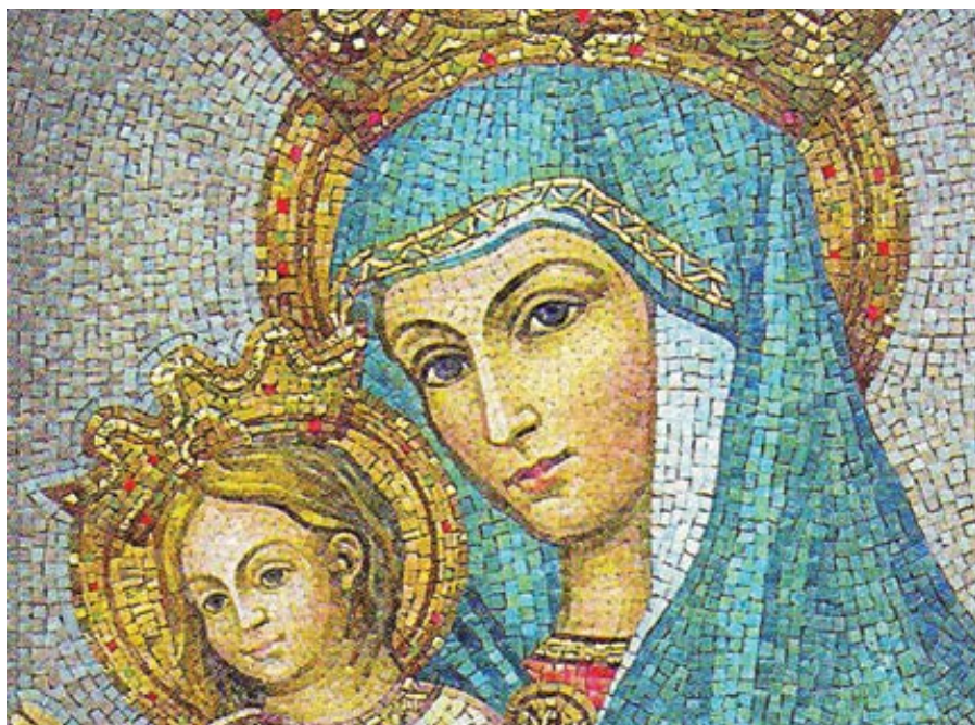
Mater ecclesiae.

S označením Panny Marie jako Mater Ecclesiae – Matka církve se setkáváme především v loretánských litaniích. Tato invocace však nebyla jejich součástí od počátku. Je plodem bohaté a hluboké mariánské nauky posledního koncilu, obsažené především v závěrečné kapitole Lumen gentium . Zde se sice o Panně Marii nemluví výslovně jako o Matce církve, ale říká se zde, že „katolická církev, poučena Duchem svatým, ji uctívá se synovskou láskou jako svou nejmilovanější Matku“ (LG 3) Především však koncil učí o tom, co je obsahem tohoto titulu.