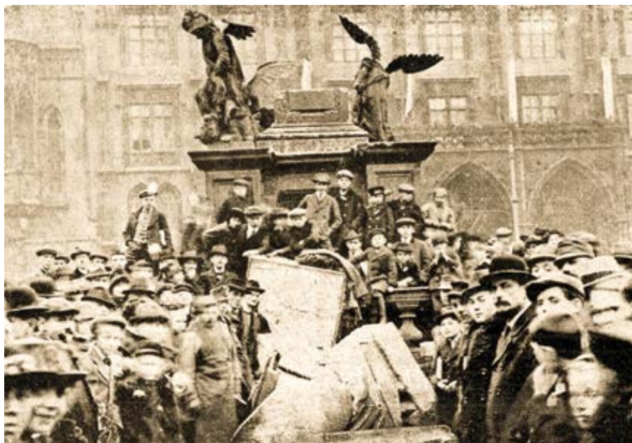
Stržení Mariánského sloupu.

Po druhé světové válce vyzýval k obnově Mariánského sloupu také tehdy