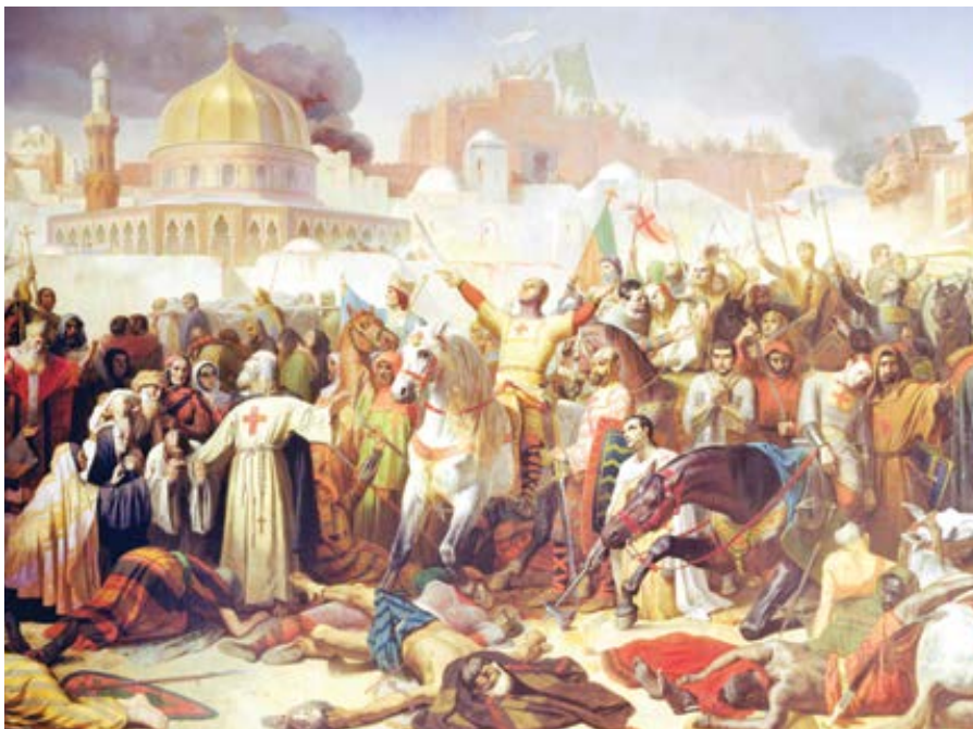
Emile Signol: Dobytí Jeruzaléma (1847)

Mylné představy o křížových výpravách jsou až příliš běžné. Křížové výpravy jsou obvykle zobrazovány jako sled svatých válek proti islámu, které byly vedeny papeži bažícími po moci a v nichž bojovali náboženští fanatici. Údajně byly typickým příkladem pokrytectví a nesnášenlivosti, černou skvrnou na dějinách katolické církve a obecně západní civilizace. Křižáci, jacísi předchůdci imperialistů, vedli západní agresi proti pokojnému Blízkému východu, kde potom znetvořili osvícenou muslimskou kulturu a zanechali ji v troskách. Pro různé variace na toto téma nemusíme chodit daleko.