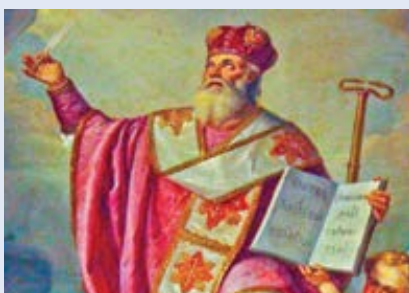
Sv. Atanáš.

Zbytek výprav ve 13. století dopadl jen o málo lépe. Pátá křížová výprava (1217–1221) dokázala nakrátko obsadit Damiettu v Egyptě, ale muslimové nakonec armádu porazili a město opět obsadili. Sv. Ludvík IX. Francouzský vedl za svůj život dvě křížové výpravy. Při první byla znovu dobytá Damietta, ale Egypťané Ludvíka brzy přelstili a přinutili ho opustit město. Přestože Ludvík pobýval ve Svaté zemi několik let a vynakládal množství prostředků na obranu, nikdy nedosáhl svého nejtoužebnějšího přání: osvobodit Jeruza-