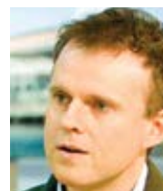
Andrew Doyle spisovatel a satirik