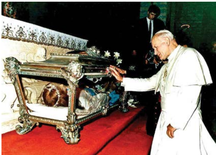
Sv. Jan Pavel II. uctívá tělo sv. Marie Goretti.

„Dnes potřebujeme prorockví, opravdové prorockví: nikoli mluvky, kteří slibují nemožné, nýbrž svědectví, že evangelium je možné. Nejsou třeba zázračné