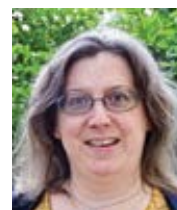
Anne-Françoise de Beaudrap francouzská žurnalistka