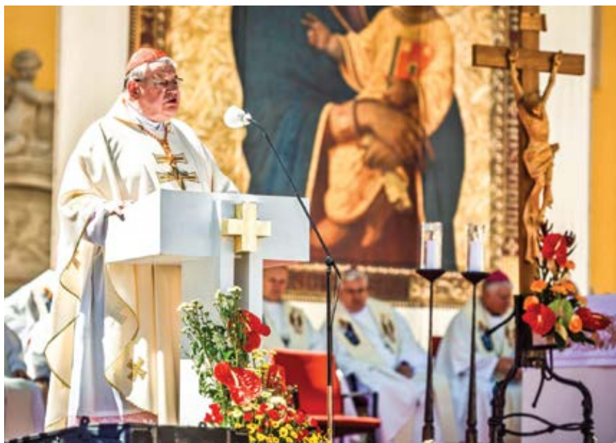
Kázání Dominika kardinála Duky na Velehradě.

Odvážím se tvrdit, nebylo by tohoto radostného dne, kdyby pět let předtím v roce 1985 se zde nekonala slavná cyrilometodějská pouť, na kterou papež Wojtyła nemohl přijet, bylo mu to zakázáno. Myslím, že mohu tvrdit, že tato pouť na začátku perestrojky patřila k nejradostnějším a také i nejvýznačnějším projevům naší víry a touhy po svobodě, z které žije církev i v dnešních dnech. Tato pouť nám,