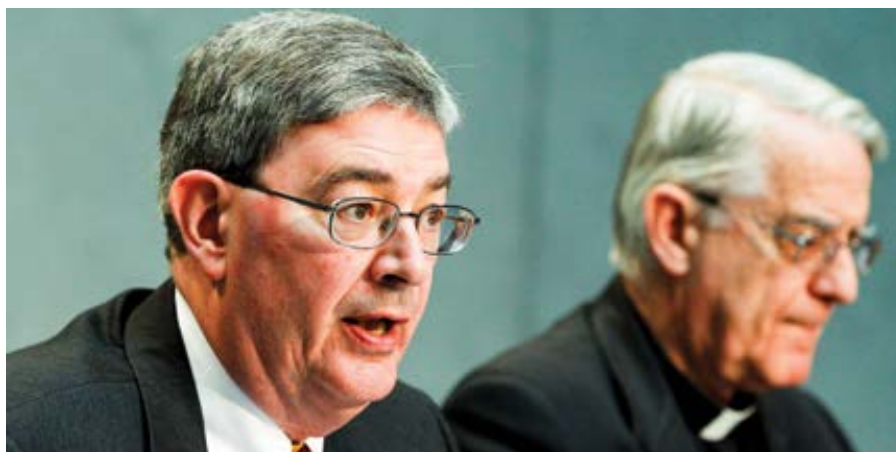
George Weigel.

Weigel zmínil několik zemí, kde církevní představitelé navrhují dalekosáhlé přizpůsobení sekulární kultuře. V Německu biskupové zahájili „závazný synodální proces“, který zkoumá aspekty církevního učení a disciplíny, a zvažují žehnání svazkům homosexuálů, svěcení žen a zrušení kněžského celibátu. Místní zástupci laiků v tomto procesu o sobě