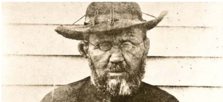
Damián de Veuster.

Představte si, že čtete v Písmu o utrpení Páně. Běžný způsob je, že si úryvek pomalu přečteme, pak znovu a po verších a přitom si představujeme celou situaci a rozjímáme. To je pořád naše vlastní myšlenková činnost. Pokud se objeví v tuto chvíli kontemplace, může mít mnoho podob. Nezapomeňte, že u Boha je všechno nekonečné a bez konce je i jeho fantazie. Může se vám v jediném