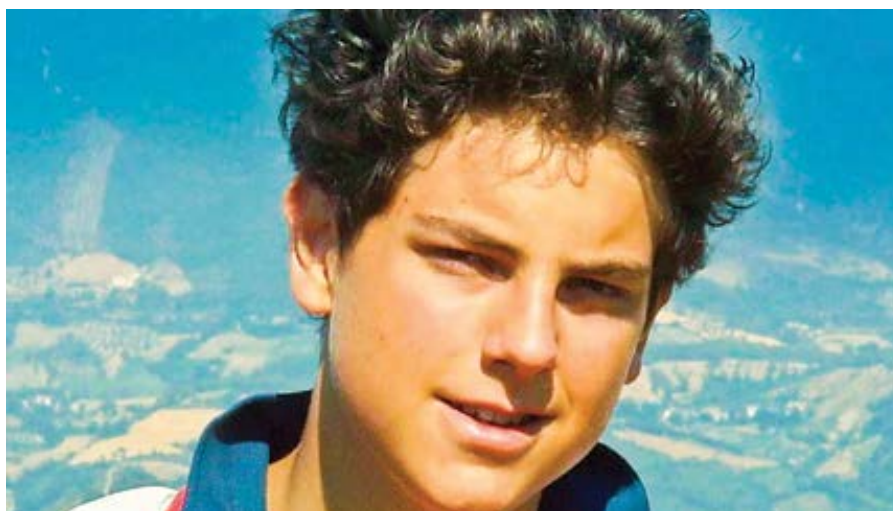
Carlo Acutis.

Fotografie ostatků zanedlouho blahorečeného chlapce ukázaly, že byl pohřben v džínách a obyčejné teplákové bundě – oblečení, jaké byl zvyklý nosit a ve kterém je vidět i na mnoha fotkách pořize-