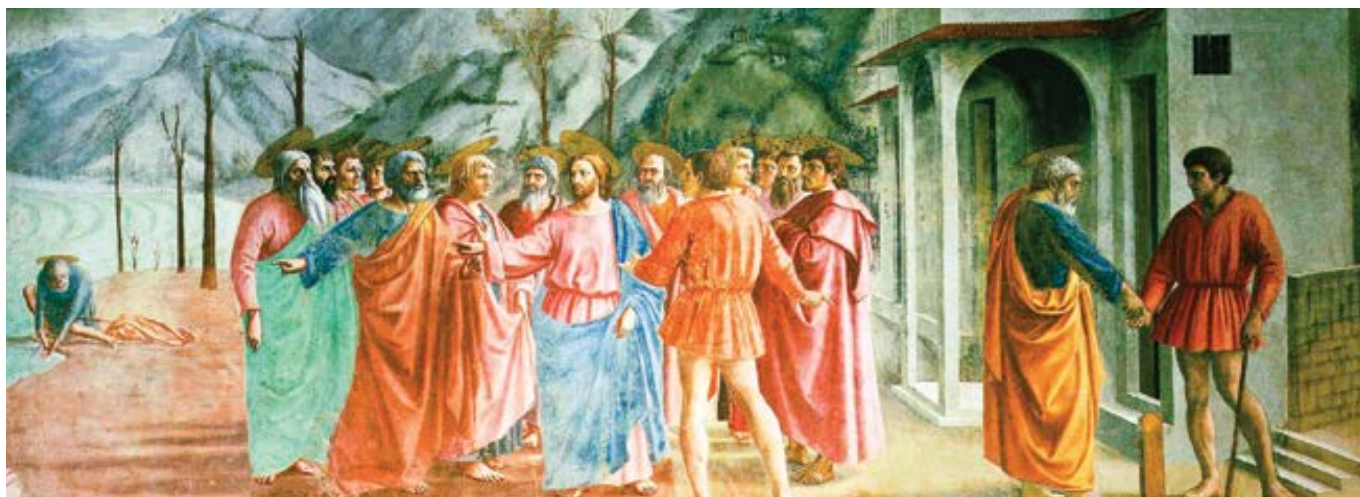
Masaccio: Peníz daně (1427)

18. října – 29. neděle v mezidobí, Evangelium – Mt 22,15–21