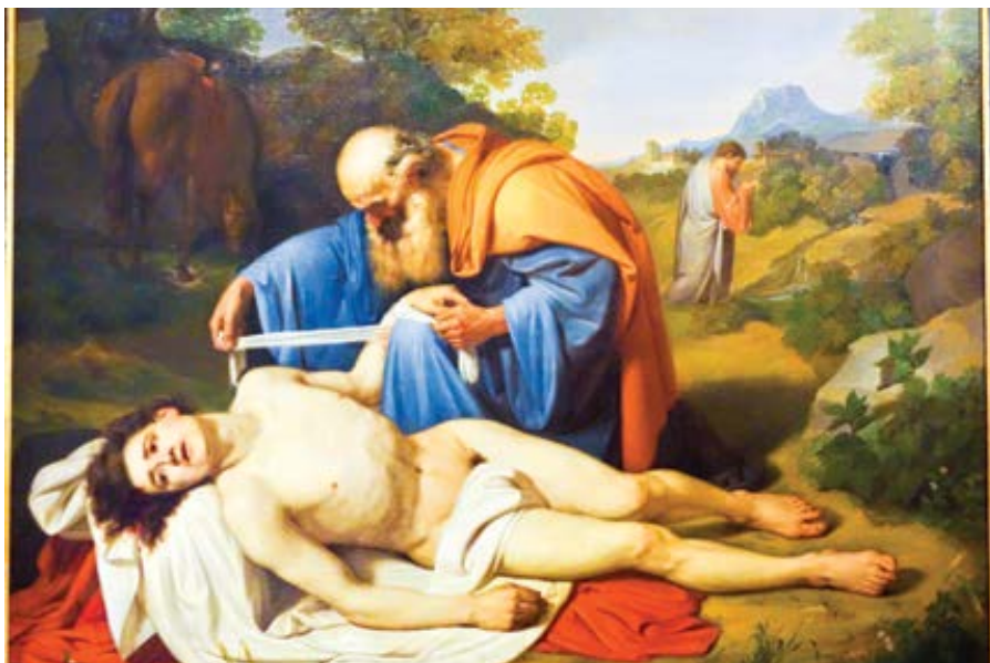
Luigi Sciallero: Dobry Samaritan (1854)

Kristus spojuje „největší a první příkázání“ lásky k Bohu s „druhým příkázáním podobným prvním“, příkázáním lásky k bližnímu (Mt 22,36–40). K tomu dodává: „Na těch dvou příkázáních spočívá celý Zákon i Proroci.“ A Jan teolog píše zcela jasně: „Kdo nemiluje, nepoznal Boha“ (1J 4, 8). Podobství o milosrdném Samařanovi je blízké podobství o posledním soudu (Mt 25,31–46 a L 10,25–37). Tento biblický text nám zjevuje plnou pravdu o příkázání lásky. V tomto podobství kněz a levita představují náboženství, které je uzavřeno samo do sebe a stará se jen o dodržování neměnného „zákona“, a přehlíží a farizejsky zanedbává „to, co je v zákoně nejdůležitější“ (Mt 23,23), lásku a pomoc bližnímu. Milosrdný Samařan byl cizinec, který se projevil jako filantrop a bližní vůči tomu, kterého zbili a zranili lupiči. Na úvodní dotaz znalce zákona „Kdo je můj bližní?“ (L 10,29) Kristus odpovídá otázkou: „Kdo z těch tří, myslíš, byl bližním tomu, který upa-