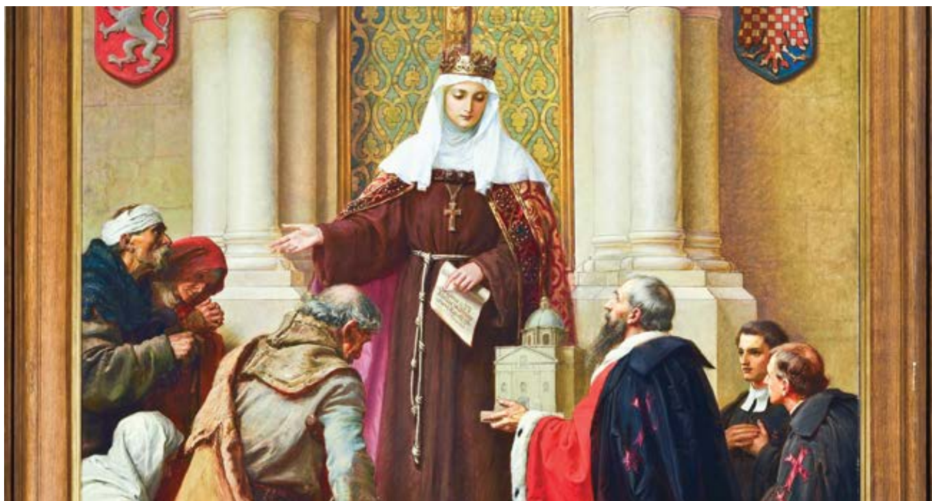
Sv. Anežka Česká.