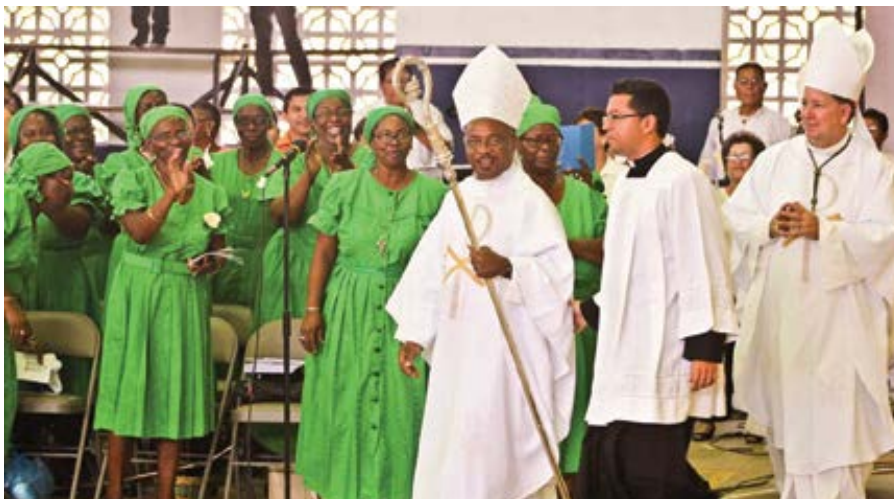
Biskup Lawrence Nicasio.

ské vlády uvedlo, že je zapotřebí zákon o rovných příležitostech kvůli „řešení a prevenci problémů s diskriminací, stigmatizací a násilím“.