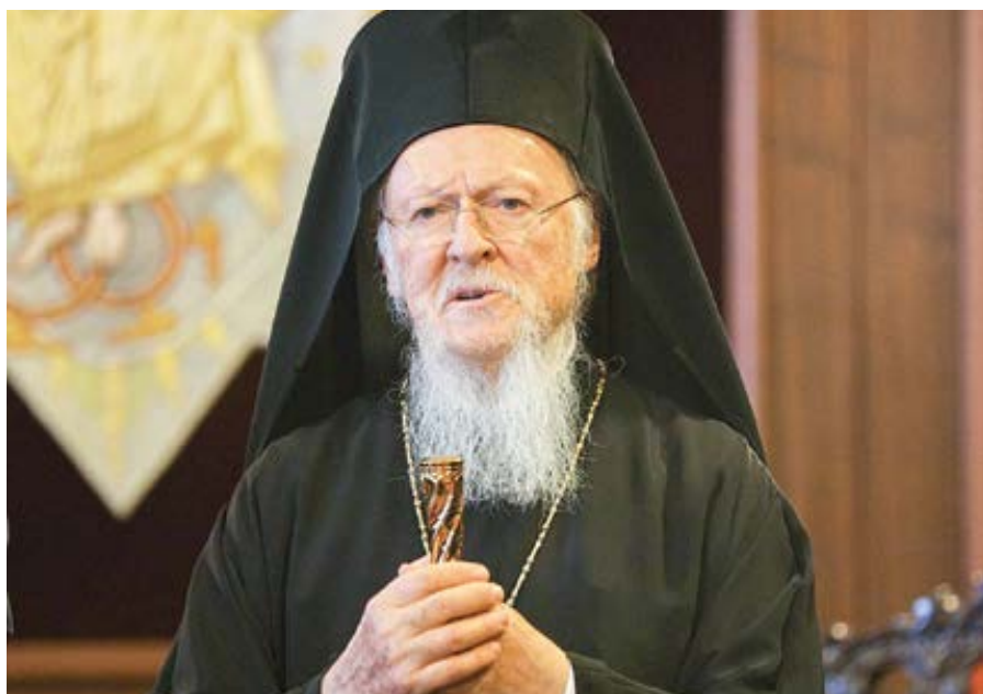
Patriarcha Bartoloměj I.

Plně souhlasíme s výzvou Jeho Svatosti, abychom upustili od lhostejnosti či dokonce cynismu, které ovládají náš ekologický, politický, ekonomický a sociální život obecně – a to včetně naší sebestředné formy jednoty, a abychom snili o světě jako sjednocené rodině všech lidí, kde všichni bez výjimky budeme bratry a sestrami. V tomto duchu vyjadřujeme