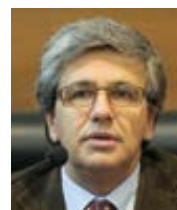
Andrea Tornielli Vatican News

K tomuto tématu se vyjádřil Svatý a velký koncil pravoslavné církve (Kréta, červenec 2016) takto: „Kristova církev obecně odsuzuje válku a považuje ji za důsledek přítomnosti zla a hříchu.“ (Poslání pravoslavné církve v dnešním světě, D, 1) Každý křesťan by měl přijmout za svůj slogan „Už nikdy žádnou válku!“ A postoj společnosti k trestu smrti je indikátorem kulturní orientace a úcty k lidské důstojnosti. Hodnotový systém evropské ústavní kultury, kde jedním z jejích základních pilířů je myšlenka lásky jako výraz křesťanské víry, od nás vyžaduje, abychom brali v úvahu, že každému člověku musí být dána možnost pokání a polepšení, a to i když spáchal ten nejhorší zločin. Logickým a morálním důsledkem by pro toho, kdo odsuzuje válku, mělo být i odmítnutí trestu smrti.