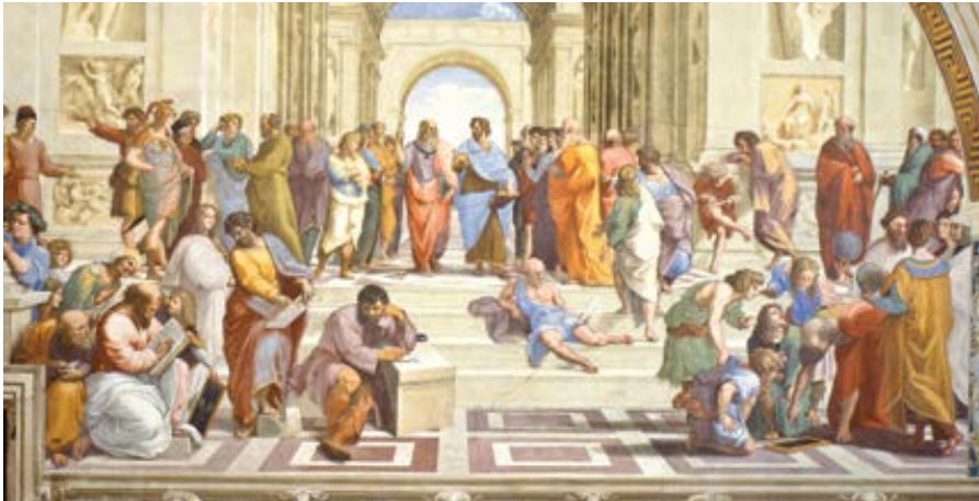
Rafael Santi: Athénská škola (1511)

méně, jak jsem ti řekl na začátku, je zbytečné se těmito potížemi zabývat, protože dnes už pro nás nemají žádný význam.