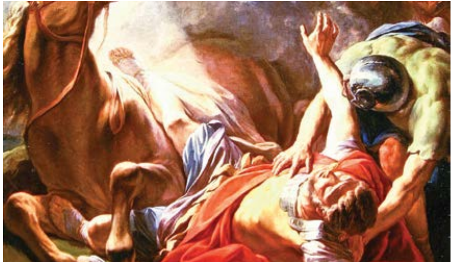
Nicolas Bernard Lépicier: Obrácení sv. Pavla (1767)

Problém spočívá v tom, že pokud jde o Krista a křesťanství, zásadní lidský pokrok – ať již pro naši pozemskou pouť či pro náš nadpřirozený úděl – prostě není možný bez radikálního obrácení k Ježíši Kristu (slovo „radikální“ znamená „u kořene“). Z tohoto důvodu je veškerý lidský pokrok iluzorní, pokud není motivovaný Ježíšem Kristem a směřovaný k němu. Jinými slovy, nikdy nebude fungovat, pokud se církev bude pouze přizívat na