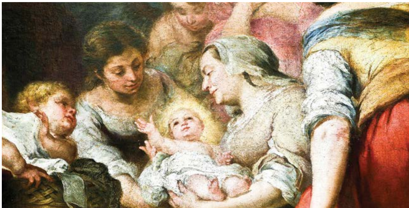
Bartolomé Esteban Murillo: Narození Panny Marie (1661)