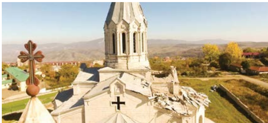
Foto: poničená historická katedrála Krista Spasitele Arménské apoštolské církve v Šuše, Náhorní Karabach.

měsíční plat za boj proti takzvaným káfi-rům, což je arabské označení pro nevěřící, přičemž za každou hlavu křesťanského Arména měli dostat zvláštní odměnu.“