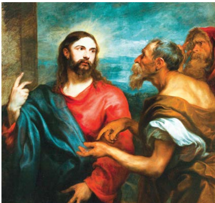
Anthony van Dyck: Kristus o mincích (cca 1625)

Když nás Bůh stvořil, vložil do nás svůj obraz a podobu a propůjčil nám určitá nezcizitelná práva (použijeme-li nám tak drahý obrat z Deklarace nezávislosti).