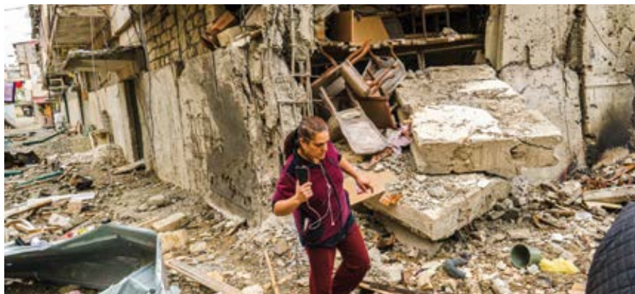
Foto: Náhorní Karabach / Republika Arcach během bombardování na podzim 2020.

Arménie se pyšní tím, že jako první národ přijala křesťanství za státní nábo-