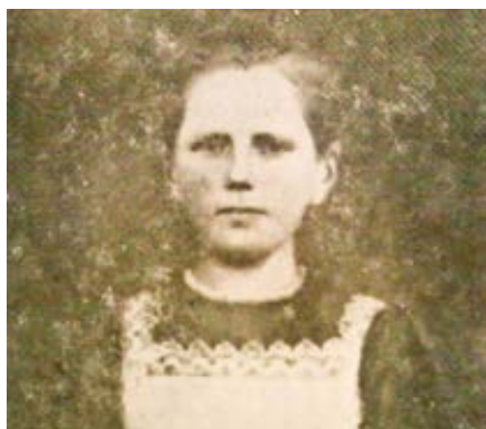
Bl. Karolína Kózky

Také generální audience byla kvůli pandemickým okolnostem přenášena z knihovny Apoštolského paláce.