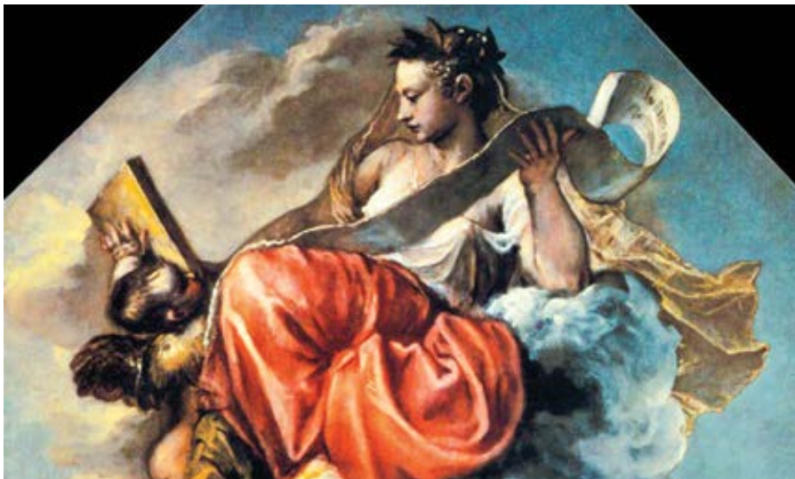
Tizian: Moudrost (cca 1560)

F: Jedna věc je být moudrý či být za moudrého považován, druhá věc je zabývat se myšlenkově moudrostí jako důležitou otázkou. Když se ptám na toho, kdo s takovými úvahami přišel jako první,