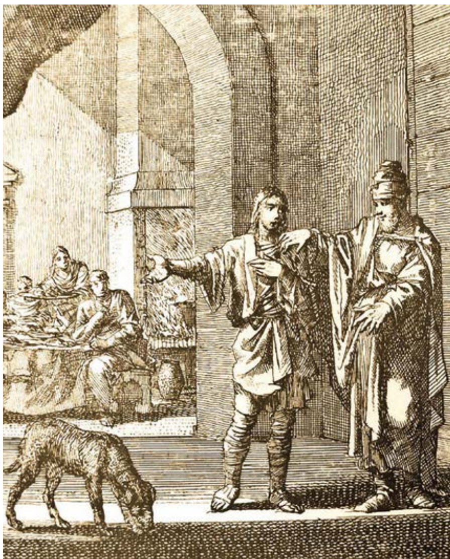
Jan Luyken: Věrný a moudrý služebník (1712)

A všimni si, že neřekl: „Nevím, kdy přijde ten čas,“ ale „nevíte“. Skryl to totiž pro náš užitek. Protože pokud jsme nedbalí nyní, kdy nevíme, kdy přijde konec, co bychom dělali, kdybychom o něm věděli? Konali bychom své zlé činy až do posledního dne. A povšimněme si i jednotlivých výrazů: večer přijde konec tehdy, kdy člověk zemře pro své stáří, o půlnoci, když zemře mladý, za ranního kuropění, když dosáhneme plnosti rozumu a ráno je věk dětství. Všichni jmenovaní potřebují počítat s tím, že může přijít konec. I dítě si musí dávat pozor na to, aby nezemřelo nepokřtěné.