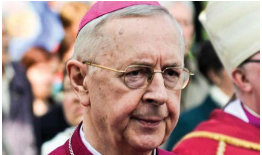
Arcibiskup Stanisław Gądecki.

Ústavní soud vydal své usnesení poté, co skupina sto devatenácti poslanců