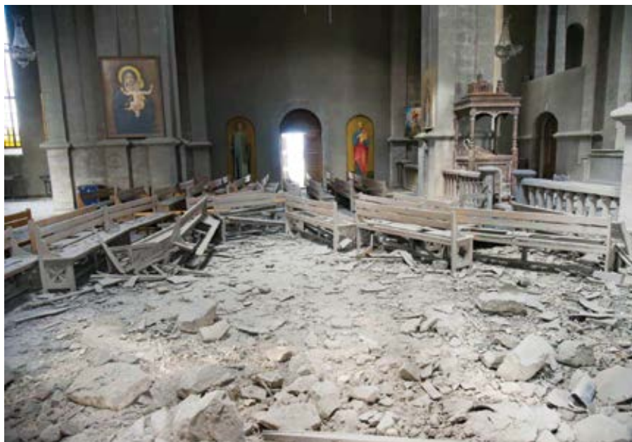
Vybombardovaná katedrála Krista Spasitele v Šuše, říjen 2020.