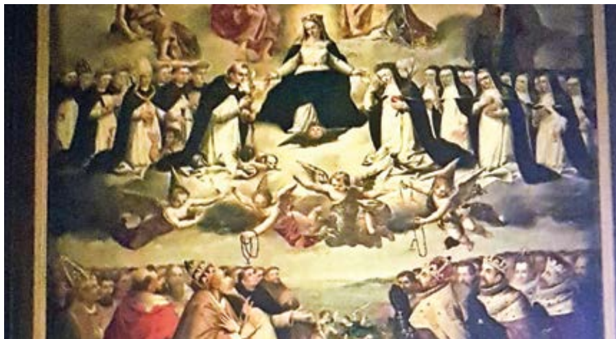
Malba v kapli sv. Josefa v nizozemském Maastrichtu, 17. století

a mše na zemi i modlitby v nebi ti budou pomoci u trůnu Nejvyššího.