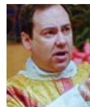
P. John Zuhlsdorf katolický kněz, blogger, publicista

Nevim, co se děje v Africe, Jižní Americe a tak dále. Ale zdá se mi, že toto nařízení by mohlo ve svém efektu bránit také růstu tradičně orientovaných řeholních institutů. Ve skutečnosti se totiž minimálně na západní části světa zakládají pouze nové společnosti, které jsou nakloněny tradici.