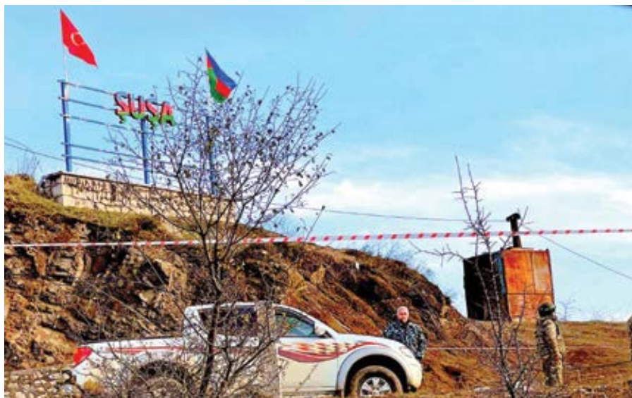
Kontrolní stanoviště blízko Šuše, listopad 2020.