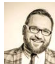
Andrzej Gajcy Onet.pl Překlad LS, redakčně kráceno

Vždyť to otevřeně přiznávají také vůdkyně Stávky žen a poslankyně uskupení Lewica (Lewica), které argumentují, že nikdo nemůže ženám omezovat právo volby, že mají právo rozhodovat, zda dítě porodí. Jinak řečeno: nikdo nemá právo omezovat ženy v právu na potrat, jehož důsledkem je zabití ještě nenarozeného dítěte. Malého člověka, jemuž bije srdce, funguje mozek a nervový systém. Dítěte, jež (jak to dokládají lidské příběhy) často může normálně žít, anebo – v případě nejtěžších vad – důstojně zemřít. Jako člověk.