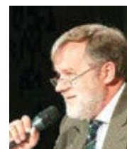
Jürgen Liminski Die Tagespost Přeložil Pavel Štíčka

jako si to mysleli komunisté a socialisté v minulém století. Křesťané v Evropě mohou být bez ohledu na politické okolnosti vděční Maďarům a Polákům za to, že brání primát přirozeného práva proti dnešním Pilátům.