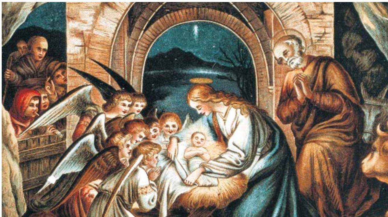
Andělé se modlí při narození Krista