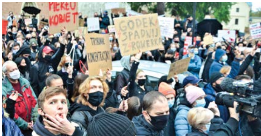
Protesty proti rozhodnutí Ústavního soudu, Krakov, říjen 2020.

ly prostřednictvím šestibarevných duhových vlajek. Formy protestu, které si zvolily, vedou ke slovní a fyzické agresi, k devastaci a profanování sakrálních objektů, k blokadám měst.