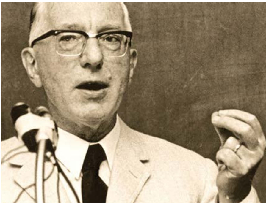
filosof Eric Voegelin.

F: Nezapomínej, že Voegelin mluví z vlastní zkušenosti univerzitního profesora. Upozorňuje nás, že již v jeho době