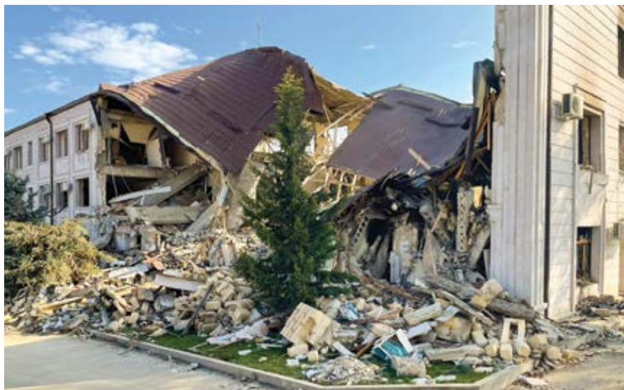
Stepanakert, hlavní město Náhorního Karabachu, listopad 2020.

A Rubin dodal: „Írán a Spojené státy mohou být nepřátelé, ale měly také možnost spojit síly. Například po pádu Tálibánu Teherán i Washington společně pomáhaly vytvořit novou afghánskou vládu. Írán a Spojené státy byly převážně na stejné straně v boji proti Islámskému státu.“