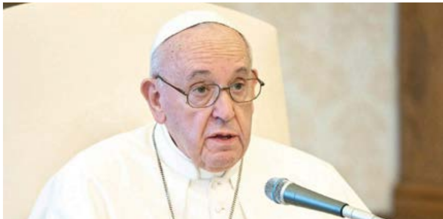
Papež František během generální audience 8. června 2020.

Motivací této změny, vysvětlil P. Puig, je vyjasnění výkladu tohoto zákona, které v roce 2016 požadovala Kongregace pro společnosti zasvěceného života a společ-