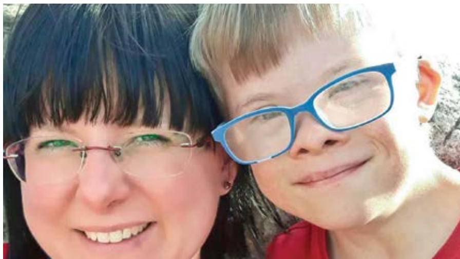
Mluvíci iniciativy „Zastavme potraty!“ Kaja Godek se synem Wojtkem.