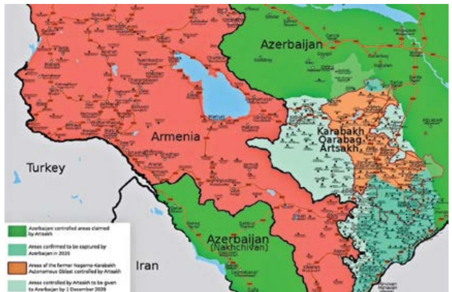
Mapa konfliktu v Náhorním Karabachu k 9. listopadu 2020.

Kongresový výbor pro arménské záležitosti v listopadu vydal prohlášení,