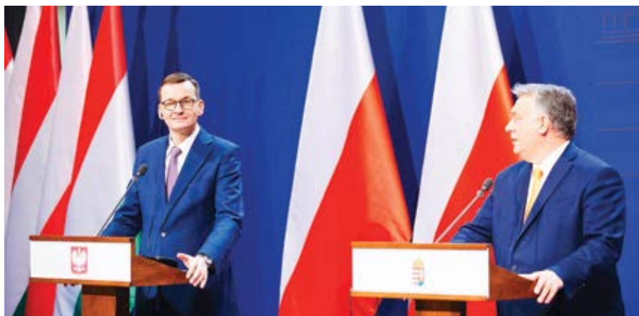
Polský premiér Mateusz Morawiecki a maďarský premiér Viktor Orbán.

Maďarský projekt je přitom založen na důkazech o lidské přirozenosti, zatímco projekt Bruselu oproti tomu stojí na vůli a myšlence tuto přirozenost předefinovat. Jedná se o nevyhlášenou kulturní válku vedenou jinými prostředky. A proto se