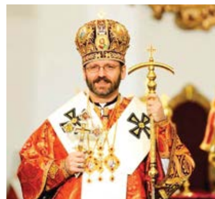
Mons. Svjatoslav Ševčuk, arcibiskup ukrajinské řeckokatolické církve a Vyšší archieparcha Kyjevsko-Haličský.

Formace těchto mladých mužů v semináři je možná díky darům, které přicházejí z celého světa. Tyto dary posílá organizace Pomoc církvi v nouzi (ACN).