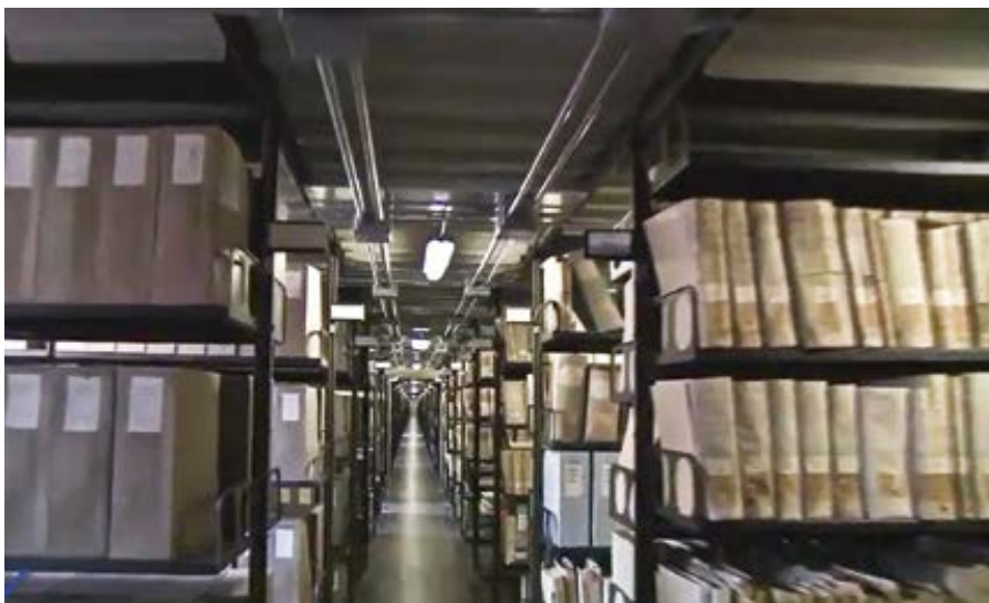
Vatikánský apoštolský archiv.