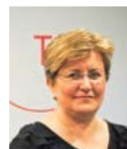
Dolores Massot Aleteia Přeložil Pavel Štička

Všichni můžeme přispět, bez ohledu na to, kde žijeme, abychom podpořili řeckokatolickou církev na Ukrajině – a papež František opakovaně řekl, že je to jeho přání – a pomohli těmto mladíkům dokončit jejich formaci a studia, aby se mohli stát kněžími, které jejich komunity potřebují. Pošlete jim upřímný dar víry!