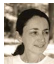
Christine Ponsardová Aleteia Přeložil Pavel Štíčka

Veliké štěstí mají ty děti, které se mohou na své cestě k Bohu spolehnout na své prarodiče, strýce, tety a další členy rodiny.