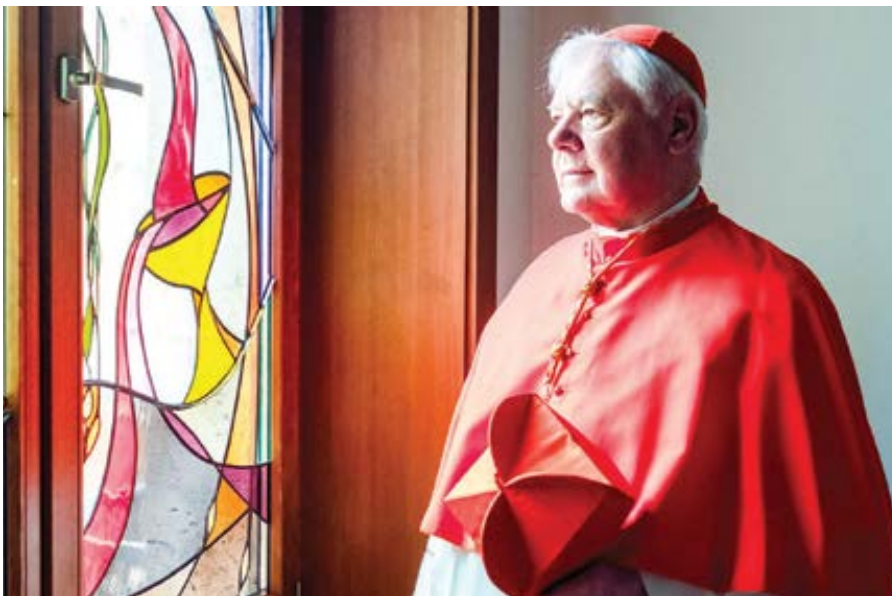
Kardinál Gerhard Müller.

„Jedem, který ochromuje církev, je názor, že bychom se měli přizpůsobit duchu doby, duchu tohoto věku, a ne duchu Božímu,“ řekl kardinál.