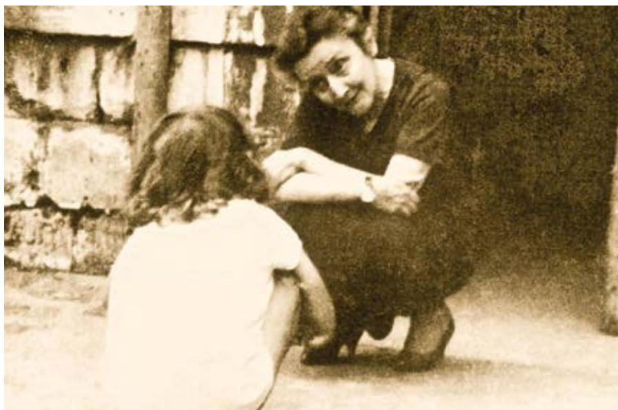
Madeleine Delbrêl, misionářka periferií.

tám, jako zázrakem se rozmnoží: Bůh vstoupí do našeho života, zbytek z něj odejde. Jako když padá suché listí, tak najednou uvidíme, jak se nám uvolňuje mnoho dalších minut strávených sledováním bůhvíčího v televizi, sněním nad katalogem nebo surfováním na internetu.