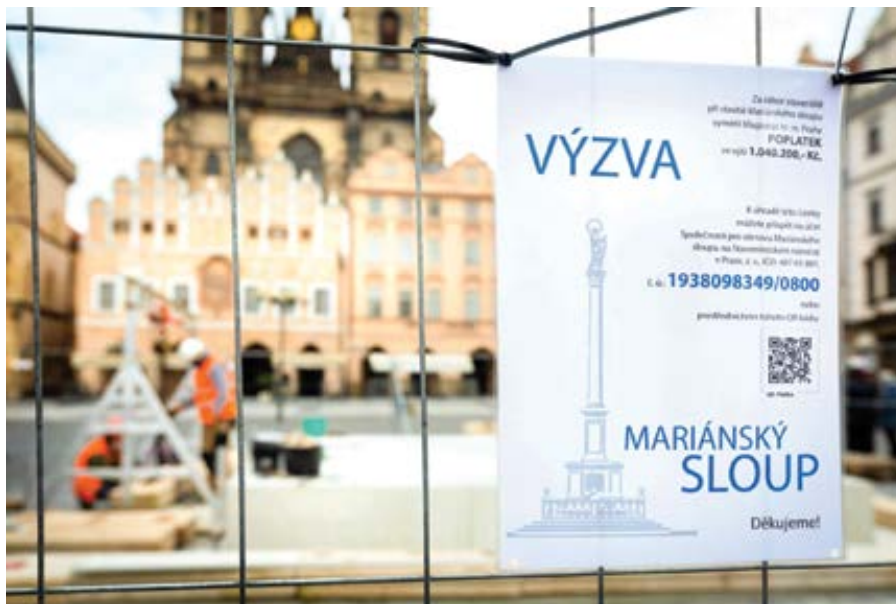
Ani v období ohrožení koronavirem se nezastavily práce na obnově Mariánského sloupu na Staroměstském náměstí v Praze.