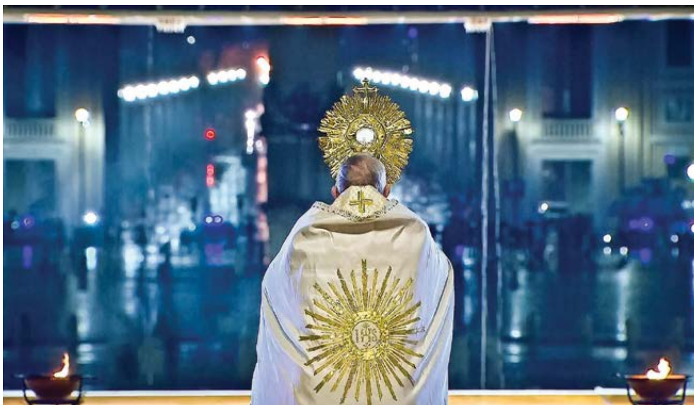
Mimořádné požehnání Urbi et Orbi – přenos TV Noe z 27. března 2020.