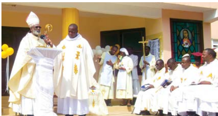
Arcibiskup Charles Palmer-Buckle.

„Když patříte k dané skupině, automaticky také přejímáte její stanoviska