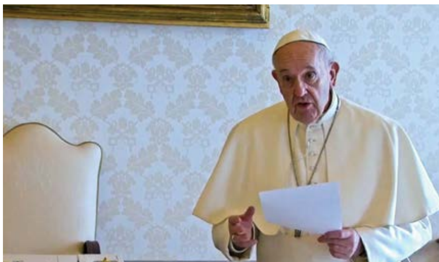
Přenos společné modlitby Otče náš se všemi křesťany na světě s papežem Františkem.

Apoštolská penitenciárie v pátek 20. března vydala dekret, kterým umožňuje získání plnomocných odpustků lidem nakažených koronavirem, těm kteří je ošetřují a stejně tak všem věřícím, kteří se za ně modlí.