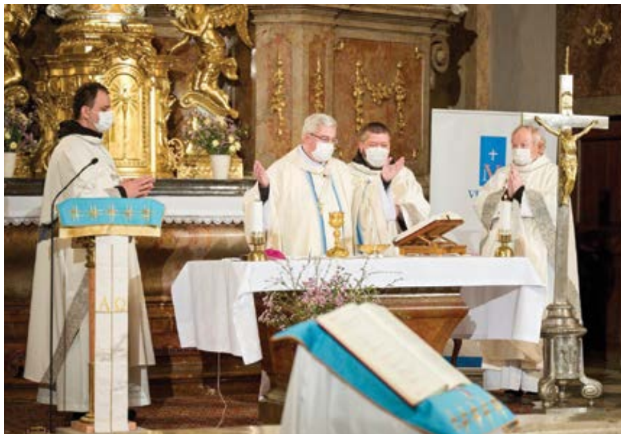
Mše svatá o Slavnosti Zvěstování Páně z kostela Narození Panny Marie ve Vranově u Brna.

Od pradávna se uznává, že nikdo není vázán vykonávat nemožné. Pokud byla mše svatá v místě, kde se člověk nachází, zrušena (a přestože se předpokládá vynaložení určitého úsilí k nalezení mše v jiném místě), nevyžaduje se od něj, aby vyvíjel neúměrně náročnou snahu vyhledat mši někde jinde a účastnit se jí. Jistě, kanonické právo předpokládá, že účast na mši svaté, dokonce i na povinné mši svaté, může být někdy nemožná a doporučuje, aby se tito věřící zapojili do nějaké jiné liturgické činnosti (například