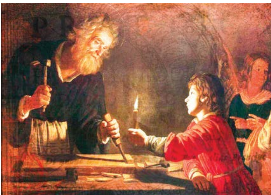
Gerard van Honthorst: Kristovo dětství (cca 1620)

Nástupce blahoslaveného Pia IX. na stolci sv. Petra, papež Lev XIII., neváhal proto dovolávat se ochrany snoubence Panny Marie nad církví ve své modlitbě, kterou připojil na závěr své encykliky o svatém Josefovi Quamquam pluries , kterou jako první a prozatím poslední papežskou encykliku o svatém patriar-