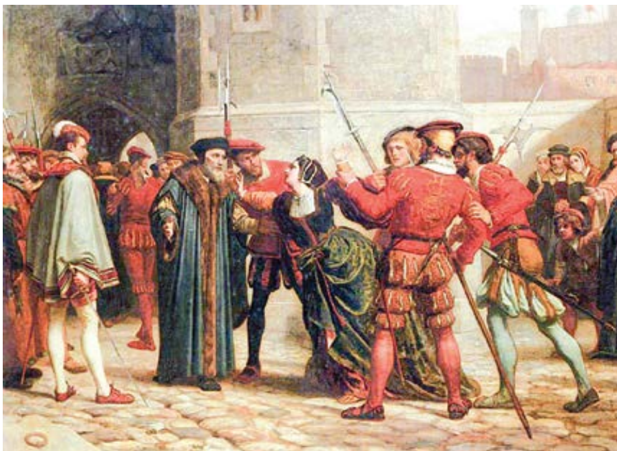
William Frederick Yeames: Na smrt odsouzený Tomáš More se setkává se svou dcerou (1872)