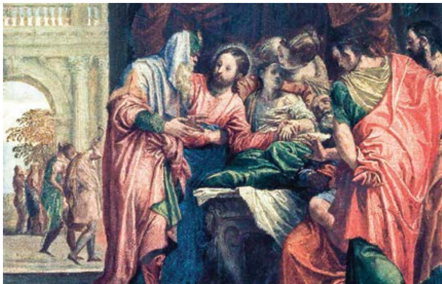
Paolo Veronese: Uzdravení jairovy dcery (40. léta 16. století)

27. června 2021 – 13. neděle v mezidobí – Mk 5,21–43