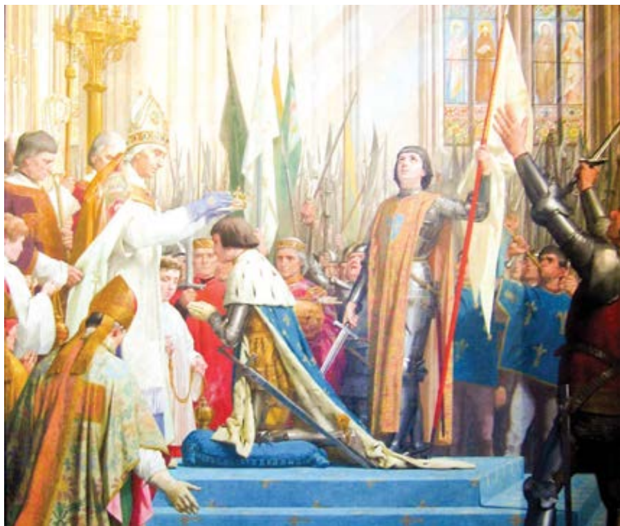
Eugène Delacroix: Johanka z Arku (1880)

Poté, co podnikla cestu do Chinonu, kdy musela projít zeměmi v držení Anglie a burgundského vévody, který zpochybňoval původ Karla VII., Jana dauphinovi neochvějně řekla, že jí Bůh, archanděl Michael a svatá Kateřina Alexandrijská a Markéta Antiochijská nařídili, aby vykonala tři úkoly: osvobodit město Orléans z téměř stoleté anglické nadvlády, postarat se o dauphinovu korunovací a posvěcení v Rameši, hluboko na nepřátelském území, a vyhnat Angličany z Francie.