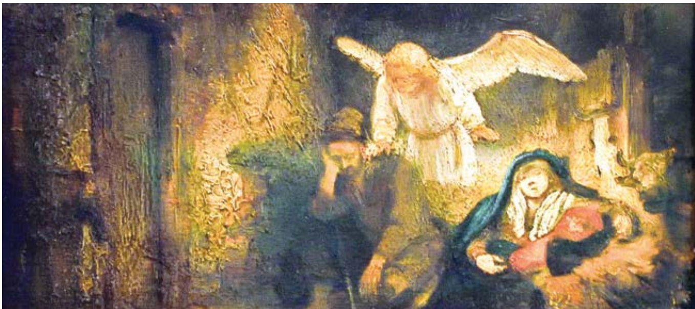
Rembrandt: Josefův sen (1645)

10 věcí, které byste měli vědět o sv. Josefu