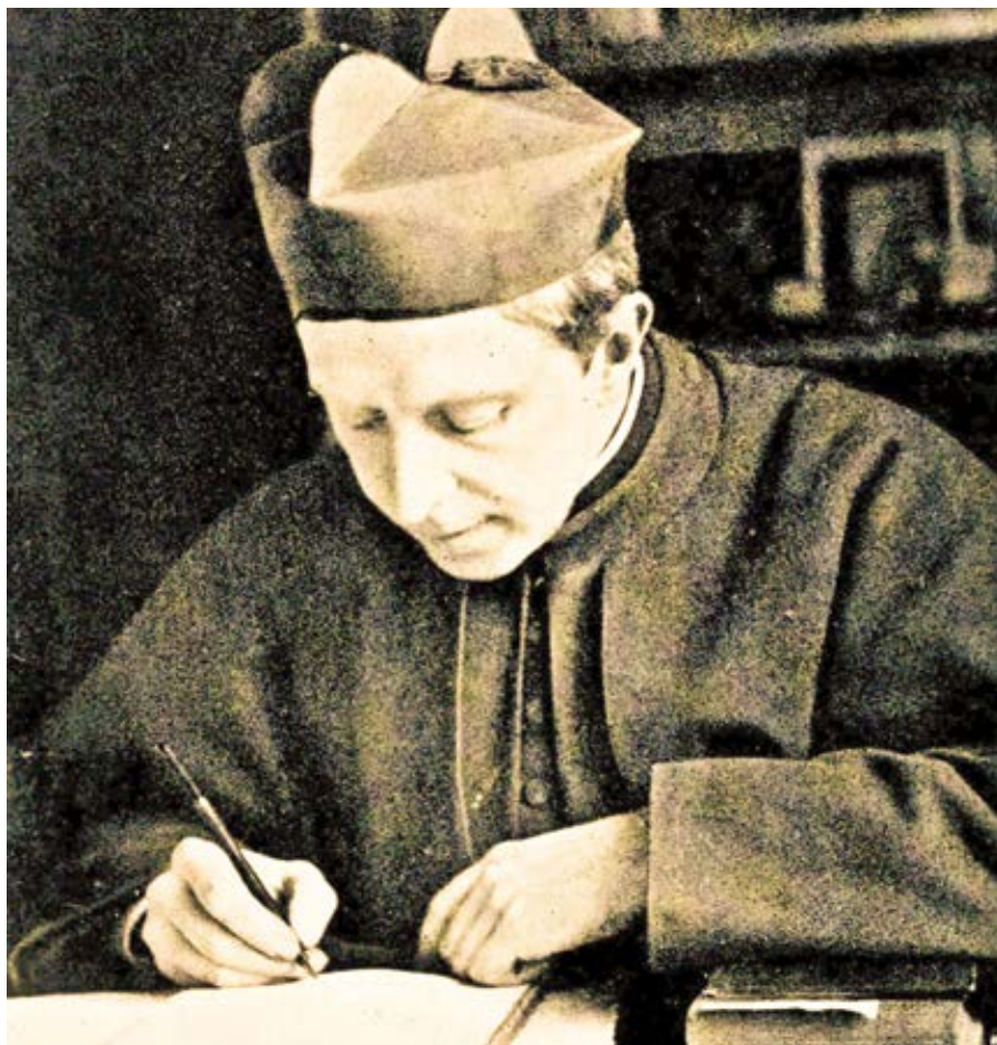
Robert Hugh Benson.

odhalily dlouholeté jádro liberální vlády. Liberální politika, která se považuje za pouhou formu „managementu“, neuchopila či nedokázala vyjádřit nárok vládnout. Liberalismus, který je však okolnostmi neustále nucen vládu vykonávat, se rychle stává zoufalým, vystrašeným, reakčním a despotickým.