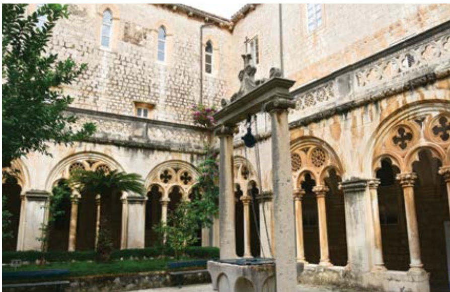
Dominikánský klášter.

Navzdory dlouhé a slavné historii katolické církve v Německu – jež pozorně naslouchala sv. Bonifácovi a zdobily ji takové osobnosti jako Hildegarda z Bingen a Albert Veliký – se katolíci stali velkými protivníky modernizující-