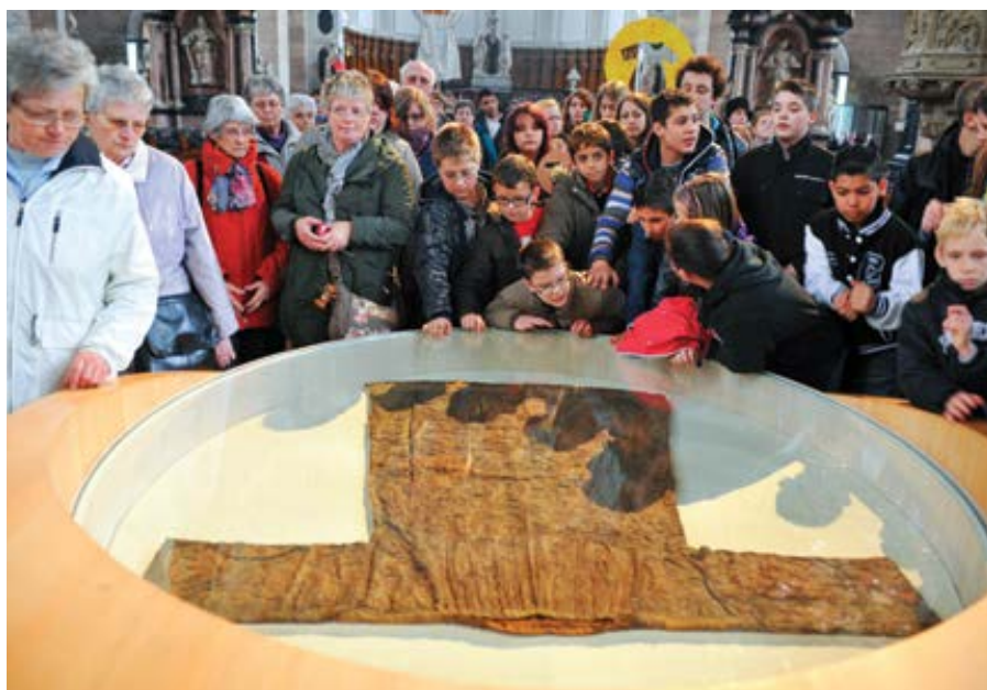
Poutníci a návštěvníci si v katedrále v Trevíru prohlížejí „svaté roucho“.

vědí, co je normální, a vysvětlovaly, že alternativní způsoby vyjádření osobnosti si snad nikdo nemůže zvolit dobrovolně. Antikatolická literatura zesměšňovala celibát a mnišský životní styl nejen tím, že prostě popisovala mužnost, ale snažila se ji navíc zfalšovat. Jak tedy současný teoretik genderu s ohledem na tyto incidenty a bez jakékoli kvalifikace může tvrdit, že církev utiskovala a sekularismus osvobozoval?