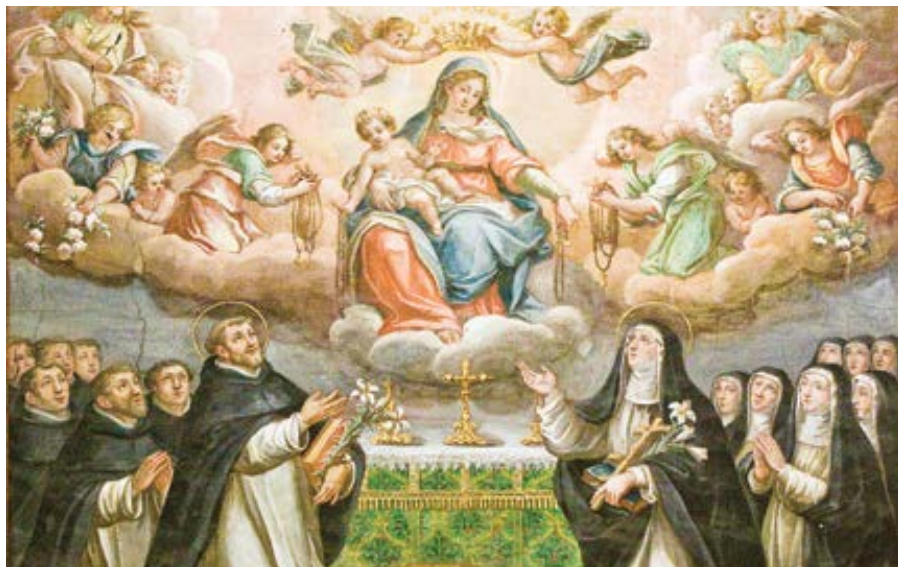
Naše Paní dává růženec dominikánům.

literatury byly „příběhy z kláštera“, které vyprávěly o mladé ženě, jež se vzdala vyhlídky na řádný středostavovský život a vstoupila do řádu, kde však byla podrobena citovému, tělesnému a sexuálnímu týrání.