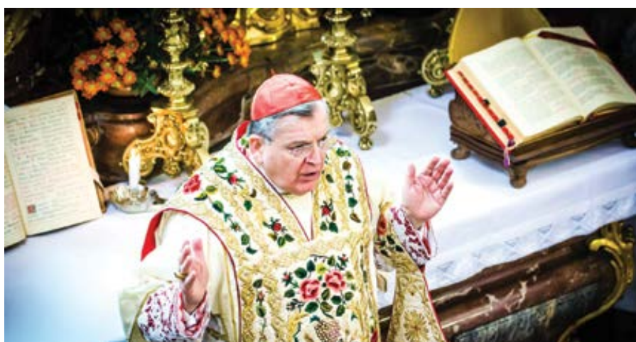
Kardinál Raymond Burke.

Podle Františkova nového motu proprio však bude ve „výlučné kompetenci“ diecézního biskupa „podle pokynů Apoštolského stolce povolit ve své diecézi používání Římského misálu z r. 1962“. Biskup také dostane dalekosáhlé pravomoci, mimo jiné udělovat souhlas kněžím, kteří si přejí slavit starou mši svatou, i těm,