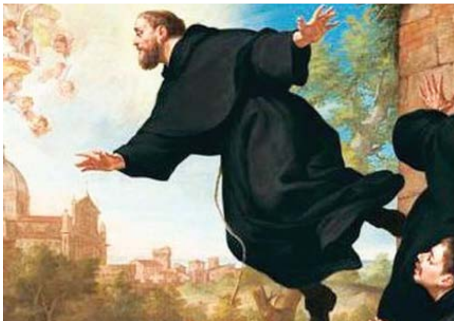
Ludovico Mazzanti: Levitující sv. Josef Kupertinský (18. století)

Jednou Juniper navštívil nemocného řeholníka a zeptal se ho, zda by mu mohl nějak posloužit. Mnich ho požádal o vepřovou nožičku k jídlu, ta by mu prý poskytla velkou útěchu. Bratr Juniper, který cítil nutkání nemocnému mnicho-