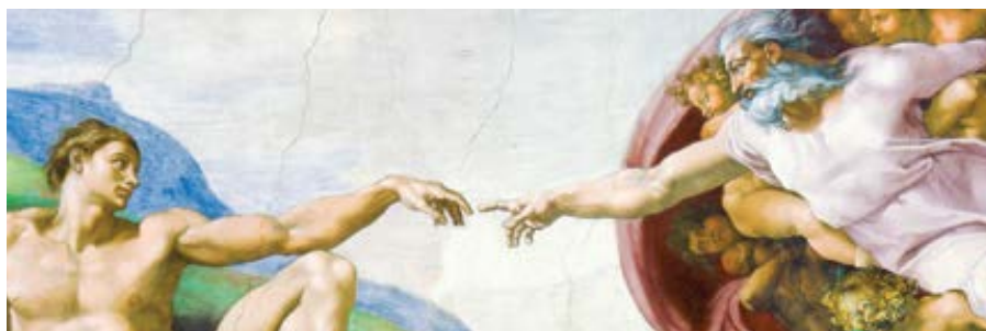
Michelangelo: Stvoření Adama (cca 1511)

8. srpna 2021 – 19. neděle v mezidobí – Jan 6,41–51