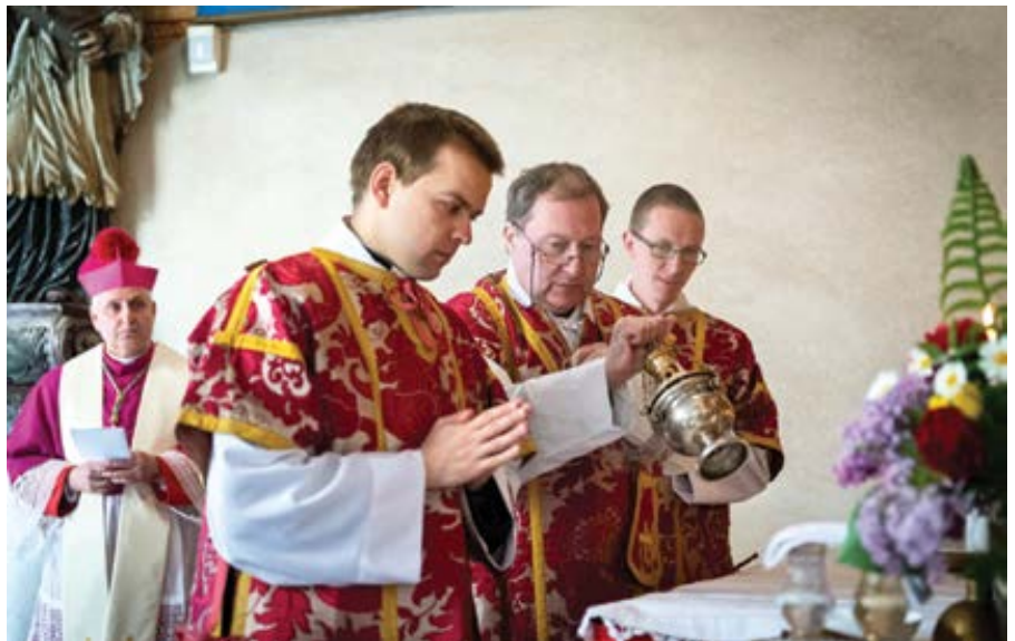
Svátost biřmování v Římově.

František však napsal, že „na obou stranách“ vidí pochybení při slavení liturgie; na jedné straně, při používání nového misálu, „deformace, které jsou na hranici únosnosti“, ale také „instrumentální používání“ Římského misálu z roku 1962, jež se „stále více vyznačuje rostou-