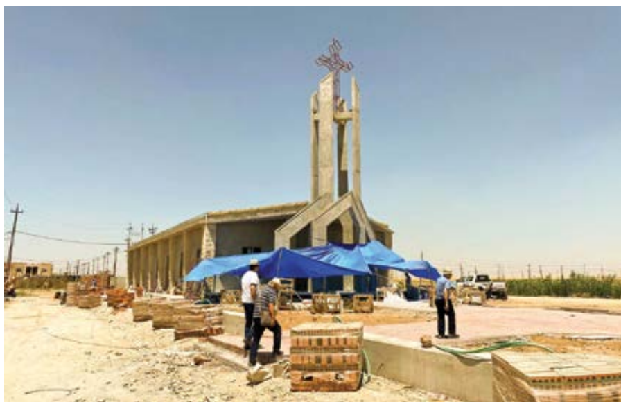
Nový kostel v iráckém Karakoši bude zasvěcený Panně Marii, Matce naděje.