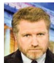
Edward Pentin National Catholic Register Přeložila Alena Švecová

Dále uvedl: „Znám mnoho biskupů s těsnými vazbami na věřící, kteří slaví mši svatou podle usus antiquior [mimořádné formy], a na kněží, kteří jim slouží. Doufám, že se v průzkumu dostalo sluchu i jim.“