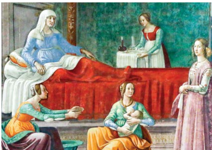
Narození sv. Jana Křtitele. Detail z fresky od Ghirlandaia v dominikánském kostele Santa Maria Novella ve Florencii.

Za třetí, Jan byl pokorný ukazatel, s důrazem na slovo „pokorný“. Znakem skutečně velkého člověka je, že dokáže rozpoznat toho, kdo je ještě větší – a Jan to jistě dokázal. Nenechal se pohlit veškerou tou pozorností, která na něho byla