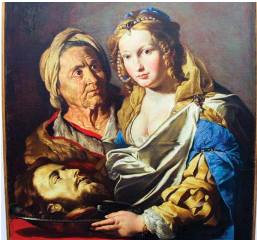
Matthias Stom: Salome s hlavou Jana Křtitele

někdy? Pokud ne, dejte si záležet na tom, abyste navzájem seznámili Boha a ostatní lidi. Uvědomte si také, že člověk v práci nebo ve škole vedle vás možná Ježíše skutečně nikdy nepozná, pokud stejně jako Jan „nepůjdete před Pánem, abyste mu připravili cesty“.