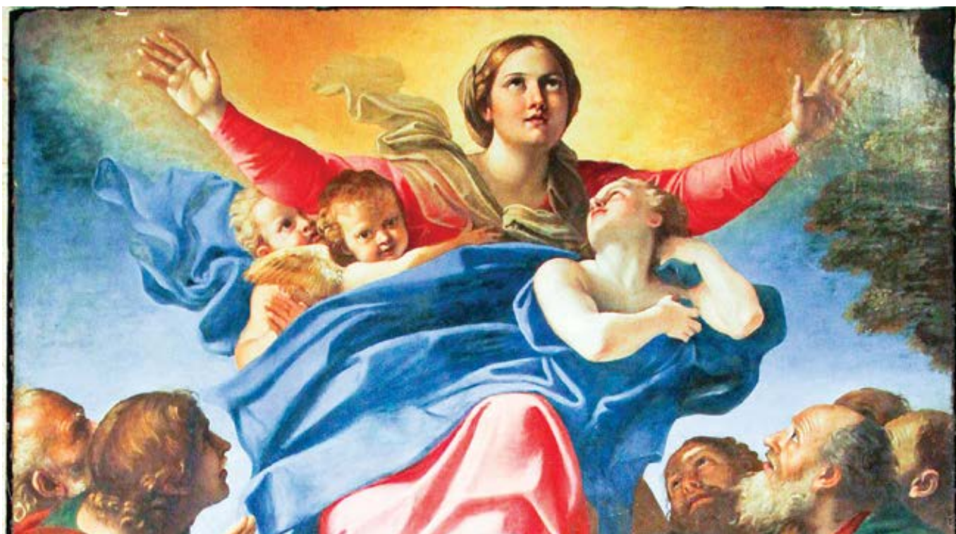
Annibale Carracci: Nanebevzetí Panny (1600–1602)