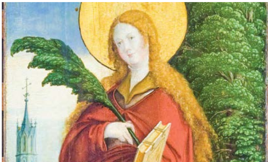
Meister von Meßkirch: Svatá Eulálie (1535–1540)

Svatá Viborada (zemřela roku 926) byla první ženou, kterou v Římě kanonizovali k všeobecné úctě. Švýcarská poustevnice a prorokyně Viborada pracovala jako knihařka pro nedaleký klášter. Předpověděla blížící se vpád uherských vojsk a vyzvala mnichy, aby zachránili nejценnější rukopisy a uprchli s nimi. Viborada však odmítla opustit své místo (nebo své knihy) a byla umučena. Je patronkou knihovníků a bývá zobrazována s knihou