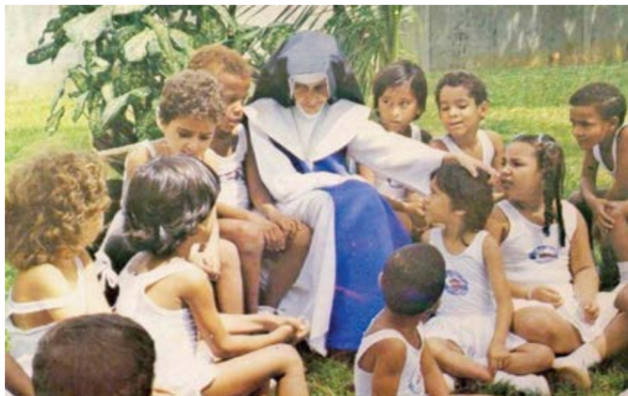
Svatá Dulce Pontesová.

Svatá Františka Římská (1384–1440) byla italská šlechtična a matka, která v mládí toužila po řeholním životě – už jen proto, aby se vyhnula neustálým společenským kontaktům, které se od šlechtičny očekávaly. Františka byla natolik introvertní, že se kvůli společenským povinnostem jednou nervově zhroutila. Teprve když přijala svůj životní úděl,