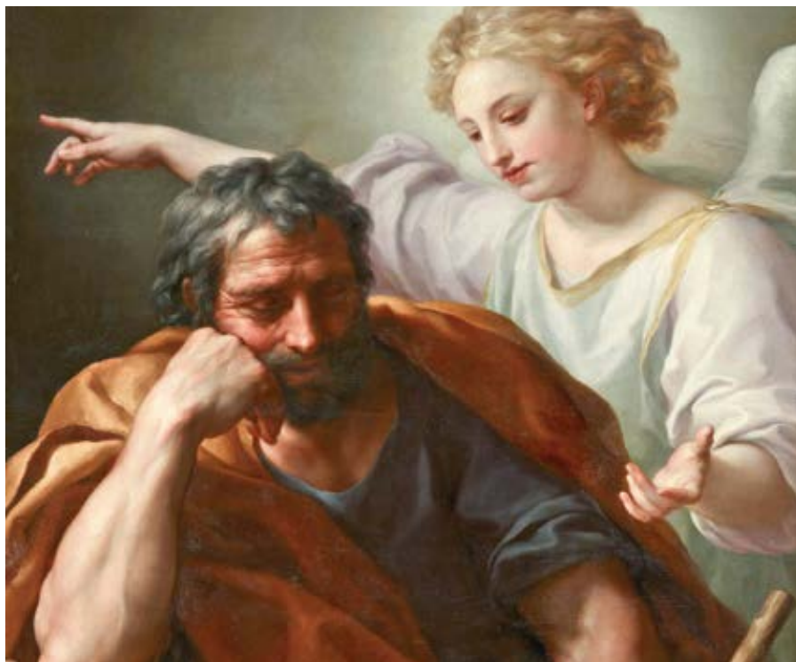
Anton Raphael Mengs: Sen sv. Josefa (1773–1774)

Jádrem této tradice je text ze 6. století