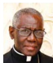
Mons. Robert Sarah emeritní prefekt Kongregace pro bohoslužbu a svátosti