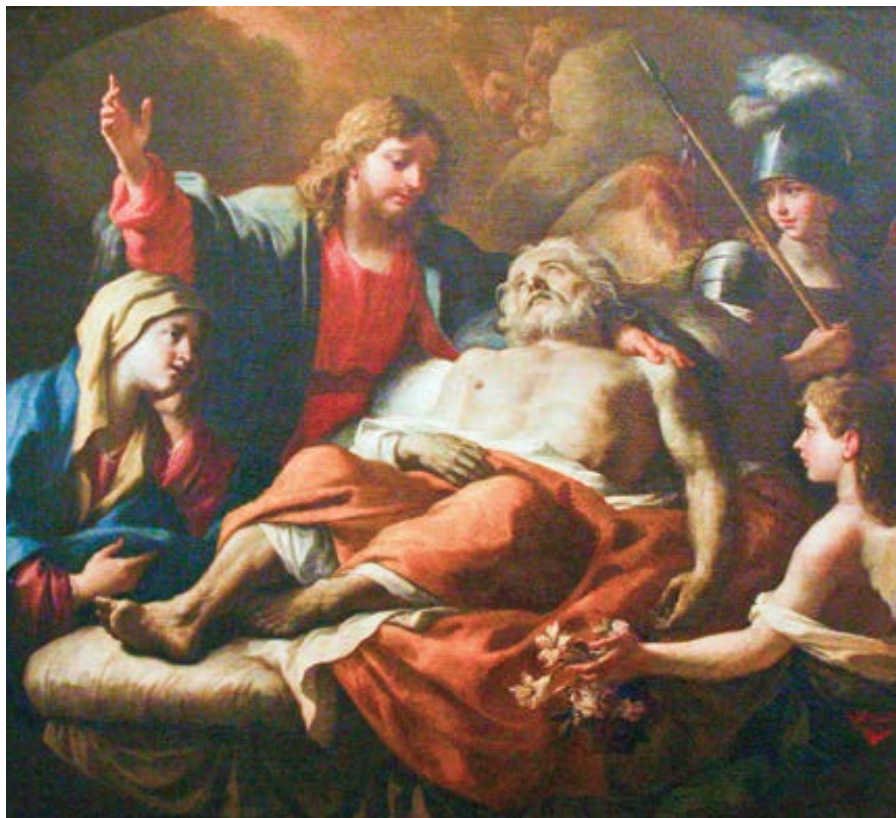
Paolo de Matteis: Smrt sv. Josefa

S ohledem na tento historický scénář mnohé tradice tvrdí, že Josef zemřel v náručí nebo v přítomnosti Ježíše a Marie. Je to nádherný obraz, který vedl církev k tomu, že Josefa prohlásila patronem „šťastné smrti“. Existuje mnoho popisů tohoto okamžiku, ale jeden obzvláště působivý pochází ze spisů ctihodné matky Marie od Ježíše, z Agredy (známa též jako bilokující řeholnice).