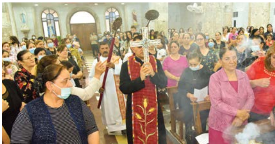
Relikvie Svatého Kříže v kostele sv. Jana Křtitele v iráckém Karakoši, srpen 2021.

Ačkoli křesťané v různých blízkovýchodních zemích mohou svobodně prožívat svou víru, mnozí z nich se nikdy nevzdají na pouť do Svaté země. Jeruzalémská františkánská kustodie jim v těchto letech měsících vyšla vstříc tím, že přinesla jednu významnou část Svaté země – relikvii svatého Kříže – do jejich farností. Během putování Blízkým východem nyní relikvii uctívají věřící v iráckém Karakoši, městě na Ninivské planině, které letos na jaře navštívil papež František.