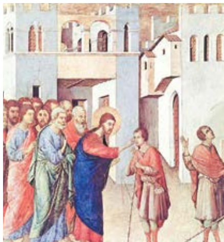
Duccio di Buoninsegna: Ježíš otvírá oči muži, který se narodil slepý (1308–1311)

5. září 2021 – 23. neděle v mezidobí – Mk 7,31–37