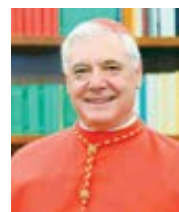
Mons. Gerhard Ludwig Müller byl papežem Benediktem XVI. jmenován prefektem Kongregace pro nauku víry (2012–2017), Papež František jej v červnu 2021 jmenoval členem Nejvyššího tribunálu Apoštolské signatury

kardinál Gerhard Müller The Catholic Thing