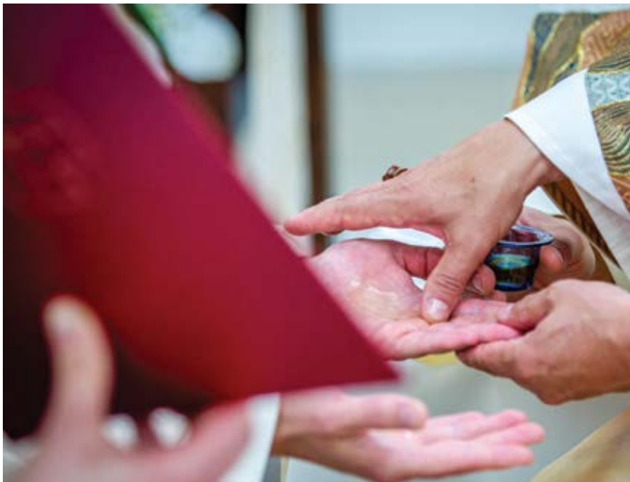
Kněžské svěcení v trapistickém klášteře Nový dvůr, 20. 8. 2021.