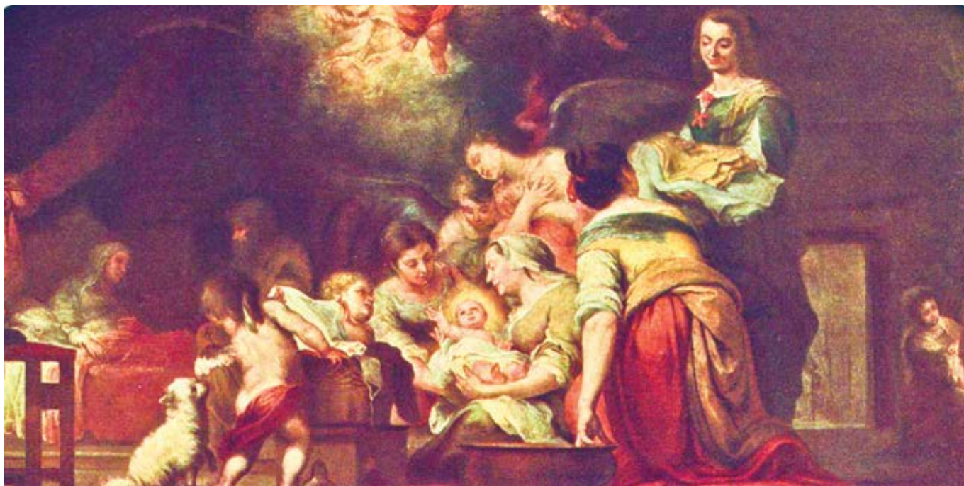
Bartolomé Esteban Murillo: Narození Nejsvětější Marie Panny (cca 1660)