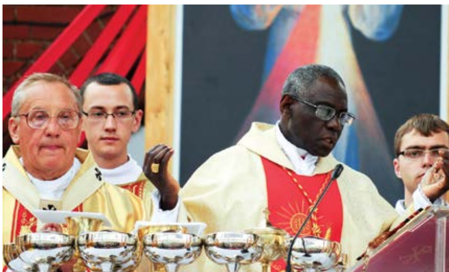
Kardinál Robert Sarah.

Rozhovor s kardinálem Robertem Sarahem, bývalým prefektem kongregace pro bohoslužbu a svátosti: „Dnešní pastorační se zabývá především tělem, tělesným životem, hmotnými záležitostmi“. Krize povolání a liturgická otázka.