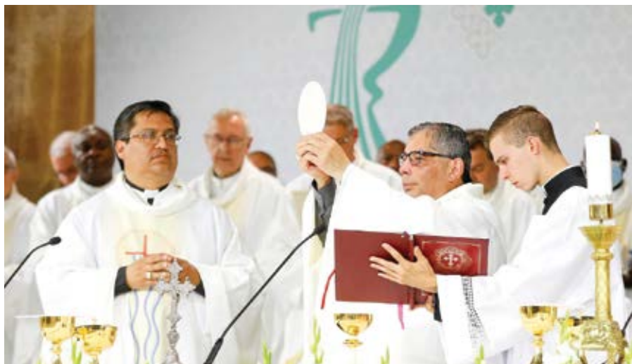
Mezinárodní eucharistický kongres v Budapešti, září 2021.

Tak nám začal nový školní rok (nebo měsíc, jak vtipně podotkl ve svém blogu jeden z mých přátel) a mnoho lidí s napětím očekává, zda neskončí dříve a děti nebudou opět přikovány k monitorům ve svých domovech. A tak je pochopitelné, že se vyrojily články o testování, očkování atd. Ale jsou i důležitější věci v životě lidském než zdraví a očkováním zaručená poklidná plavba životem.