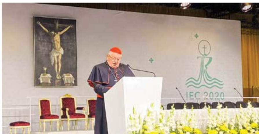
Kardinál Dominik Duka na Mezinárodním eucharistickém kongresu v Budapešti, 10. září 2021.

Františkem, neboť je to 150 let od jejich zavraždění. Nástupce zastřeleného arcibiskupa pokládá základní kámen ke stavbě chrámu Sacré-Cœur na Montmartre v Paříži. Tento karmelitán a pařížský arcibiskup nám svým statečným postojem připomíná nezapomenutelného a statečného primase Maďarska, ostříhomského arcibiskupa, kardinála Józsefa Mindszentyho, kterého beatifikační proces se chýlí ke konci. Ve chvílích, kdy nástupce Petřův bude slavit Eucharistii zde na Náměstí hrdinů. Ve Varšavě bude blahořečen primas tisíciletí, primas Polsko, kardinál Stefan Wyszyński. Omlouvám se za svoji nepřítomnost zde v Budapešti ale z povinnosti a vděčnosti za velkou pomoc, kterou kardinál Wyszyński poskytl v čase komunistické diktatury mé zemi a naší církvi musím být ve Varšavě! Žijeme v roce olympiády. Po oné kruté vraždě před sto padesáti lety pronesl slavnou chvalořeč na mučedníka, arcibiskupa Paříže Georgese Darboye, spoluzakladatel olympijských her vedle barona Coubertina, můj řádový spolubratr Henri Didon OP, autor olympijského hesla „Citius, Altius, Fortius“, který se též účastnil obrany u Verdunu. Deset let poté roku 1881 se ve francouzském městě Lille koná První světový eucharistický kongres. Kongres