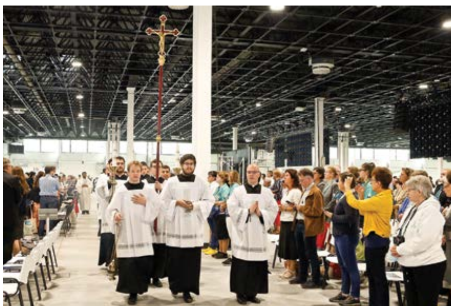
Mezinárodní eucharistický kongres v Budapešti, září 2021.

Eucharistie není myslitelná bez společnosti církve, svědků Ježíšových. Eucharistie má univerzální rozměr, její působení přesahuje církev, lidstvo, všechny živé i zemřelé, objímá celé tvorstvo (Kol 1,15–17). Církev, která bude magnetem pro dnešního člověka je církví Eucharistie. Připomeňme si slova francouzského jezuita Henriho de Lubaca, slova, která zazněla na Druhém vatikánském koncilu: „Eucharistie buduje církev.“ Tak popsali církev první církevní otcové. Eucharistie činí církev dynamickou událostí. Instituce, struktura, vytváří církev zkamenělin. Církev bez Eucharistie v době covidu ztuhla, a proto potřebuje rozhýbat. Tak Eucharistický kongres zde v Budapešti může svědčit a musí být výzvou k pravé dynamice života ve svobodě, pravdě a lásce. Budapešť dokázala mnohé ve své historii. V zápase, kdy hájila celou křes-