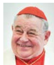
Dominik kardinál Duka OP, arcibiskup pražský a primas český

Dominik kardinál Duka OP Mezinárodní eucharistický kongres, Budapešť 10. 9. 2021 redakčně kráceno apha.cz