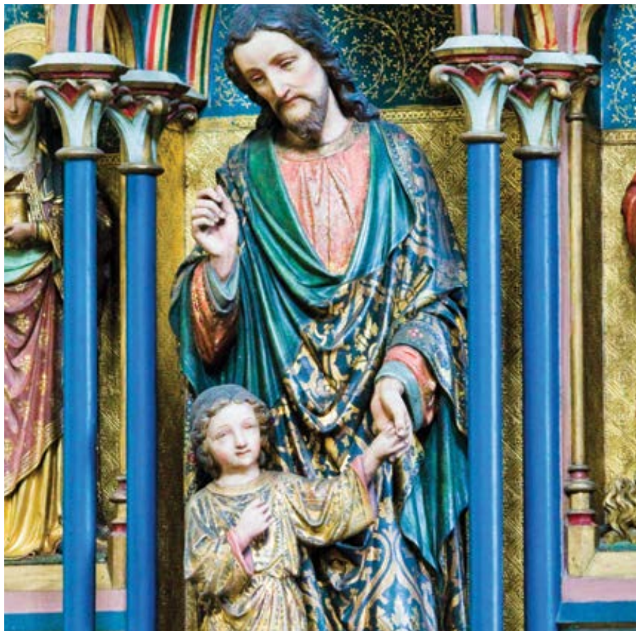
Sv. Josef pěstoun.

Jedna z nejoblíbenějších pobožností k sv. Josefu se nazývá novéna „Plášť sv. Josefa“. Skládá se ze série modliteb, které se modlí 30 dní po sobě na památku 30 let, které – jak někteří věří – sv. Josef prožil jako Ježíšův pěstoun. Novéna je zároveň částečně založena na víře, že existuje skutečný plášť svatého Josefa, který je uložen v římském kostele. Kniha z 19. století nazvaná Život a sláva svatého Josefa podává krátkou historii tohoto pláště. Nuže, neexistovala žádná skutečná relikvie sv. Josefa, jenom některé části jeho oděvů byly posvěceny kontaktem s jeho svatým – a jak věříme – oslaveným tělem. V Římě je uchovávaná nádherná relikvie v podobě pallia neboli pláště tohoto světce, která by měla být uctívána tím spíše, že musela často chránit Božské dítě, když spočívalo v Josefově