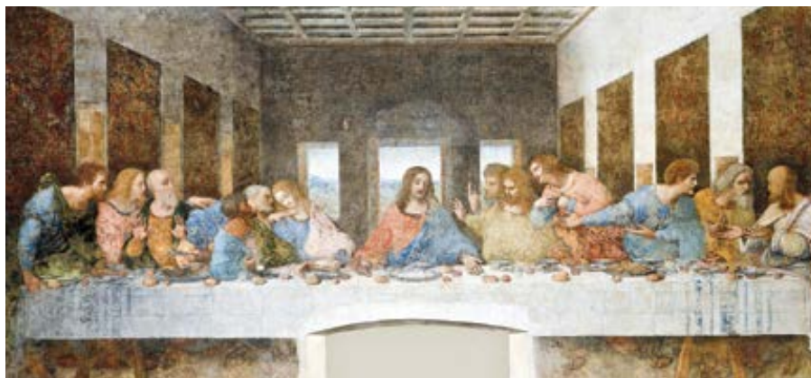
Leonardo da Vinci: Poslední večeře (1495–1498)

Tradice to, že je živou skutečností. Krásnými slovy to vystihuje II. vatikánský koncil: „Tato apoštolská Tradice prospívá v Církvi s pomocí Ducha svatého. Vzrůstá totiž chápání předaných věcí a slov, a to jak přemýšlením a studiem věřících, kteří je uchovávají ve svém srdci, tak hlubším pochopením duchovních skutečností z vlastní zkušenosti, tak také hlásáním těch, kteří s poslušností v biskupském úřadě přijali bezpečné charisma pravdy. Církev totiž během staletí stále směřuje k plnosti Boží pravdy, dokud se na ní nenaplní Boží slova“ ( Dei verbum , 8). A o něco dále tentýž koncil učí: „Bůh, který kdysi promluvil, nepřestává mluvit se Snoubenkou svého milovaného Syna a Duch svatý, skrze kterého zaznívá živý hlas evangelia v Církvi a skrze ni ve světě, uvádí věřící do veškeré pravdy a působí, aby v nich Kristovo slovo přebývalo v celém svém bohatství.“