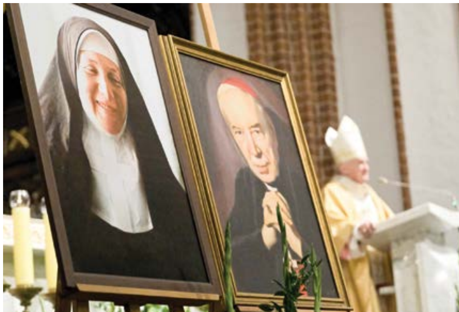
Blahořečení kardinála Stefana Wyszyńskiego (1901–1981) a sestry Elzbiety Róza Czacka (1876–1961), zakladatelky Kongregace sester františkánek služebnic Kříže. V mládí přišla o zrak a celý život věnovala službě nevidomým.

1. Měj v úctě každého člověka, neboť v něm žije Kristus. 2. Smýšlej dobře o všech. O nikom nesmyšlej špatně. 3. Mluv vždy příznivě o druhých. Nemluv špatně o bližních. Naprav křivdu způsobenou slovem. Nevyvolávej mezi lidmi neshody. Sjednocuj srdcem i slovem. 4. Mluv s každým jazykem lásky. Nezvyšuj hlas. Neproklínej. Nedělej nepříjemnosti. Nevháněj do očí slzy. Uklidňuj a prokazuj dobrotu. 5. Všem všechno odpouštěj. Nechovej v srdci nevraživost. Vždy jako první natáhni ruku k smíru. 6. Konej vždy v prospěch bližního. Čiň dobře každému, jako by sis přál, aby se dělalo tobě. Nemysli, nač máš právo, kdo je vinen, ale co ty dlužíš druhým. 7. Aktivně spolupracuj v utrpení. Rád pospěš s pomocí, radou, útěchou, srdcem. 8. Pracuj svědomitě, neboť z plodů této práce mají užitek jiní, tak jako ty užíváš práce druhých. 9. Zapoj se do společné pomoci bližnímu. Otevři ruku chudým a nemocným. Udě-