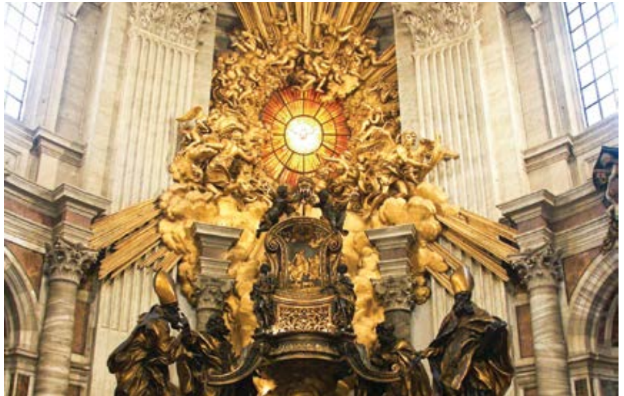
Katedra svatého Petra.

Působení Ducha svatého se tomuto světlu podobá. Rozhodně není magické, ale spíš zcela reálné, transcendentní a nadpřirozené. Je pro duši Božským hostem (srov. Summa Theologiae I, 38, a. 1), a tak je skrze posvěcující milost zaplavena jeho světlem, jež odhaluje krásu, která bez jeho světla zůstává skryta. Plnost jeho přítomnosti se však neomezuje na pouhé světlo. Kniha Skutky svatých apoštolů popisuje, jak v místnosti, kde byli apoštolové shromážděni, zavládlo téměř zděšení, když se prudce otrásla jako při zemetřesení. Potom z nebe sestoupil veliký oheň a na každém z nich spočinula koruna z plamenů.