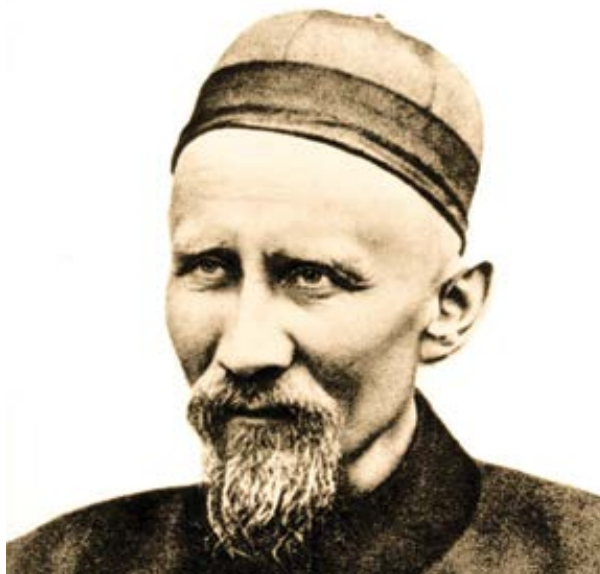
Sv. Josef Freinademetz.

V roce 1899 vypuklo povstání boxerů, tajné protikřesťanské společnosti podporované pekingským dvorem vedeným vládkyní Cixi (1835–1908). Válka rozpoutaná proti západní přítomnosti v Číně, začala právě v Shandongu v červnu 1900 a trvala do září 1901. Tisíce katolíků podstoupilo mučednickou smrt. Mezi nimi i františkánští biskupové svatý Antonino Fantosati, apoštolský vikář jižního Hunanu a svatý Gregorio Maria Grassi, apoštolský vikář severního Shansi, který byl zabit společně se svým pomocným vikářem svatým Francescem Fagollou. Otec Freinademetz neopustil své poslání a postavil se odvážně ke své smrti. 6. července 1901 napsal bratřím