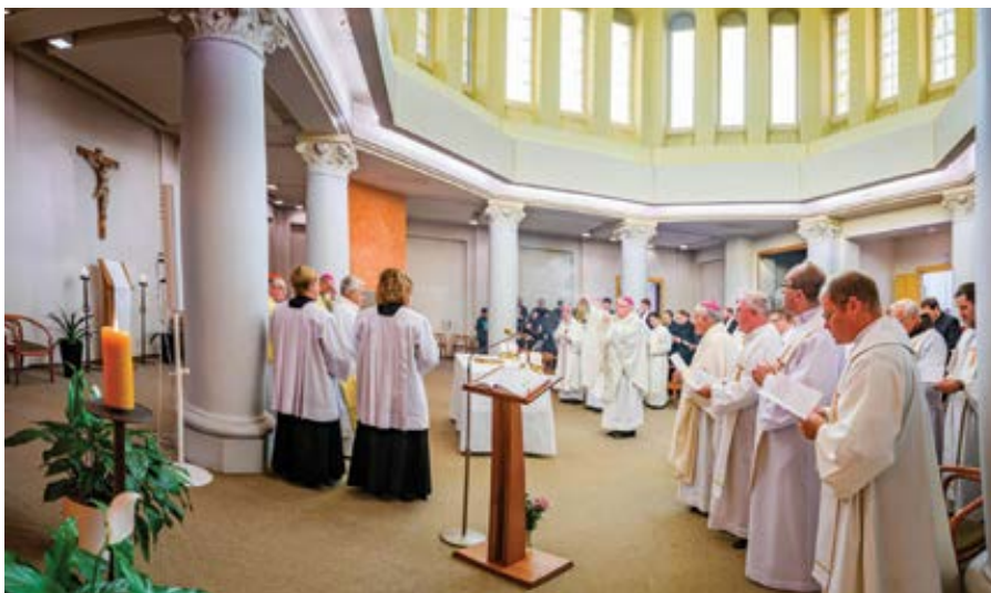
Mše sv. ke 30./31. výročí obnoveného provozu pražského kněžského semináře.

Hned se to však malinko zmrazí: „Modelový projekt. V ulicích jednoho z největších německých měst, v Kolíně nad Rýnem, se jednou týdně rozezní svolávání k modlitbě muslimů. Věřící budou svolávání muezziny reproduktory v metropoli každý pátek po dobu dvou let. Starostka Kolína nad Rýnem Rekerová uvedla, že projekt, který má trvat pouze dva roky, má být znamením vzájemného přijetí náboženství. Muslimští spoluobčané by podle ní měli vědět, že jsou nedílnou součástí kolínského společenství.“ Tolik z týdeníku Echo24 . Dovolují si položit otázku: až se to vyhodnotí a po dvou letech se zjistí, že by to tak být třeba nemělo, kdo bude korigovat ty násilné nepokoje v ulicích, kde jsou dnes ony reproduktory? Kardinál Jean-Pierre Ricard v roce 1944 upozornil: „Od islámu se požaduje rozlišení občanské a náboženské sféry. Muslimové musí pochopit, že nemohou celé společnosti vnucovat určité požadavky a nároky, které jsou závazné v jejich náboženské komunitě. Myslím, že to může být šance pro islám a pro muslimy, kteří opustili země, kde islám byl dominantním náboženstvím, kde stát a náboženství byly spojeny bez jakéhokoli rozlišení. Ve Francii mohou vyjádřit vlastní náboženství novým způsobem, přistoupit k nezbytnému rozdělení náboženství od politiky. Katolická církev se to také musela naučit a ukázalo se to pro nás velmi osvobozující. Jsem