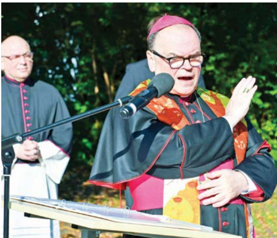
Biskup Bertram Meier.

los do pohybu, nic jej nemůže jen tak snadno zastavit. Uvědomme si, že toto všechno se děje za našimi hranicemi. Je to našťástí především jazyková bariéra, která znemožňuje, aby se také u nás nestaly tyto otázky do úmuru diskutované v celém Božím lidu. Problém však již i u nás spočívá v tom, že elita v církvi, která jazykovou bariéru nemá (například vyučující na teologických fakultách nebo katoličtí žurnalisté), tyto myšlenky nejen znají, ale mnohdy i přejímají, a pokud se cítí v nedotknutelném bezpečí, také je rádi šíří. Takže se mimo jiné i naši kandidáti kněžství dozvídají, že „zrušení celibátu je jen otázkou času“ (jaká motivace pro seminaristy!), kněžství žen „si lze představit“ nebo stejnopohlavní páry „lze žehnat“. Zkrátka se i jim dostává z této Panodřiny skříňky od sousedů bohaté krmě, i když naši její rozdatelé by na přímý dotaz určitě prohlásili, že „to tak nemysleli“, případně ani „neřekli“. A ještě by se cítili uraženi a pomlouváni. To