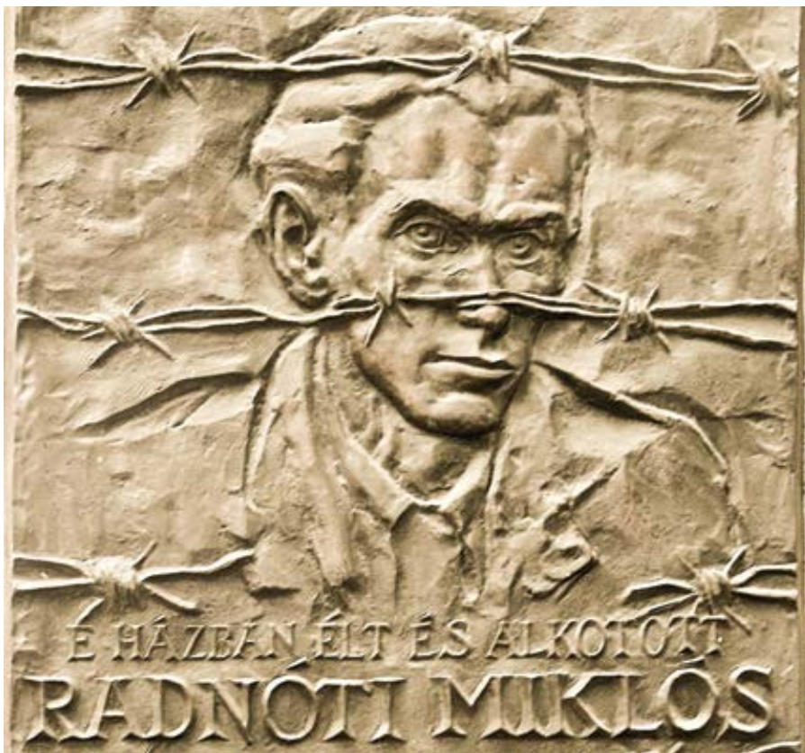
Pamětní deska Miklóse Radnótiho.

„Naše hlasy, drazí bratři a sestry, nesmí přestat být ozvěnou onoho Slova, které nám bylo dáno z nebe, ozvěnou naděje a pokoje,“ řekl papež. „I když nám nikdo nenaslouchá nebo zůstáváme nepochopeni, kéž naše činy nikdy nepopřou Zjevení, jehož jsme svědky.“