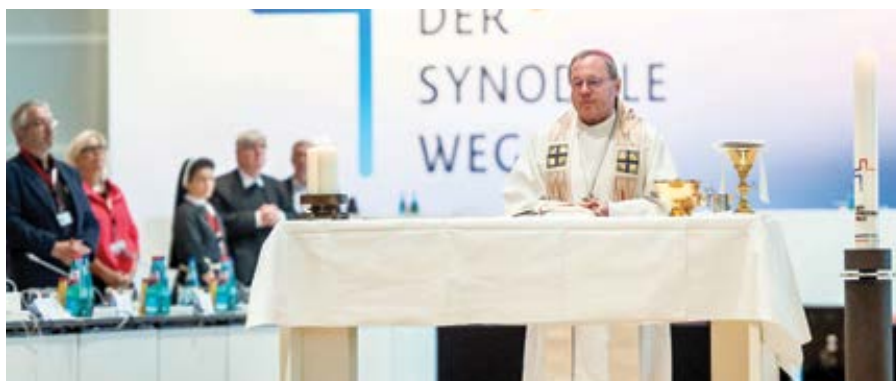
Biskup Georg Bätzing.

Bätzing, který promluvil na závěrečné tiskové konferenci, řekl, že náhlé ukončení pokládá za „okamžik vhodný k poučení“, který by, jak doufá, mohl zvýšit povědomí účastníků o tom, že synodální cesta vstupuje do „důležité fáze“.