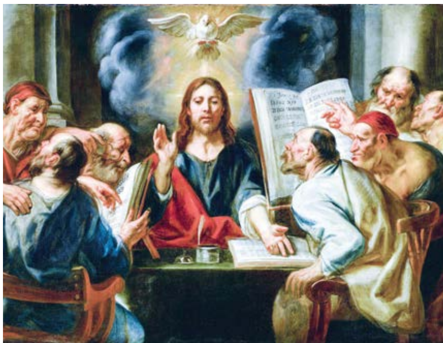
Jacob Jordaens: Kristus mezi farizeji (začátek 17. století)

Jeden z učitelů Zákona přistoupil k Ježíšovi a zeptal se ho: „Které přikázání je první ze všech? Ježíš odpověděl: „První je toto: ‚Slyš, Izraeli! Hospodin, náš Bůh, je jediný Pán. Proto miluj Pána, svého Boha, celým svým srdcem, celou svou duší, celou svou myslí a celou svou silou.‘ Druhé je toto: ‚Miluj svého bližního jako sám sebe.‘ Žádné jiné přikázání není větší než tato. Učitel Zákona mu na to řekl: „Správně, Místře, podle pravdy jsi řekl, že on je jediný a není jiného kromě něho a milovat ho celým srdcem, celým rozumem a celou silou a milovat bližního jako sám sebe je víc než všechny oběti a dary. Když Ježíš viděl, že učitel Zákona odpověděl rozumně, řekl mu: „Nejsi daleko od Božího království.“ A nikdo se už neodvážil dát mu nějakou otázku.