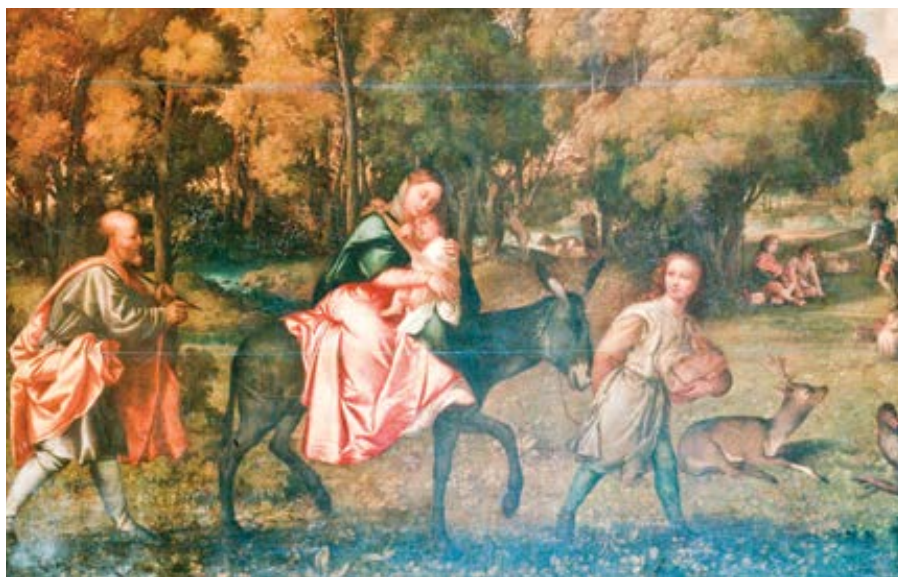
Tiziano Vecellio: Utěk do Egypta (1506–1507)

Když jsem vyrůstala, nikdy mi nepřišlo divné prosit o pomoc nějakého světce. Bylo to stejné, jako kdybych požádala přátele nebo rodinu, aby se za mě modlili.