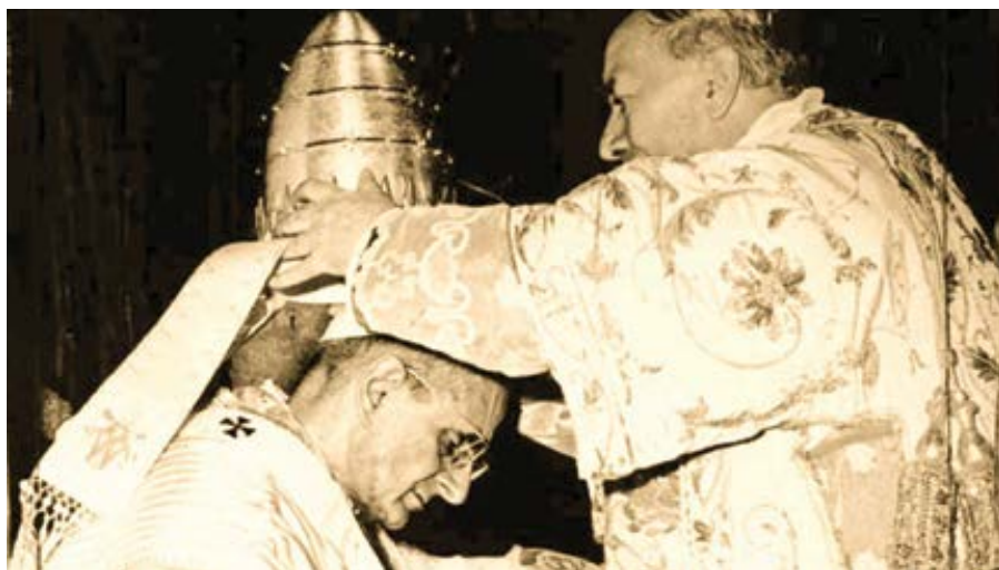
Koronovace papeže Pavla VI. 30. června 1963.

Před druhým vatikánským koncilem papežové zřídka kdy cestovali mimo Řím.