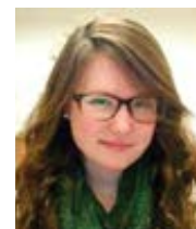
Theresa Civantos Barber Aleteia Přeložil Pavel Štíčka

1. Zde je několik nápadů, které vám pomohou začít změnu! 2. V době, kdy zrovna nejste spolu, napište a odešlete manželovi či manželce pozorný kompliment. 3. Dejte si polibek trvající šest sekund. 4. Naplánujte si večerní rande a запиšte si ho do kalendáře. 5. Zeptejte se na něco, co vašeho partnera zajímá a co vás příliš nezajímá (já se například manželka zeptám na cosi ohledně fotbalu!). 6. Napište mu milostný vzkaz a nechte mu ho pod polštářem. A ještě toho sami vymyslíte určitě mnoho!