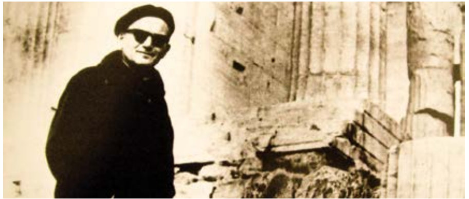
Karol Wojtyła.