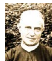
Josef Miklík Slovo Boží, nakl. Bohuslav Rupp, Praha 1946, převzato se souhlasem z librinostri.catholica.cz

kého badání. Jsem upřímný katolík, jako byla a jest většina nejvýtečnějších mužů naší doby. Z těchto důvodů jsem a zůstanu katolíkem. II. Ale nespokojím se jenom příslušností matrikovou; budu tím, čím mne chtěl míti Kristus a splním vznešený úkol, jaký mi vytkl. V jednom svém kázání mluvil Spasitel o poměru, jaký má býti mezi církví a světem. Mezi jiným pravil svým učedníkům: „Vy jste světlo světa“ (Mat. 5, 14.) Tedy ne tmou a zpátečníky, ne jedem z Judey, jak pravil o nás Machar, nýbrž světlem máme býti světu.“