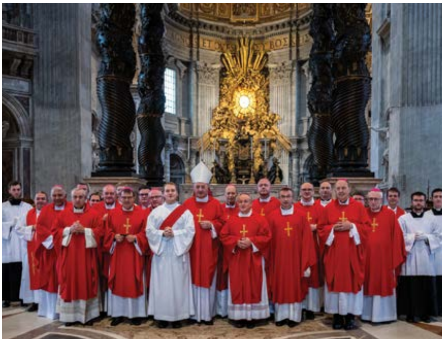
Ve dnech od 8.–14. listopadu absolvovali čeští a moravští biskupové návštěvu ad Limina apostolorum. V úterý 9. listopadu slavili mši svatou v bazilice sv. Petra a po ní se pomodlili u hrobu sv. Petra.

Bylo to před 191 lety, 27. listopadu 1830, byla sobota před 1. nedělí adventní. Na Rue de Bac v Paříži se zjevila Panna Maria Počatá bez poskvrny prvotního hříchu a dala světu zázračnou medailku. V sobotu 27. listopadu 2010, taktéž v předvečer první neděle adventní, se Svatý otec Benedikt XVI. v bazilice sv. Petra modlil při slavnostní „Vigilii za počatý lidský život“. Bylo jeho přáním, aby se podobné bohoslužby konaly ve všech diecézích a aby se vigilie před první adventní nedělí stala tradičně večerem modliteb za nenarozené děti. V řadě našich farností se tato slova vzala vážně, a tak v sobotu, která nyní přichází, se v kostelích budou konat adorace s prosbami o záchranu života bezbranných, tolik závislých na našem ANO, na našem přijetí a naší ochotě pomoci. Jan Pavel II. to vyjádřil pěkně, když napsal, že církev má mluvit ústy těch, kteří ještě sami mluvit nemohou. Pokud se ve vaší farnosti tento pěkný a zbožný zvyk ještě neusadil, zvažte to a domluvte se s vaším panem farářem hned na Advent 2022!