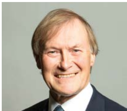
David Amess.

Konzervativní poslanec Sir David Amess zemřel po napadení nožem ve svém