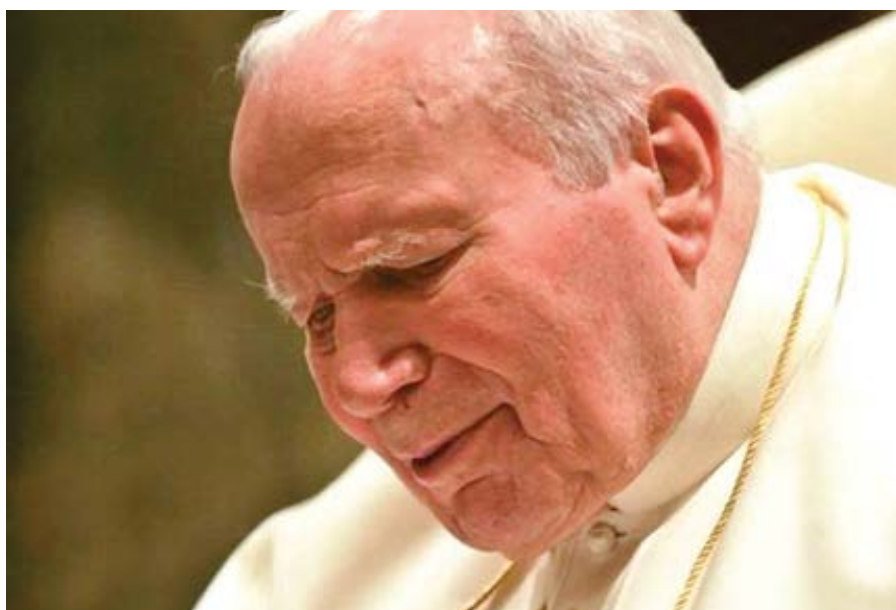
Jan Pavel II.

Tento první neitalský papež po 455 letech podnikl více zahraničních cest než všichni předchozí papežové do-