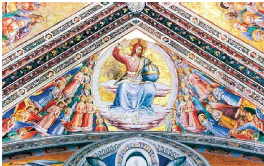
Fra Angelico: Kristus Soudce (1447)

Každý živočich má od Boha, Stvořitele všeho, v sobě jisté instinkty pro sebezáchovu. Proto nás i Kristus varoval, že co oni mají od přírody, to my máme mít s pomocí rozumu a bdělosti: vyhýbat se hříchu jako se nerozumový živočich vyhýbá stravě, která by jej mohla zahubit, a hledat spravedlnost, jako on si hledá výživné byliny. Proto říká: dávejte si pozor; abyste dokázali rozeznávat škodlivé od léčivého. Pozor je však možné dávat dvěma způsoby: tělesným očima a rozumovou schopností, přičemž tělesné oko nikdy nemůže vidět ctnost. Zůstává nám tedy, že „dávejte pozor“ mluví o činnosti rozumu. Neříkal, abychom dávali pozor na své věci či na věci okolo vás, ale na sebe, protože jste rozum a duše a vaše tělo je pouze smyslem. Okolo vás je bohatství, umění a jiné krásné doplňky ži-