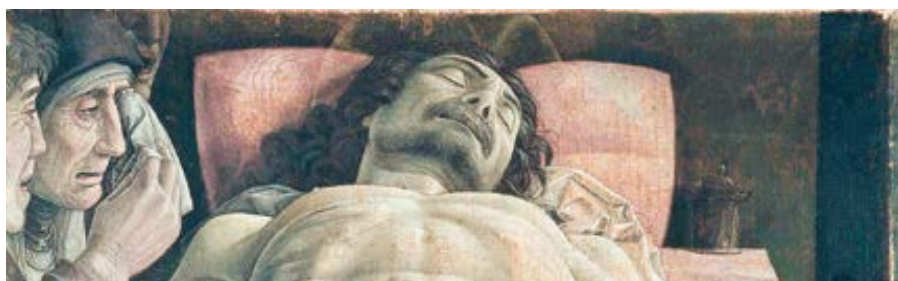
Andrea Mantegna: Nařikání nad Kristem (1470–1474)

Latinský patriarcha v Jeruzalémě, Pierbattista Pizzaballa, nedávno komentoval nové směrnice, určené pro ekumenické soužití ve Svaté zemi. Schválilo je 5. října tamní Shromáždění katolických ordinářů a dokument vstoupí v účinnost 28. listopadu. Bude se týkat nejen Latinského patriarchátu, nýbrž také všech východních katolických církví (řecko-melchitské, maronitské, syrskokatolické, arménské a chaldejské), jež působí v Izraeli, Palestině, Jordánsku a Kypru. Patriarcha označuje Svatou zemi za „laboratoř“ ekumenismu. Samozřejmě, že dokument nepřekročí rámec platné právní úpravy ohledně možného svátostného interkomunia mezi katolíky a členy nekatolických východních církví. Věřící jsou nadále vyzýváni, aby eucharistii, svátost smíření a pomazání nemocných přijímali ve svých domovských církvích, i když katolická strana otevírá možnost přijímat tyto svátosti i pravoslavným a dalším východním křesťanům, kteří nejsou sjednoceni s katolickou církví, a obdobně mohou katolíci přijímat tyto svátosti u nesjednocených církví, pokud ty to umožní.