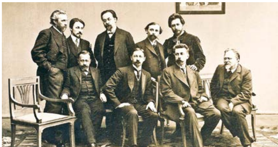
Typická inteligence ruské říše: „Sreda“ („Středa“), ruská literární skupina 90. let.

– toto slovo Solženicyn píše v kurzívě, aby naznačil, že v jiných dobách a kulturách bude hrát stejnou roli nějaký jiný potupný termín. Vojáci, kteří jsou stateční v boji, se krčí před pokrokovými názory. Vorotyncev se dlouho nemohl přimět k tomu, aby vyslovil protiargumenty, „a kvůli tomu sám sebou pohrdal... Byla to nakažlivá choroba – nebylo možno se jí ubránit, pokud jste se dostali příliš blízko.“