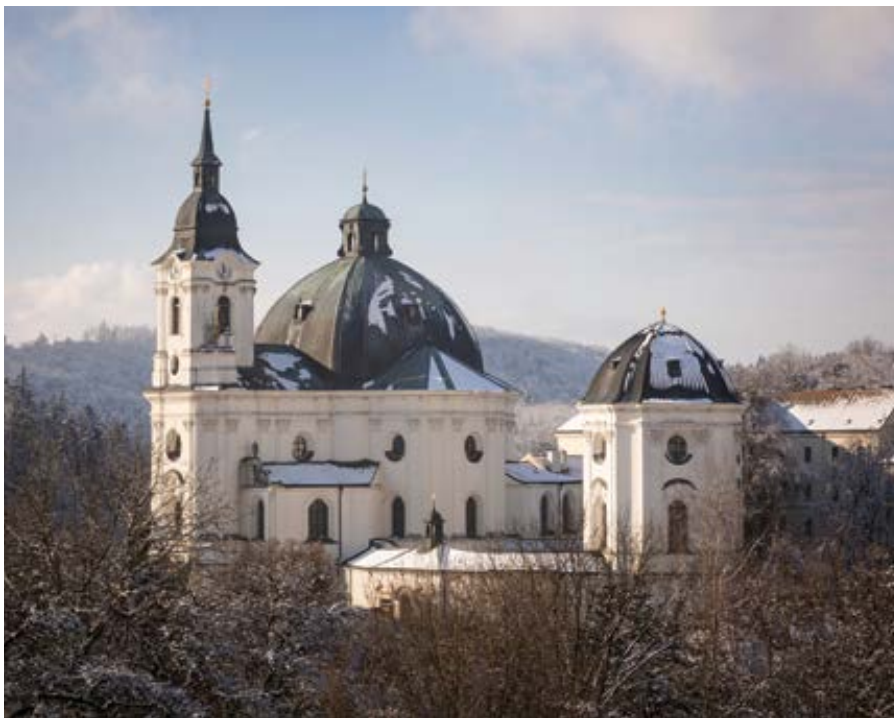
Poutní místo Křtiny.

Začali jsme tématem, které se dost přetřásá, katolík by měl zachovat chladnou hlavu a srdce plné vášně pro Boží věci a království zde na zemi a neměl by sám zapomínat na to, že naše existence zde na zemi má svůj vyměřený čas a statečně by to měl také ohlašovat těm, kteří v této nelehké době věří na nesmrtnost pozemskou. Z této perspektivy si pak odpovědět, zda vakcínu ano či ne. Mimochodem, jedna slavná česká herečka napsala: „Ještě štěstí, že pandemie nepřišla přes 15 lety, to bychom byli zavřeni doma s Nokia 3310, pokud bychom na ni tehdy tedy měli.“ A pokračuje: „Ráda cestuji. Právě jsem se vrátila z kuchyně – hlavního města bytu.“ Inu, doba je opravdu podivná. Ale fajn, má-li to svá opodstatnění, pojďme se zdržovat a respektujeme, co je třeba.