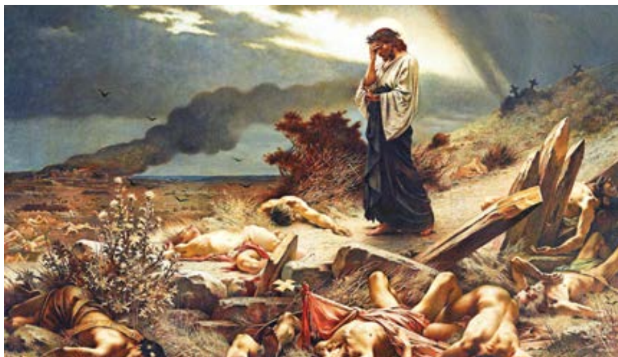
Henri-Camille Danger: Milujte se navzájem / Překročení příkázání (1892)

by člověk mohl udělat, mu nezjedná opět přístup do milostné Boží blízkosti. Ohnivý meč mu navždy brání přiblížit se.