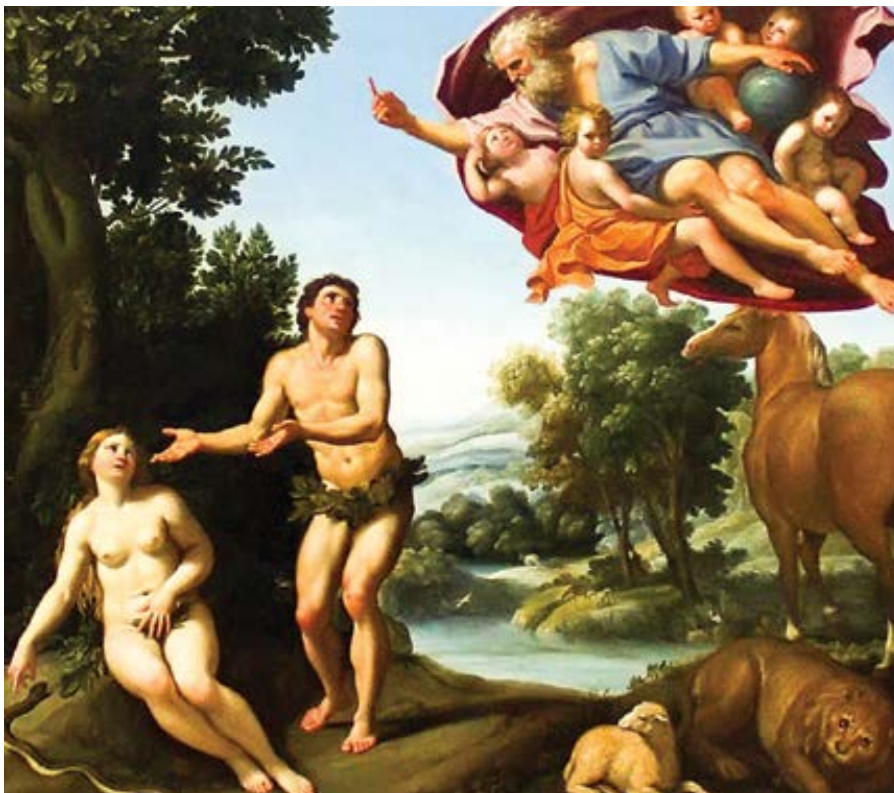
Domenico Zampieri: Potrestání Adama a Evy (mezi 1623–1626)

Bible nenechává platit tuto omluvu. Její Bůh ji od člověka nepřijímá. Nemá ukazovat na druhé, nýbrž sám na sebe. Zlo není něco mimo člověka, je to jeho čin. Člověk nemusí činit zlo, ale činí je. Je to „tvářnost jeho srdce“ (Gn 6, 5; 8, 21). Definice je pečlivě volena. Neznamená to, že srdce člověka je zlé od přirozenosti. Ne srdce je špatné, nýbrž „tvářnost srdce“. Být od někoho „utvářen“ znamená podléhat něčí moci. Tvářnost srdce podléhá moci člověka. Zlo není něco v člověku, co by se zlým činem jen ukázalo.