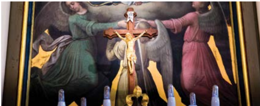
Číhošťský oltář.

Státní bezpečnost faráře donutila ke lži- věmu doznání, že z nařízení Vatikánu