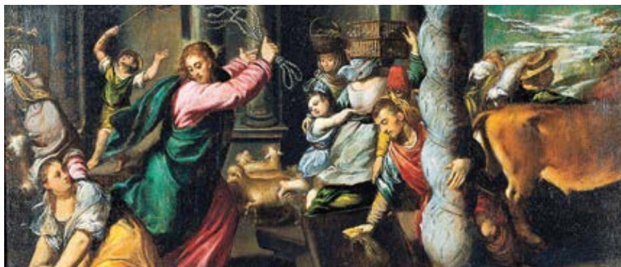
Ippolito Scarsella: Vyhánění obchodníků z chrámu (mezi 1580–1585)

Dostáváme tím napomenutí, abychom si nikdy nebyli jisti vlastním svědomím, ale vždy měli pozornost a bázeň. Protože to, co je skryto před námi, ne-