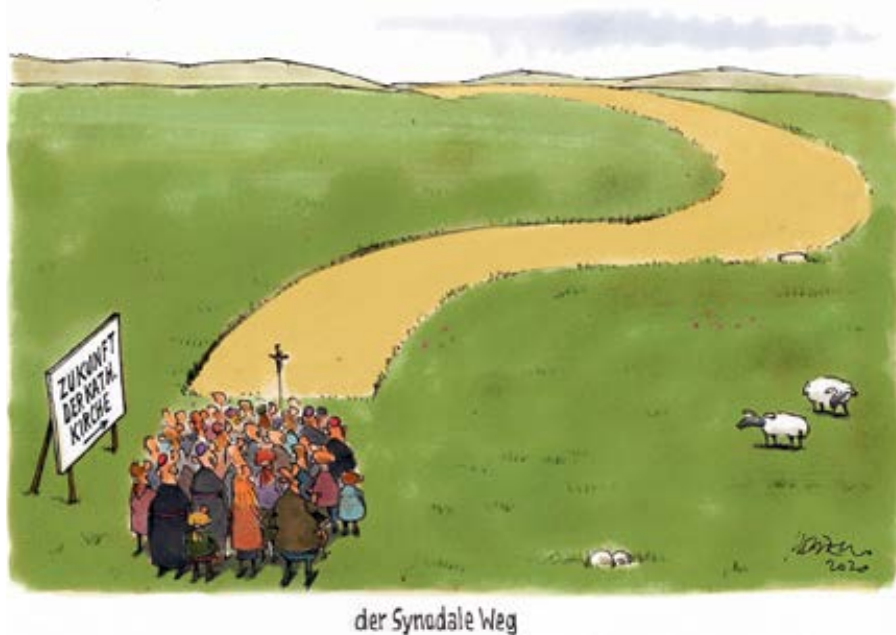
der Synodale Weg