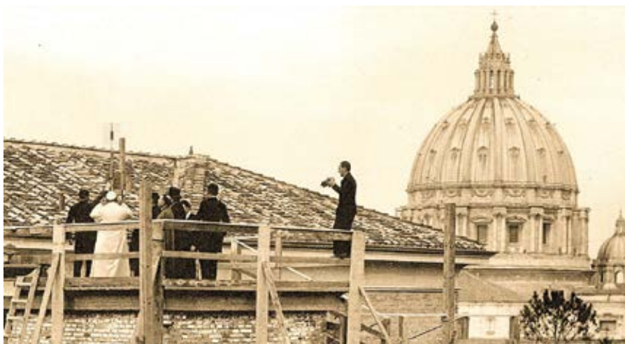
12. února 1931 zahájil papež Pius XI. vysílání Vatikánského rozhlasu.

Třicátá léta jsou obdobím vzestupu totalitních režimů. Postoje papeže Pia XI. jsou odvážné a lidé hledí k církvi s důvěrou. Rychle se množí požadavky o rozšíření vysílání na další evropské jazyky. V roce 1936 bylo vatikánské rádio přijato do Mezinárodní rozhlasové unie, která uznala jeho zvláštní povahu a oprávnila je k vysílání bez geografických omezení. Tehdejší ředitel rádia P. Filippo So-