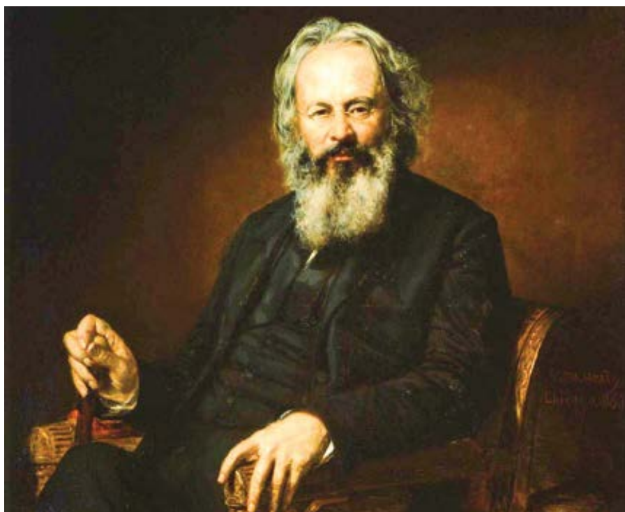
George Peter Alexander Healy: Orestes A. Brownson (1863)

Zde bude vhodné připomenout postoje a postupy prvních přistěhovalců směřující k vytvoření smluvního rámce