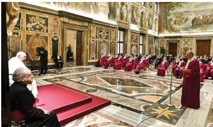
Setkání papeže Františka s členy Římské roty ve Vatikánu.

Soudci Římské roty přezkoumávají fakta, zda existuje důkaz o tom, že manželství nikdy nebylo platně uzavřeno. Zúčastněné strany vidí zřídka kdy. Místo toho podrobně studují přepis svědectví, znalecké posudky a sepsané argumenty od kanonických právníků. Pokud se neprokáže, že manželství je neplatné, je pokládáno za právoplatně existující a man-