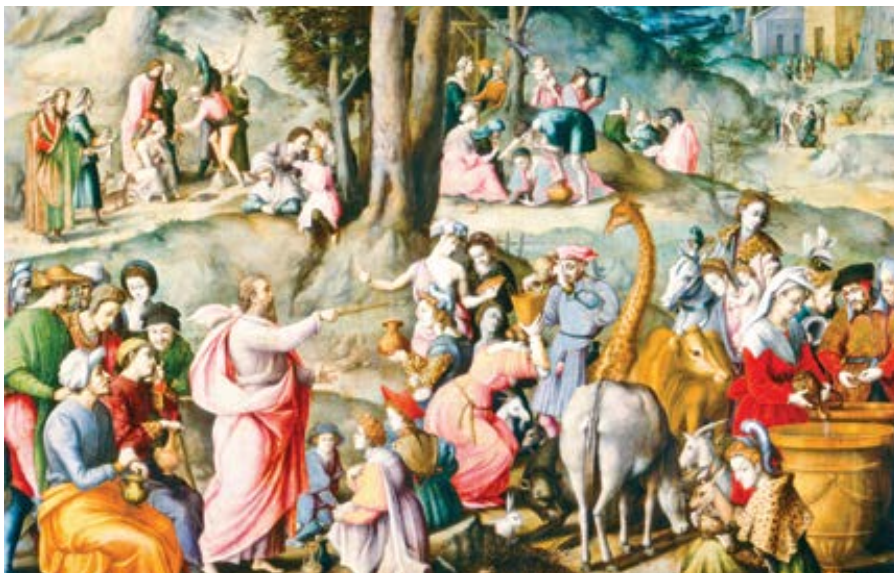
Francesco Bacchiacca: Sbirání many (cca 1540–1555)

Naše doba si navzdory mnoha zmatkům našla v Leonu Kassovi ideálního učitele: vzdělaný humanista, lékař, znamenitý bioetik, gentleman a moudrý rádce – židovský učenec, který kdysi pomáhal katolíkům na Papežské Gregoriánské univerzitě číst Písmo tak jako ještě nikdy předtím. Kassova nová kniha