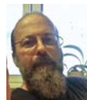
David Pancza ze slovenštiny přeložil Petr Beneš Amen 3/1998

Ale jaký to má význam? Pokud by to bylo jen samoučelné ponížování se proctnost samu, pro zálibu ve vlastní pokoře, byl by to nesmysl a pýcha. Význam pokory tkví v tom, že člověka obrací k druhým, činí ho schopným vidět, chápat a milovat druhé, činí ho schopným být jedné mysli s ostatními. Je to zřeknutí se nároků, postavení a slávy proto, aby se člověk mohl přiblížit k druhým, pomoci jim, sloužit jim. Potřeba pokory vychází z lásky. Jako když král, aby zachránil tonoucího, svleče svůj nádherný oděv, vystoupí z kočáru a skočí do špinavé vody. Ježíš říká: „Kdo chce být první, ať se stane služebníkem všech.“ Skutečné prvenství, které má v Božích očích cenu, je prvenství v darování se. Naše velikost spočívá ve schopnosti dělat druhé velkými.