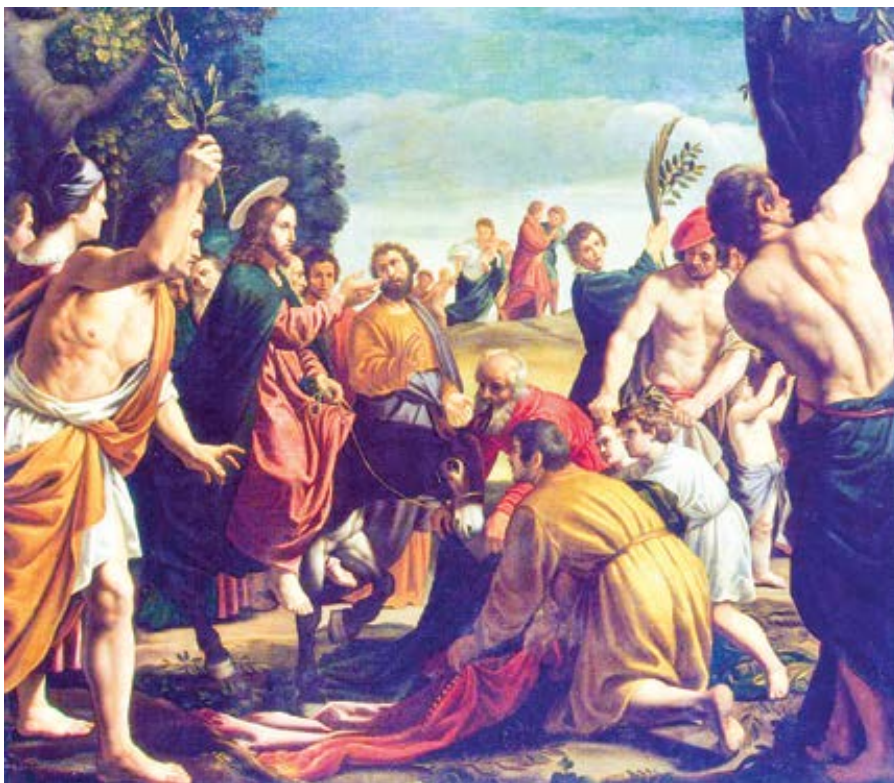
Pedro de Orrente: Vjezd do Jeruzaléma (cca 1620)

Totíž ze zrna patriarchů byl zaset, aby ze-