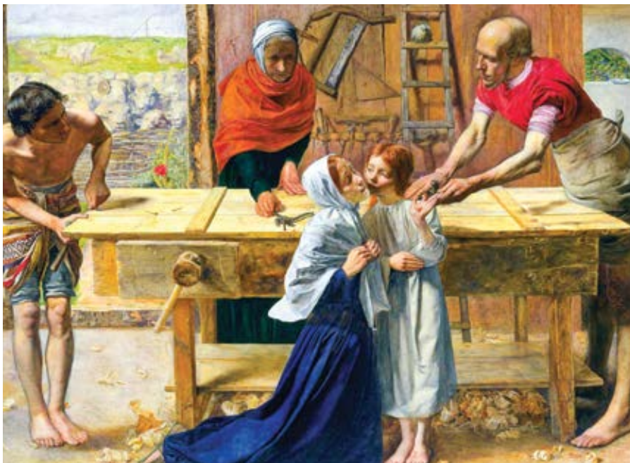
John Everett Millais: Kristus v domě svých rodičů (1849–1850)

Papež František ustanovil, že od 8. prosince 2021 se bude slavit zvláštní Rok svatého Josefa, aby v něm všichni věřící v Krista mohli každý den upevňovat jeho příkladem svůj život z víry a v úplnosti plnit Boží vůli. Dosažení tohoto velmi žádoucího cíle podpoří v první řadě dar posvátných odpustků, který Apoštolská penitenciárie tímto dekretem, vydaným podle úmyslu nejvyššího pontifika Františka, dobrotivě uděluje pro celý Rok svatého Josefa. Plnomocný odpustek se uděluje za obvyklých podmínek (svátostné vyznání, přijetí eucharistie a modlitba na úmysl nejvyššího pontifika) věřícím v Krista, kteří se v duchu odvrátí od jakéhokoliv hříchu a budou se účastnit Roku svatého Josefa za okolností a způsoby, jak to určuje tato Apoštolská penitenciárie.