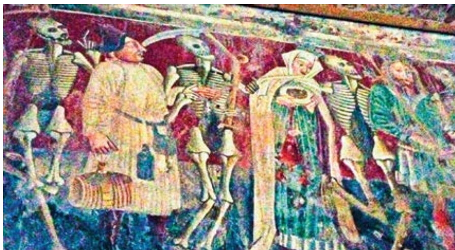
Vincent de Kastav: Tanec smrti (1474)

Prezident Joe Biden a mluvčí Nancy Pelosiová chtějí, aby lékaři a zdravotnická zařízení prováděli interrupce a chirurgické zákroky pro změnu pohlaví, poskytovali nezletilým blokátoři puberty a asistovali u sebevražd, i když to porušuje svobodu svědomí a náboženského vyznání. Federální a státní zákony o výhradě svědomí zatím lékaře, zdravotní sestry a zdravotnická zařízení chrání před tím, aby se na těchto nemorálních praktikách museli podílet. Zákon o rovnosti, navržený Sněmovnou reprezentantů a podporovaný Bidenem a Pelosiovou, zdravotnický personál a instituce této tradiční ochrany zbaví, což povede k žalobám a ztrátám koncese.