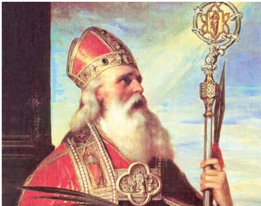
Mihály Kovács: Sv. Vojtěch (1855)

V listopadu 2020 jsem v rámci projektu zaměřeného na kulturní a církevní obnovu, prováděného na katedře ústavního práva University of Notre Dame, kontaktoval třiatřicet biskupů – jedna třicet ve Spojených státech a dva v ang-