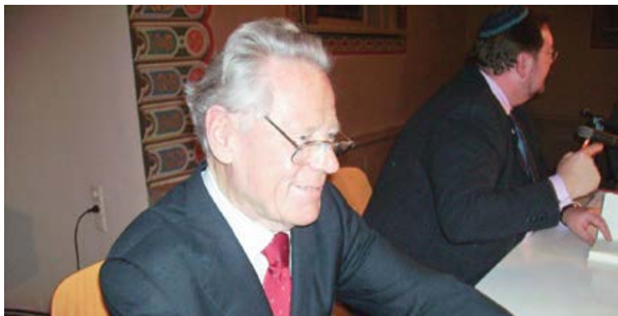
Hans Küng.

Ve světové církvi a zvláště v německojazyčné oblasti rezonovalo jméno švýcarského teologa Hanse Künga daleko více než mezi našimi katolíky. Zemřel letos 6. dubna a jeho úmrtí přece pohnulo některé autory a periodika i u nás k uveřejnění nekrologů. Je velmi příznačné, že se v nich nedozvíme nic o skutečných důvodech, proč bylo Küngovi odňato oprávnění vyučovat katolickou teologii.