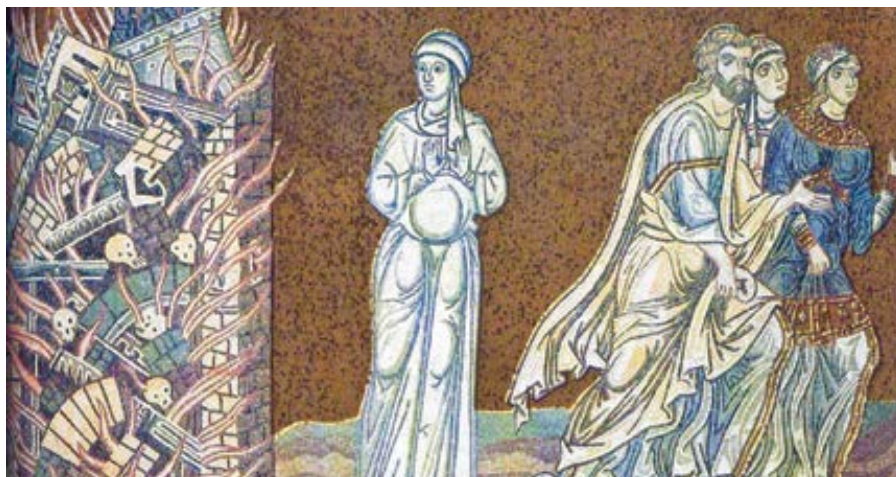
Mozaika v katedrále v Monreale, Sicílie: Lotova žena proměněná v solný sloup (12. st).

Sodomie je jedním ze čtyř hříchů, které podle Písma a církve „volají do nebe o trest“. Homosexuální skutky převrací, podvracejí a překrucují přirozený řád lidské sexuality, jak jej stvořil Bůh. Jsou to „úkony vnitřně nezřízené“ a odporují přirozenému zákonu. V žádném případě nemohou být schvalovány (KKC 2357).