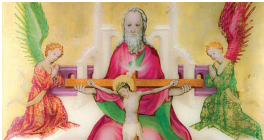
rakouský mistr: Nejsvětější Trojice s ukřižovaným Kristem (cca 1410)

na. V těchto Pánových slovech tedy nepřijímáme nějaká tajemství, která by sice učitel mohl vyprávět, ale vyučovaný by je nesnesl, nýbrž ta, která uvádíme jako náboženskou nauku známou každému člověku. Kdyby nám Kristus chtěl říci to, co říká svým andělům, kteří lidé by to snesli, i kdyby byli duchovní, což apoštolové ještě nebyli? Neboť vše, co lze o stvoření poznat, je jistě méně než sám Stvořitel. A kdo o něm mlčí? A kdo žijící v tomto těle může znát celou pravdu, když apoštol říká, že ji známe jen zčásti (1 Kor 13,9)? Díky Duchu svatému však také přicházíme k plnosti, o níž tentýž apoštol říká: ale pak tváří v tvář (1 Kor 13,12), a proto nám Pán slovy až přijde on, Duch pravdy, a naučí vás celé pravdě neboli uvede vás do plnosti pravdy, nejen slíbil to, co je v tomto životě, ale tímto slovem rozumíme, že nám vyhradil plnost v jiném životě. Tento Duch svatý i nyní učí věřící duchovním věcem tak, jak je kdo může chápat, a rozněcuje v jejich srdcích větší touhu.