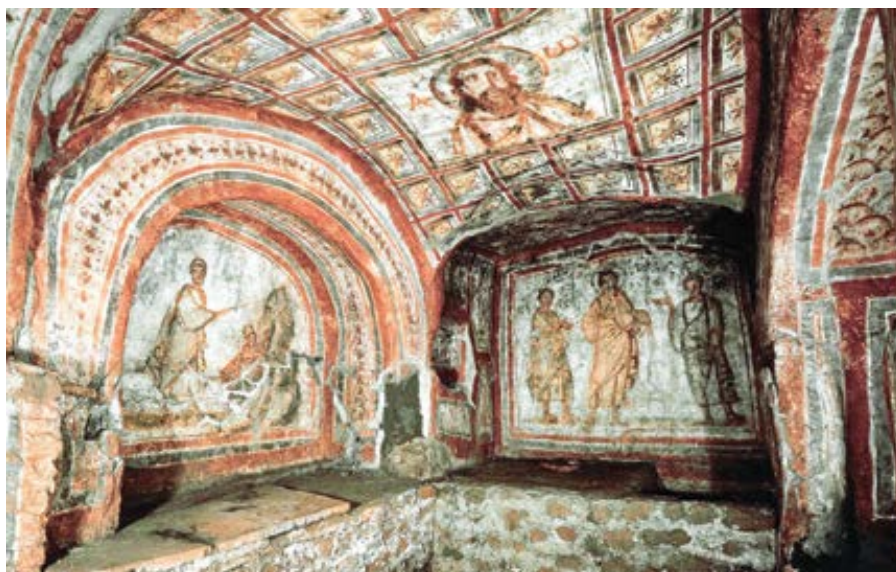
Kalixtovy katakomby v Římě

Všichni svobodní občané Římské říše, ať do tohoto stavu narození nebo zproštění otroctví, užívali jméno, které se skládalo ze tří částí: praenomen , nomen (gentile) a cognomen . Jako příklad si představíme Marca Tullia Cicera. Praenomen je křestní jméno, které dítěti dávali rodiče v den jeho narození. Takových jmen bylo velmi málo, a proto se často psala iniciálou (Marcus, M.). Prvorození synové jedné rodiny dostávali zpravidla stejné jméno. Nomen (gentile) je rodové jméno, které odpovídá našemu příjmení a dědilo se po otci. Jednalo se tedy o přídavné jméno, které napovídalo prastarý původ rodiny a pochopitelně napomáhalo lepšímu společenskému postavení jeho nositeli (Tullius, čili z Tullova rodu, Tullův).