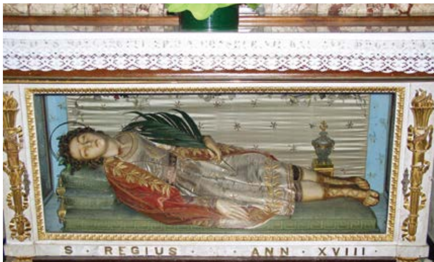
sv. Regius.

O svatém Regiovi se mi podařilo vyhledat jen velmi málo informací. V místní části lombardského města Trezzo sull'Adda, jež se jmenuje Concesa, se v poutním chrámě Božího Mateřství (Santuario della Divina Maternità) v pravém bočním oltáři uchovává větší část ostatků sv. Regia. Víme pouze, jak se tento mučedník z katakomb jmenoval, že věrně a odvážně přilnul ke křesťanské radostné zvěsti a že měl 18 let, když byl