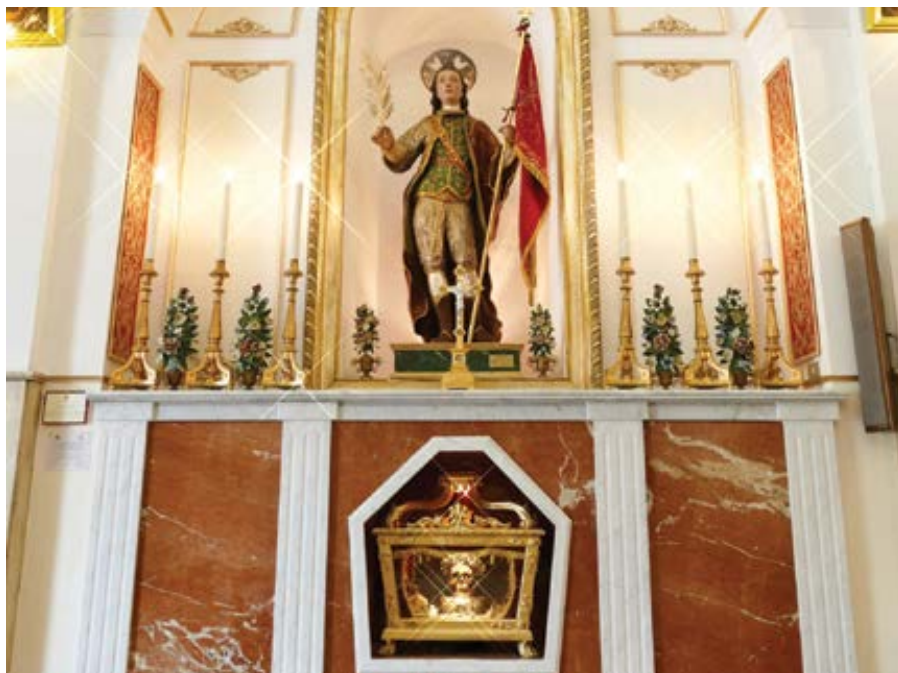
Oltář s ostatky sv. Prospera v Catenauova.