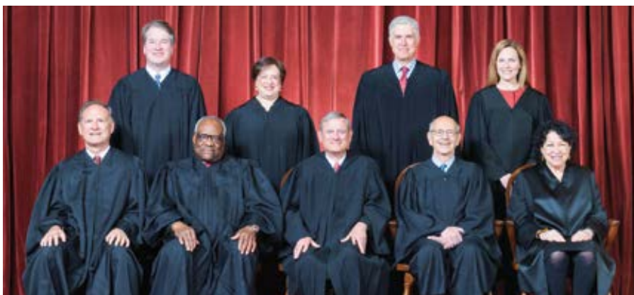
Soudci Nejvyššího soudu USA.

Rozhodnutí nezakazuje ani nekriminalizuje potraty, ani neuznává ústavní