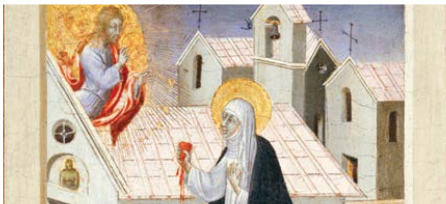
Giovanni di Paolo: Sv. Kateřina Sienská si vyměňuje své srdce s Kristem (1460)

Papež Benedikt vysvětluje: Když se rozšířila pověst o její svatosti, začala se věnovat intenzivnímu duchovnímu vedení lidí ze všech oblastí života: šlechticů a politiků, umělců i obyčejných lidí, zasvěcených mužů a žen i řeholníků, včetně papeže Řehoře XI., který v té době pobýval v Avignonu a jehož energicky a účinně nabádala k návratu do Říma. Hodně cestovala, aby se zasadila o vnitřní reformu církve a podpořila mír mezi státy.