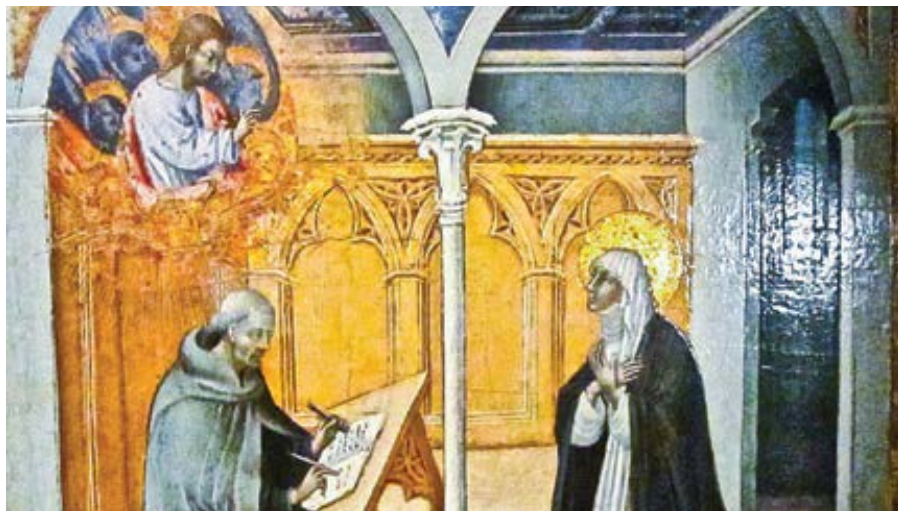
Giovanni di Paolo: Svatá Kateřina Sienská diktující své dialogy (1447–1449)

Kristus byl pro ni jako manžel, s nímž má vztah důvěrnosti, společenství a věrnosti; byl to její milovaný, kterého milovala nade všechna ostatní dobra.