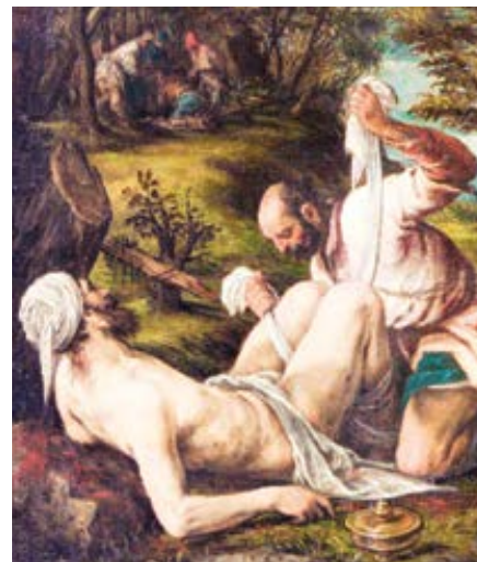
Francesco Bassano: Dobry Samaritan (1575)

má být prokázána služba milosrdenství, pokud ji potřebuje, nebo by měla být prokázána, pokud ji potřebuje. Z toho také vyplývá, že ten, kdo nám ji má ukázat, je také naším bližním: slovo bližní je totiž vztahové: bližním může být pouze bližní bližnímu. A kdo nevidí, že neexistuje výjimka, které by bylo možné službu milosrdenství odepřít? Jak říká Pán: „Čiňte dobře těm, kdo vás nenávidí“ (Lk 6,27). Je tedy zřejmé, že příkaz milovat bližního zahrnuje i svaté anděly, kteří nám prokazují tak velké služby lásky, a dokonce i sám Pán chce být nazýván naším bližním, když naznačil, že to byl on, kdo pomohl polomrtvému člověku ležícímu na cestě.