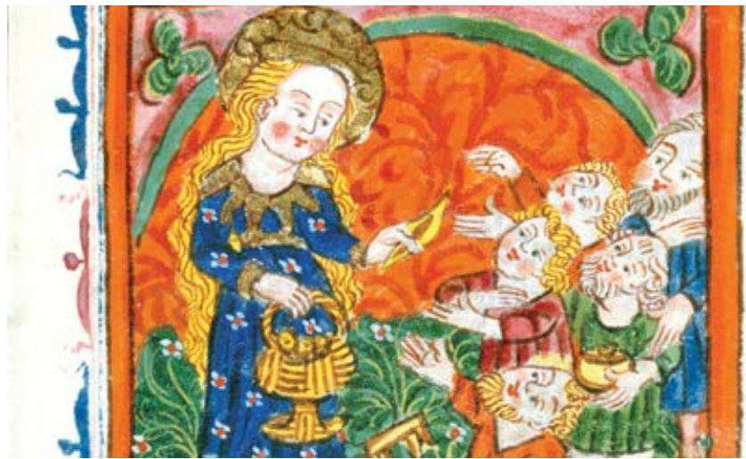
Codex Tennenbach: Sv. Klára rozdává almužnu (1492)

Obvykle tyto tři formy řadíme za sebou takto: modlitba, půst a almužna, ale pořadí, v němž se jim Ježíš věnuje ve svém kázání, je takovéto: almužna, modlitba a půst. Almužna je na prvním místě, nikoli na posledním (srov. Mt 6,1–18). O všech třech Ježíš mluví jako o „praktikování dikaionen “, česky spravedlnosti (Mt 6,1). Mohli bychom si myslet, že učí něco nového, ale není tomu tak. V knize Tobiáš anděl Rafael říká Tobiášovi a Tobitovi: „Dobrá je modlitba, když je doprovázena postem, almužnou a sprá-