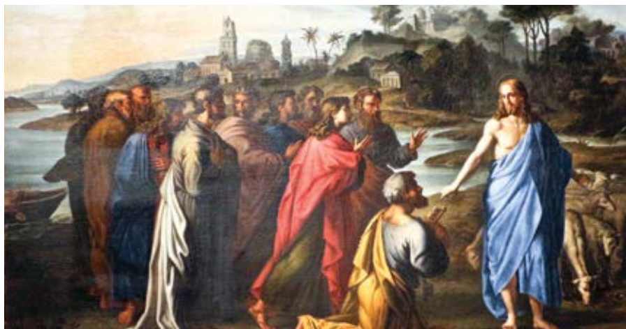
Nicolas Poussin: Pas mé ovce (17. století)

řit pokání za svůj hřích a lásku ke mně, bude pasení mých ovcí. Pamatuji, že to nejsou tvoje ovce, ale moje. Postarej se o ně kvůli mně. Udělej pro ně to, co jsem pro ně dělal já. Nechci, abys je jenom krmil. Chraň je. Polož za ně svůj život, bude-li to nutné.“