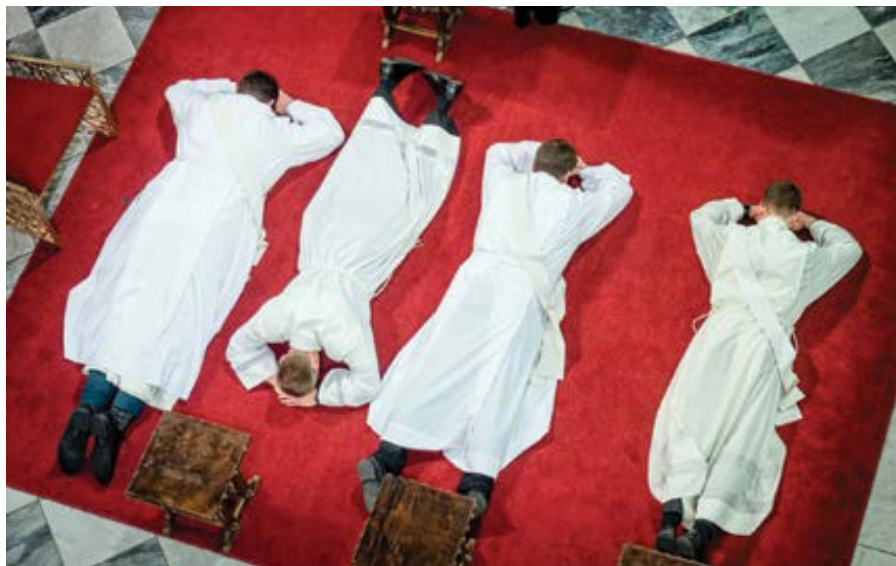
Kněžské a jáhenské svěcení 18. 6. 2022, katedrála sv. Petra a Pavla v Brně.

děti, že je to omezení reprodukčních práv a nepřijatelná cesta nazpátek. Nenechte se obalamutit. Toto rozhodnutí znamená jediné: otázka právní úpravy potratů se přesouvá do kompetence lidí a jimi zvolených zástupců jednotlivých států, nejde o žádný zákaz, pouze o spravedlivou decentralizaci moci.