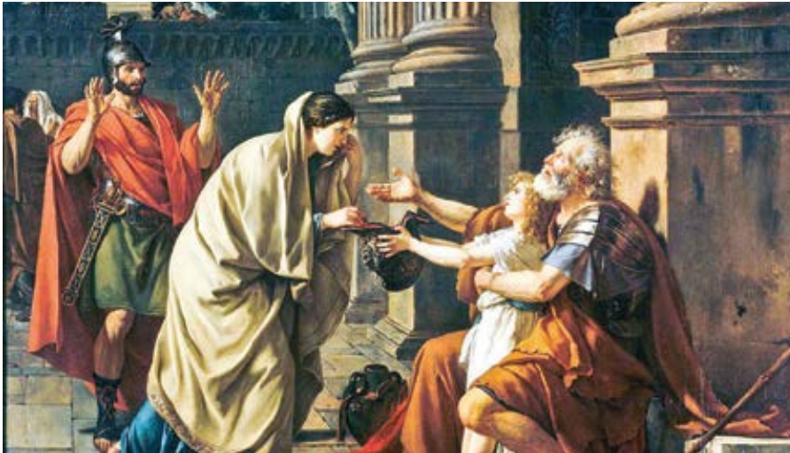
Jacques-Louis David: Belisarius prosící o almužnu (1781)

hož budou darovat peníze lidem chudším než oni. Nevím teď přesně, kolik vydělával pákistánský metař, ale pochybuji, že to bylo o mnoho víc, než kolik bylo potřeba na udržení těl a duší jich samotných a jejich rodin, pokud si vůbec mohli dovolit rodinu založit.