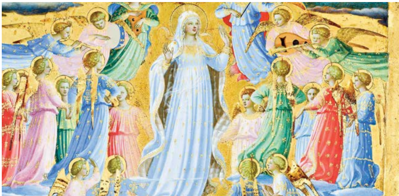
Fra Angelico: Nanebevzetí Panny Marie (1432)