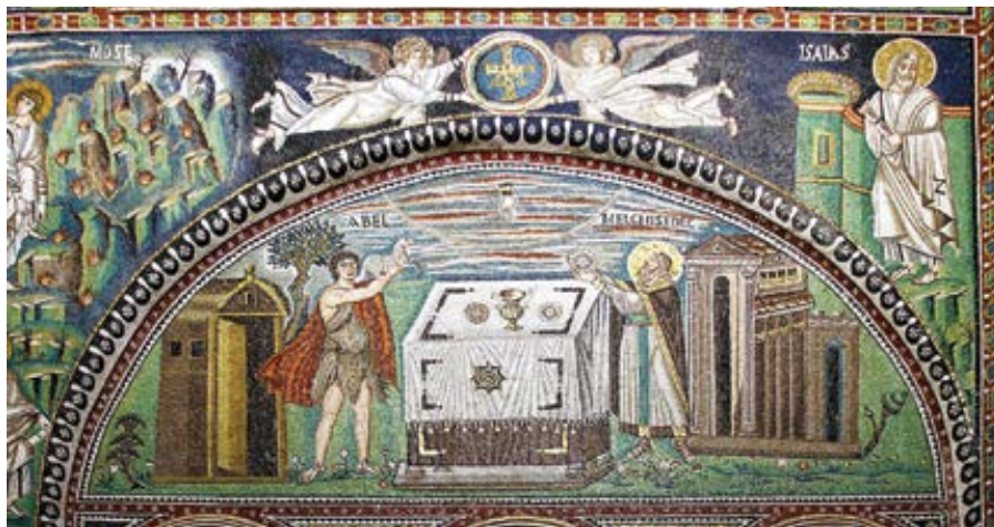
Mozaika v bazilice San Vitale, Ravenna: Oběť Ábela a Melchisedecha (547)

Všechny starozákonní oběti – a v určitém smyslu, i když mnohem více nepřímo, pozitivní prvky pohanských obětí – byly tak předobrazem, „stínem“ této jediné dokonalé oběti a, měly-li určitou účinnost, měly ji pouze jako tyto předobrazy Kristovy oběti. Nechme o tom opět zazníť hlasu sv. Augustina: „A rozmanité i složité starodávné oběti svatých byly náznaky této pravé oběti, jelikož tato jediná byla předobrazována mnoha věcmi, jako když se vyjadřuje jediná věc mnoha slovy, aby bez omrzení byla důkladně zdůrazněna.“ 9 Obdobně starozákonní kněží byli jen předobrazem Ježíše Krista velekněze.