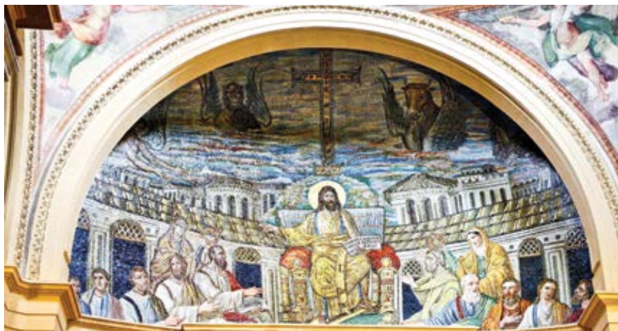
Mozaika v římské bazilice sv. Pudenziany (4. st.).

Navzdory této katolické povaze jeho spisů, díky níž je ctěn jak Východem, tak i Západem, se o něm často tvrdí, že je pravoslavným světcem, a to kvůli jeho domovu a formaci na Východě. To nás přivádí k dalšímu bodu, který s tímto souvisí, totiž k tragédii fotiovského neboli velkého schizmatu z roku 1054. Je zajímavé a zároveň matoucí sledovat vývoj tohoto schizmatu, snažit se odhalit, co jej způsobilo, jeho zdůvodnění a možné usmíření. Zdá se mi, že obě strany by mohly mít vůči té druhé důvod k obvinění, že se na něm provinily: Konstantin přesunul hlavní město, možná zbytečně, do Konstantinopole, a tím rozdělil říši, a pak uplatňoval nadměrnou autoritu nad církví a jejími koncily, což napodobovali i pozdější římsí a zejména byzantsí císařové; ikonoklasmus, který Západ pod vedením papeže téměř zcela zavrhl, zatímco mnozí na Východě se raději postavili na stranu svého císaře a jeho pyšného upřednostňování vlastních obrazů před obrazy Boha a svatých; používání svévolných anathém, exkomunikací, podplácení a koncilních úskoků oběma stranami během samotného schizmatu; a konečně okupace křížáky, která v mno-