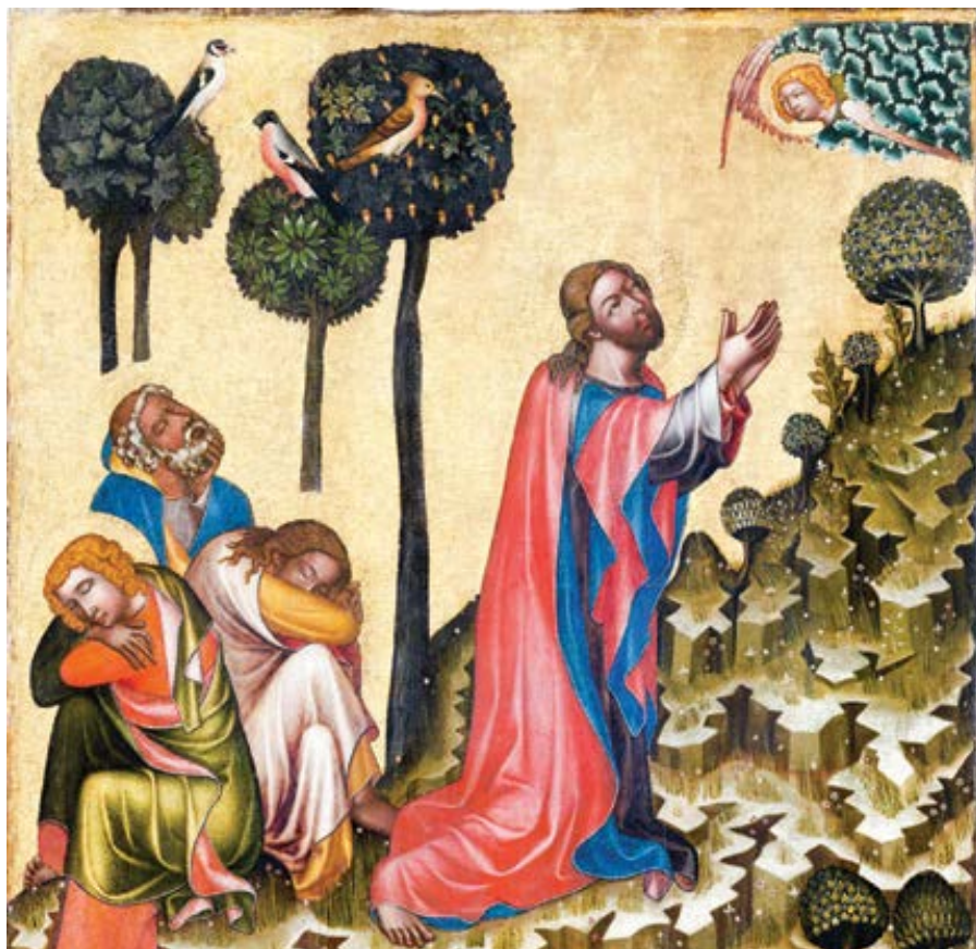
Mistr Vyšebrodského oltáře (1345–1350): Kristus na Olivové hoře

jasně patrné všude kolem nás. Avšak i velmi konzervativní duchovní a teologové raději mluví téměř o čemkoli jiném. Proč?