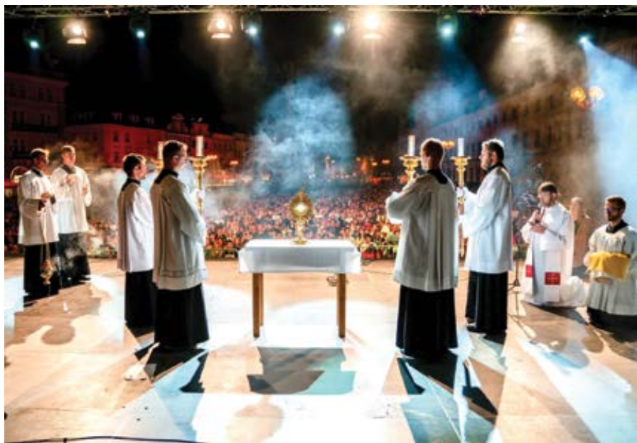
Godzone - Večer víry v rámci Celostátního setkání mládeže 2022.