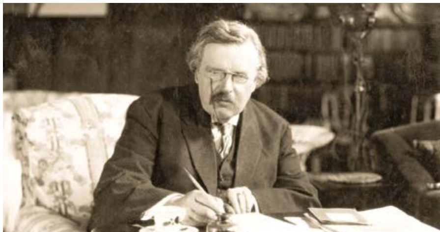
G. K. Chesterton.

K této myšlence se za chvíli vrátím, ale nejprve bych chtěl odkázat na další citát