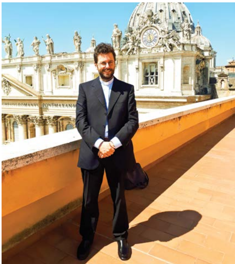
Mons. Giorgio Marengo.

„Domnívám se, že být biskupem v Mongolsku je velmi podobné biskupské službě v prvotní církvi,“ řekl biskup