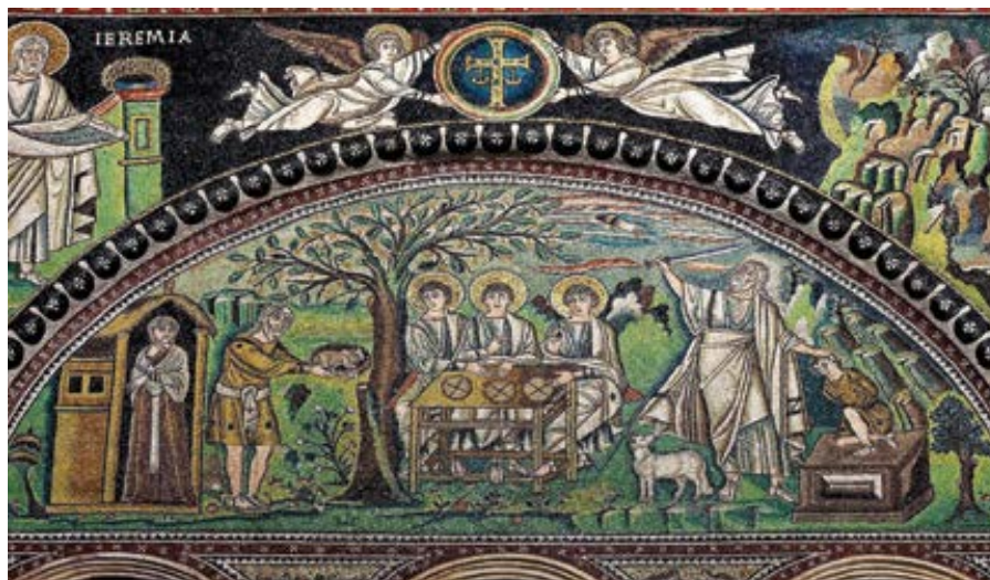
Mozaika v bazilice San Vitale, Ravenna: Obětování Izáka (547)

Přesto tyto starozákonní oběti samy o sobě – oběti zvířat a případně nekrvavé oběti, které přinášeli starozákonní kněží