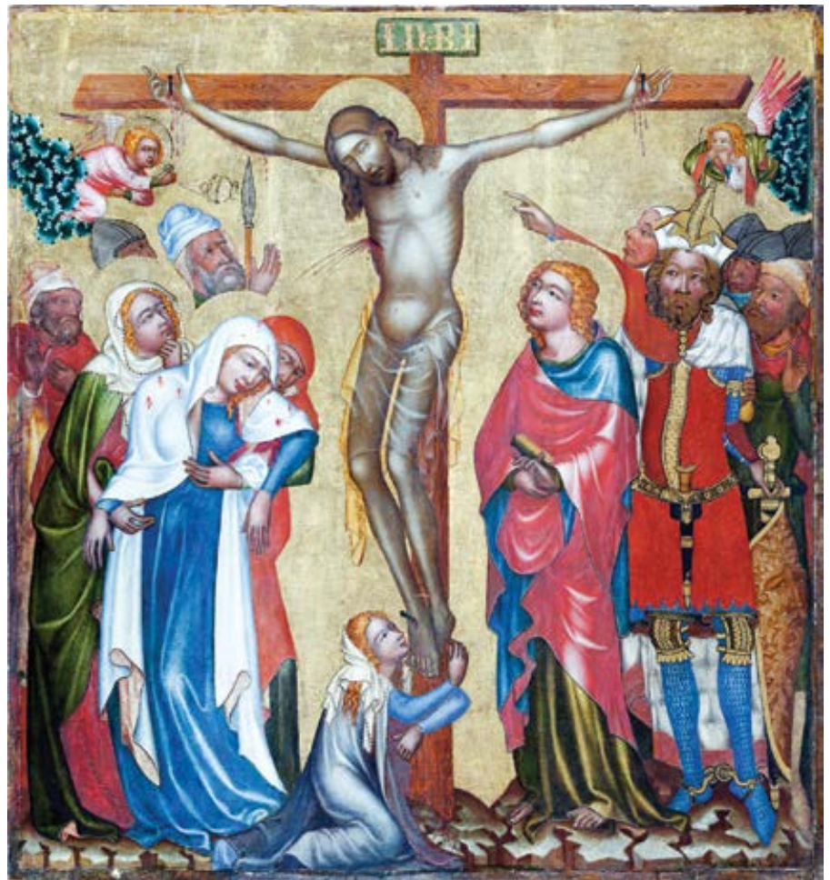
Mistr Vyšebrodského oltáře (1345–1350): Ukřižování

V křesťanském chápání je tedy utrpení, vyjádříme-li se jazykem počítačových programátorů, záměr, nikoli chyba programu . Není nevysvětlitelnou skutečností ohledně stavu člověka ani nepřijemností pro křesťanskou teologii, od níž by tradice raději odvedla naši pozornost pryč. Naopak, tradice staví realitu utrpení do popředí a do středu pozornosti a trvá na tom, že je nevyhnutelným důsledkem prvotního a vědomého hříchu. Tomuto tématu jsem se již věnoval v jednom star-