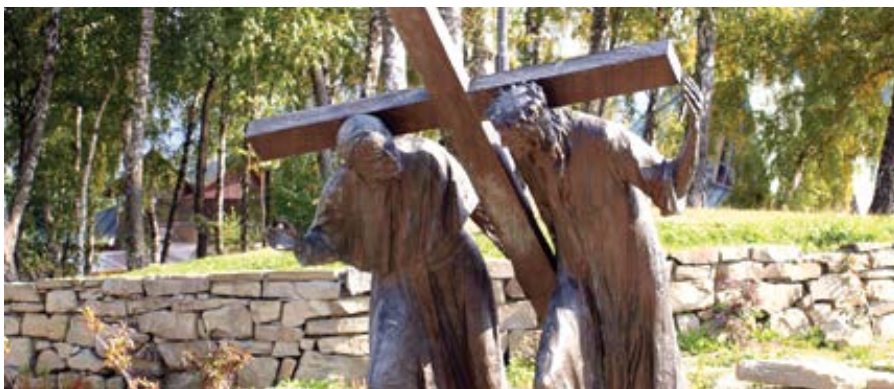
Zastavení křížové cesty v polském Pasierbici.

Jestliže Pán kvůli vám opustil svou matku, když řekl, kdo je moje matka a kdo jsou moji bratři? (Mt 12,48), proč ji chceš dát Pánu? Pán vám však nepřikazuje, abyste přírodu ignorovali nebo šli proti ní, ale abyste ji milovali tak, že budete ctít jejího stvořitele a že vás vaše láska k rodičům neodvede od Boha.