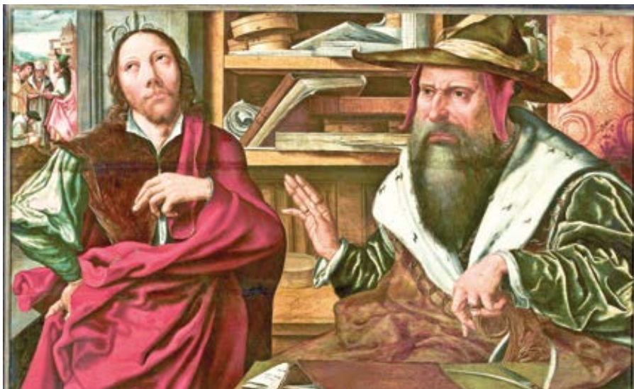
Marinus van Reymerswaele: Podobenství o rozumném hospodáři (16. st.)

Tak nazývá syny tohoto světa ty, kdo myslí na to, co mají na zemi, a syny světla ty, kdo berou do rukou duchovní bohatství světla s pohledem upřeným na Boží lásku. I při správě lidských záležitostí však zjišťujeme, že vše řídíme prozíravě a snažíme se, abychom po skončení správy měli úto-