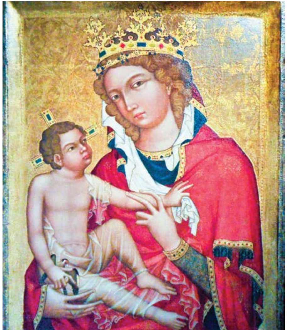
Mistr Vyšebrodského oltáře: Madona z Vevří (cca 1350)

V běžné řeči není neobvyklé označit někoho za svého „bratra“, i když mezi vámi není žádný fyzický pokrevní vztah. My křesťané jsme všichni „bratři v Kristu“. Výraz „bratr“ se může vztahovat na někoho, s kým jste pokrevně příbuzní – nebo může odkazovat na někoho, kdo není biologicky příbuzný, ale s kým vás pojí spo-