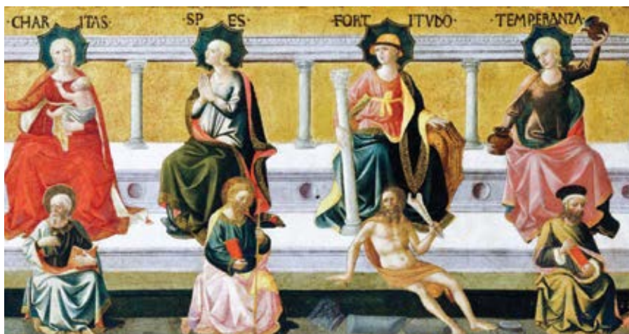
Francesco Pesellino: Sedm ctností (cca 1450)

což by mu Gandalfova moc ani Aragornova ctnost poskytnout nemohly.