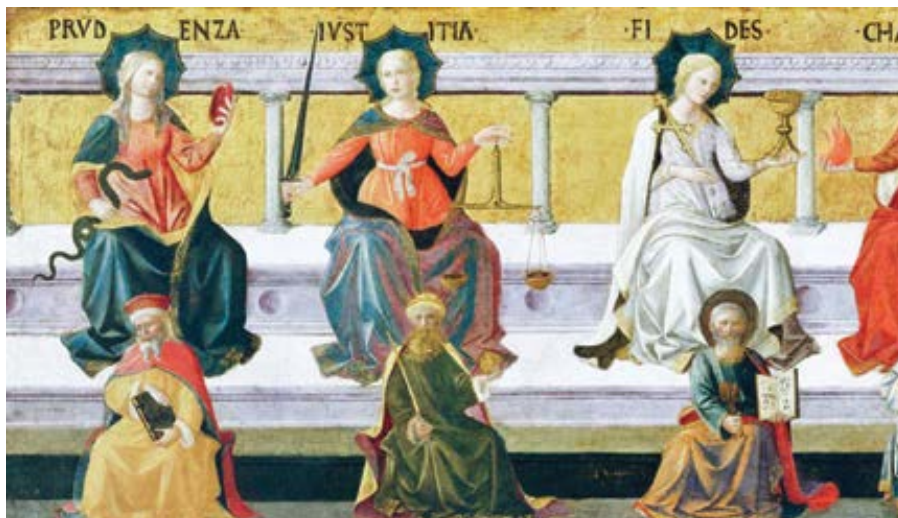
Francesco Pesellino: Sedm ctností (cca 1450)

snáší, všemu věří, ve vše doufá, všechno vydrží“ (1K 13,7 ČLP).