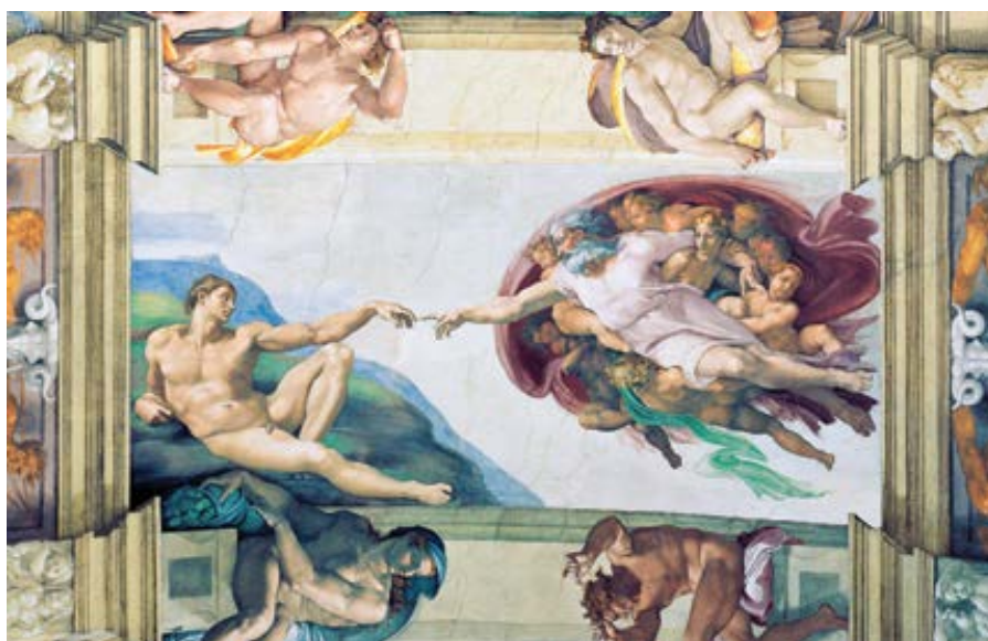
Michelangelo Buonarroti: Stvoření Adama (1508–1512)

Tolkienovo pojetí ctnosti je jedním z ústředních motivů Pána prstenů . Ctnost je zobrazována jako podstatným způsobem spjatá s civilizací, a pokud nebudou stráženy, společně zchátrají. Hlavní konflikt Pána prstenů vychází ze vzestupu zla, jemuž předchází úpadek ctnosti lidí. Stejnou dynamiku vidíme ve společnosti kolem sebe. Ve skutečnosti panuje všeobecná antipatie vůči jakémukoli náznaku, že by v řízení společnosti měl nějakou roli hrát kodex chování za-