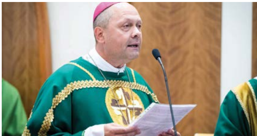
Mše svatá „Za oběti sexuálního zneužívání.“ Olomouc.