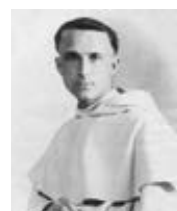
Réginald Garrigou-Lagrange, O.P. francouzský katolický teolog