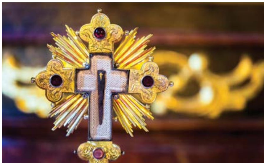
Relikvie sv. Hřeby v kostele sv. Jiljí při premonstrátském klášteře v Milevsku. Hřeb z tzv. Pravého kříže byl nalezen na jaře 2020 během rekonstrukce klášteře.

Na závěrečnou deklaraci tohoto světového a důležitého setkání navázal emeritní pražský arcibiskup, kardinál Dominik Duka, který připomíná: „S přihlédnutím k bouřlivým událostem ke kterým dochází ve světě, ale i s přihlédnutím k setkání náboženských vůdců v Kazachstánu, bych chtěl připomenout osud emeritního hongkongského biskupa, kardinála Josepha Zena, který 19. září stane před čínským soudem. Myslím, že prohlášení představitelů náboženského života, které hovoří o náboženské svobodě a o potřebnosti demokratických principů je opravdovým důvodem, aby-