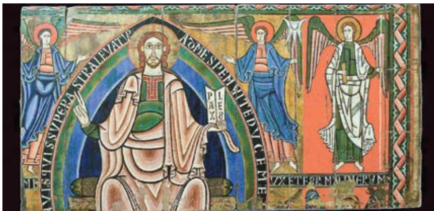
Baldachyn z Ribes (1125/1150)

Sv. Augustin naproti tomu tvrdí, že tytéž duchovní statky mohou současně