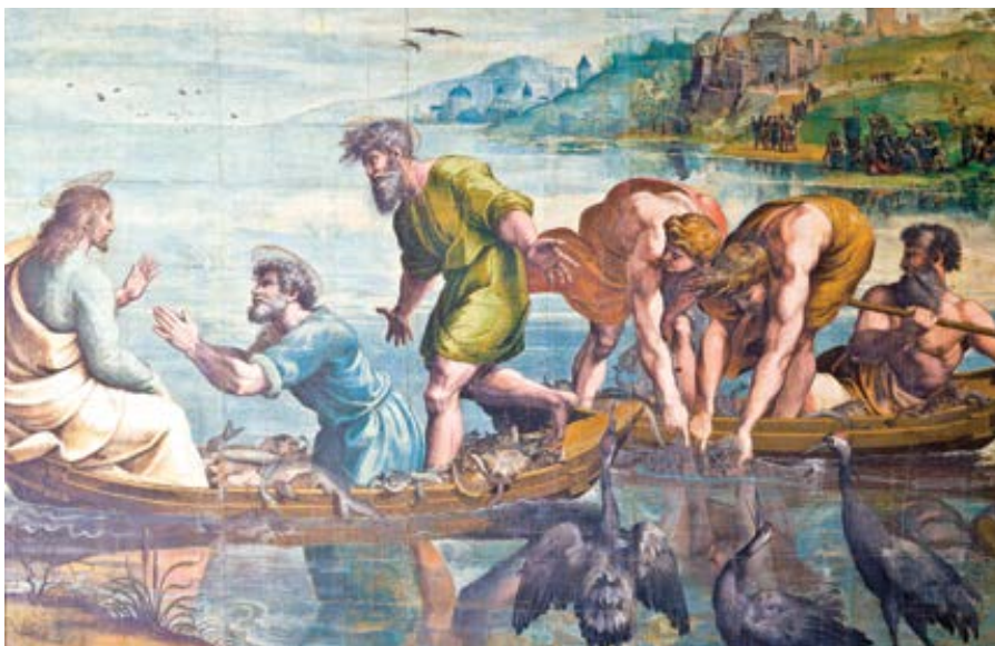
Rafael Santi: Zázračný rybolov (cca 1515-1516)

Prvek prestiže v práci často podceňujeme, ale stačí se zeptat muže, kterému se „zhroutil“ kariéra, na to, jak to změnilo jeho společenské postavení. Je zcela přirozené, že všichni muži touží po respektu svých vrstevníků, a lukrativní