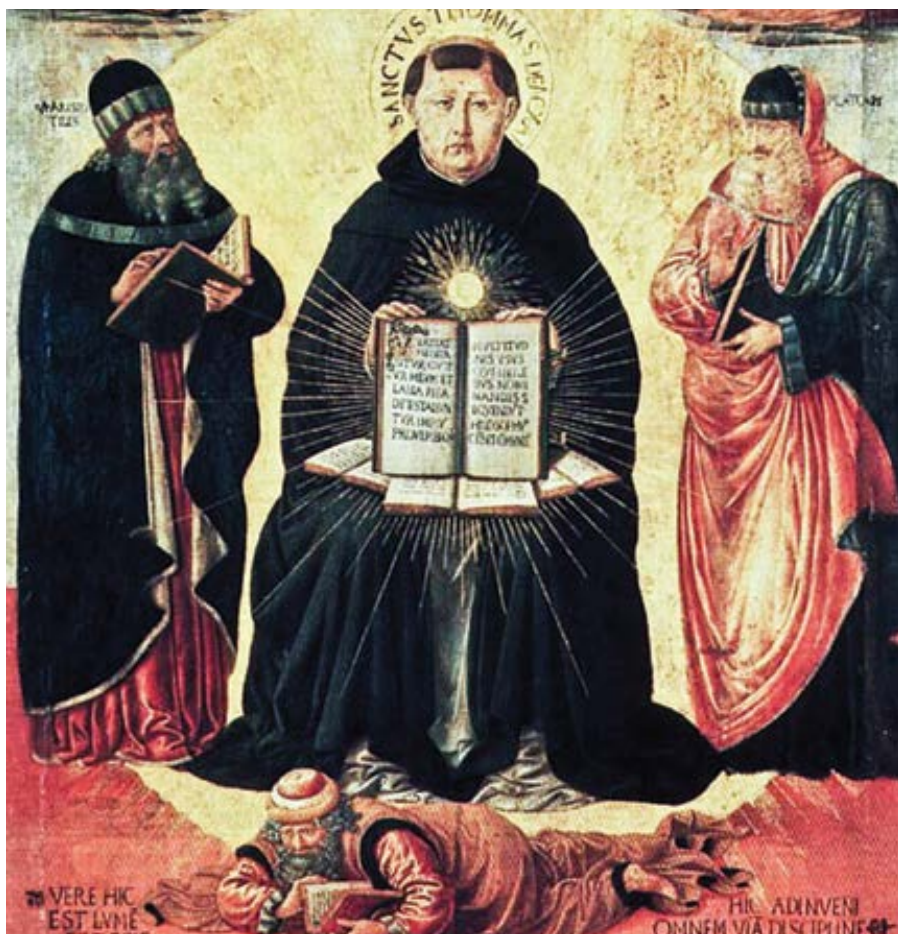
Benozzo Gozzoli: Sv. Tomáš Akvinský po boku s Platónem a Aristotelem triumfuje nad Averroem (1468–1484)

vidí jiné zarmoucené nad svým smutkem, povstane mu jako nějaká představa, že ono břemeno s ním nesou jiní, jako usilující ulehčiti mu v onom břemeni, jako se také stává při nošení tělesných břemen. – Druhý důvod, a lepší, jest, že tím, že přátelé jsou s ním smutní, poznává, že ho milují; a to těší, jak bylo svrchu řečeno. Proto, ježto každé potěšení mírní smutek, jak bylo svrchu řečeno, následuje, že přítel soucitný mírní smutek.“