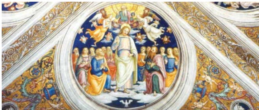
Perugino: Trojice mezi apoštoly (1507)

Jinak. Mnozí nechápou, že zde jde o víru v nejvznešenější pravdu, a tak se může zdát, že Pán na otázky učedníků neodpověděl. Podle mého názoru je to však obtížné: ledaže bychom tato slova chápali jako přechod od víry k víře, tedy od současné víry, kterou sloužíme Bohu, k víře, kterou se radujeme z Boha. Když nejprve uvěříme slovům kazatelů a pak skutečnosti, kterou vidíme na vlastní oči, víra se zvětšuje. Tato vize však v sobě obsahuje nejvyšší pokoj, který je odměnou ve věč-