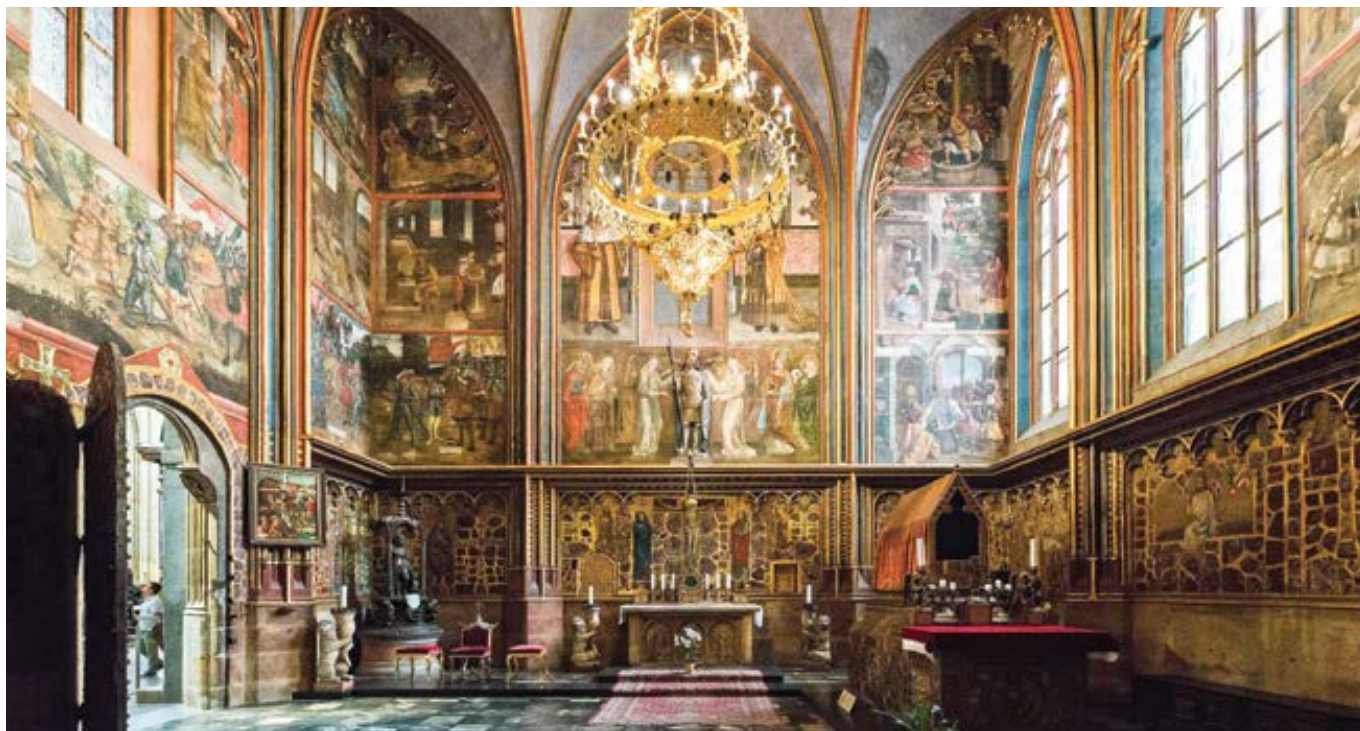
Kaple sv. Václava ve svatovítské katedrále.