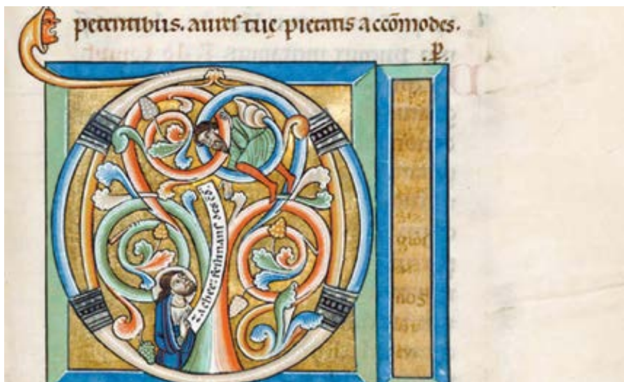
Iniciála D: Zacheus a Kristus. Hildesheim, cca 1170

A všimněte si nezměrné Spasitelovy dobroty. Nevinný se mísí s vinným, pramen spravedlnosti s chamtivostí, která je kořenem zkaženosti: vešel do domu celníka a neutrpěl žádnou újmu, naopak – jasmem spravedlnosti se chamtivost rozptýlila. Ale kousavci a milovníci odsuzování se pokoušejí zvážit, co se kvůli tomu stalo; neboť následuje: když to viděli, všichni reptali: Vstoupil do domu hříšného člověka! Ale on už byl označen za přítele celníků, a tak si toho nevsímal, aby uskutečnil svůj záměr: vždyť ani lékař nezmirní nemoc, pokud se nesetká s hnísem nemocného; to se také stalo, neboť celník se obrátil a polepšil. Následuje – Zacheus však vstal a řekl Pánu: „Polovici svého majetku, Pane, dám chudým, a jest-