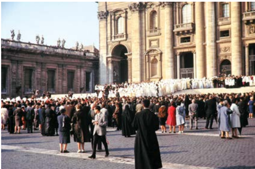
Procesi koncilních otců k zahajovací bohoslužbě Druhého vatikánského koncilu 11. října 1962 na náměstí sv. Petra v Římě.