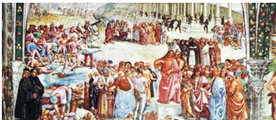
Luca Signorelli: Kázání a skutky Antikrista (1499–1502)