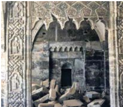
Kostel Mar Thoma v iráckém Mosulu.

Práce na obnově je součástí úsilí, které vyvíjí Mezinárodní aliance pro ochranu