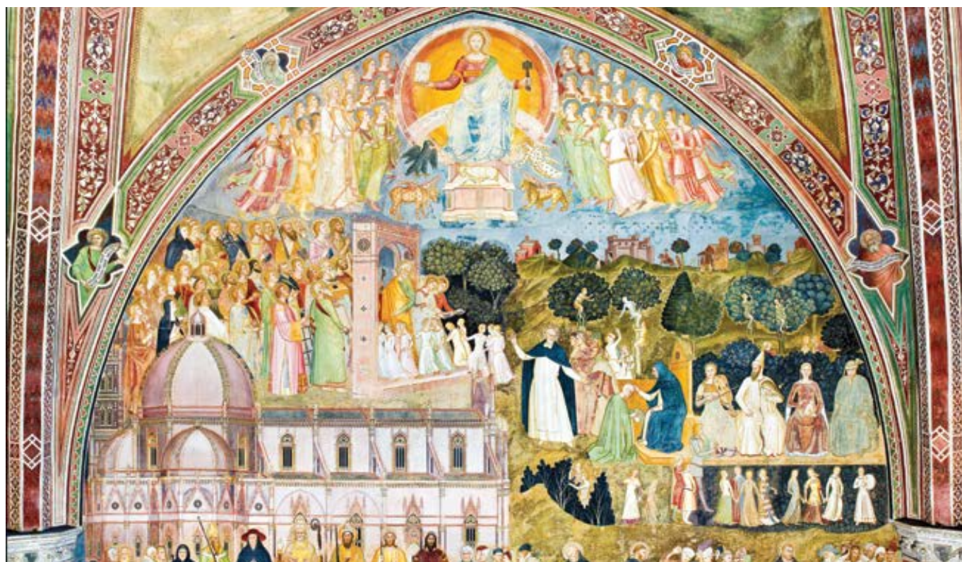
Andrea di Bonaiuto: Via veritas (1365–1367)