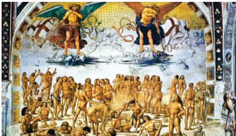
Luca Signorelli: Vzkříšení těla (1502)