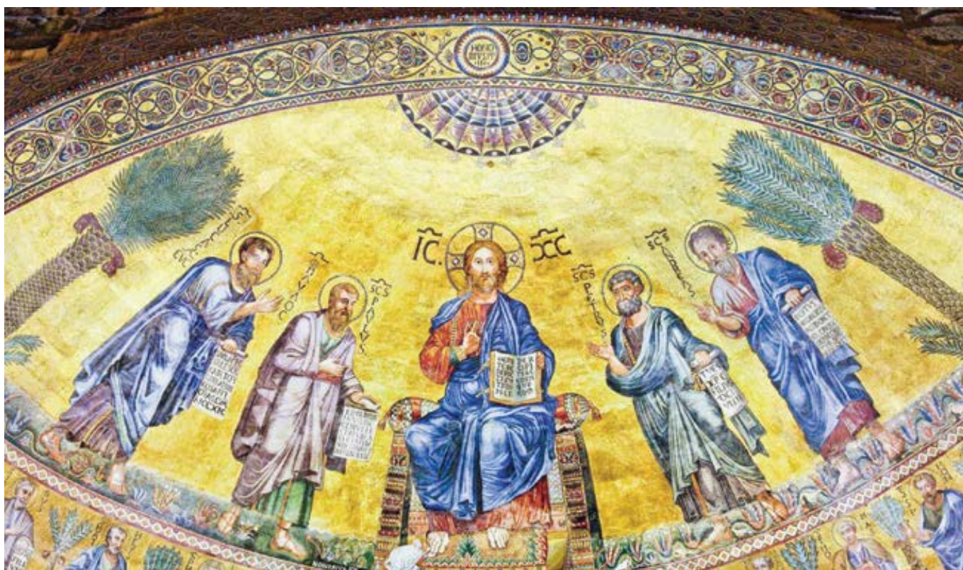
Mosaika benátských mistrů (13. stol.) v římské bazilice sv. Pavla za hradbami.