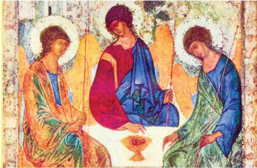
Andrej Rublev: Nejsvětější Trojice (1425)

mínejme, že typickým rysem modernistů je mít pochopení pro rané hereze, které církev zavrhlá.)