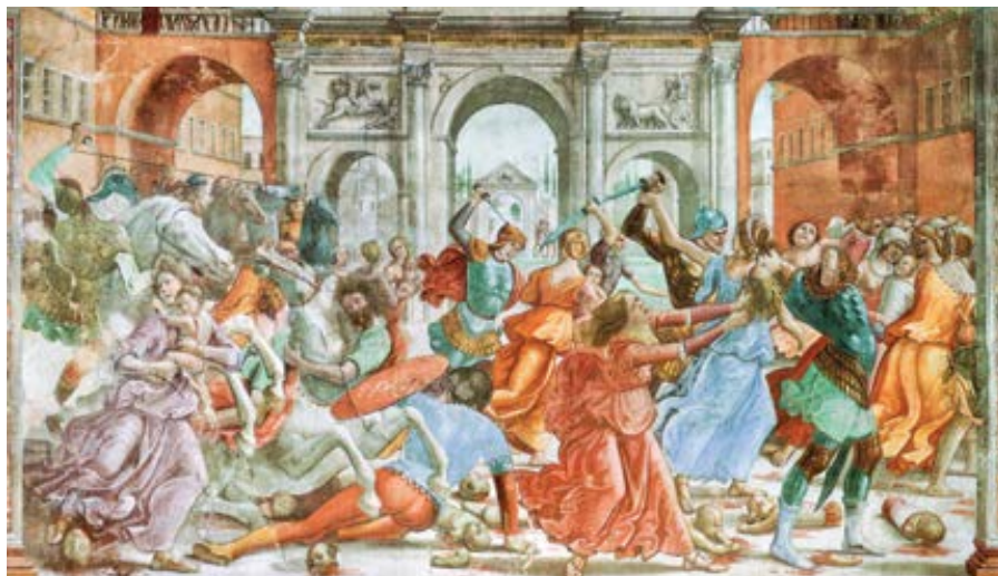
Domenico Ghirlandaio: Masakr nevinných (1485–1490)

dělají stejnou práci a zdánlivě sejí totéž, ale ovoce své práce nedostanou stejným způsobem. Také těmi dvěma, které melou stejně, máme rozumět buď Synagogu a Církev (neboť se zdá, že melou současně v Zákoně a z téhož Písma svatého melou mouku Božích příkazů), nebo jiné hereze, které se zdají mlít mouku svých nauk buď z obou Zákonů, nebo z jednoho.