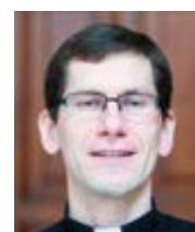
P. Jan Polák

Kdybychom zkoumali celkovou etickou (ne)přijatelnost tetování, museli bychom se ptát i po dalších věcech, např. jaký ornament si kdo nechává vytetovat (u věřícího křesťana také v návaznosti na Lv 19,28 a na 1 Kor 6,19) a z jakého důvodu. Museli bychom řešit i otázku finanční náročnosti u konkrétních jedinců. Bylo by třeba se ptát, jestli tyto osoby tetováním nevyvolávají ve svém okolí pohoršení či skandál (zdravotní sestra, farář) a vhodně působí na malé děti (učitelka v mateřské školce) apod.