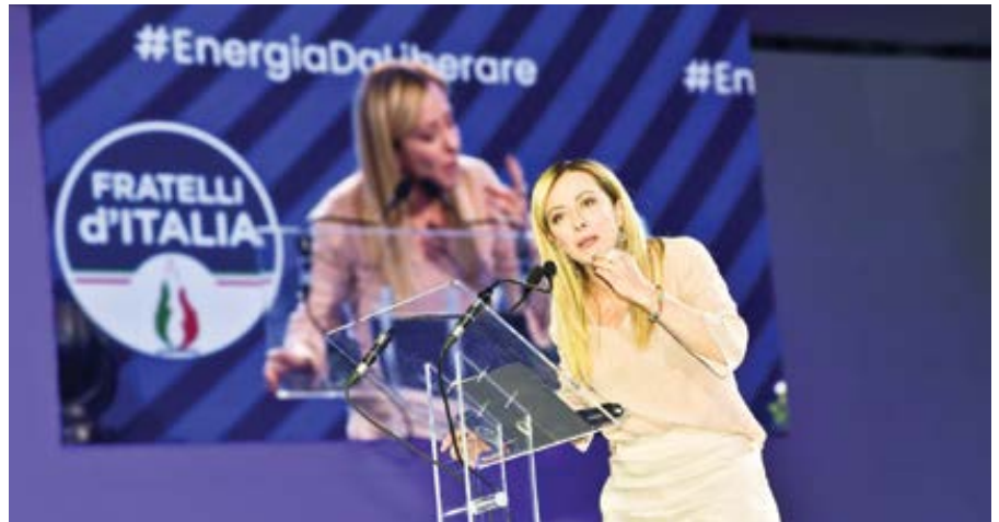
Giorgia Meloniová.

Prozatím jen vezměte na vědomí, že Giorgia Meloniová vyhrála parlamentní volby, z nichž pravděpodobně vzejde jako nová premiérka. Musíte také vědět, že většina voličů skutečně hlasovala napravo od středu pro konzervativnější strany a koalice. Meloniová zvítězila v rámci komplikované změní současné italské politiky. Zvítězila v zemi, která je unavená po dlouhé byrokratické pande-