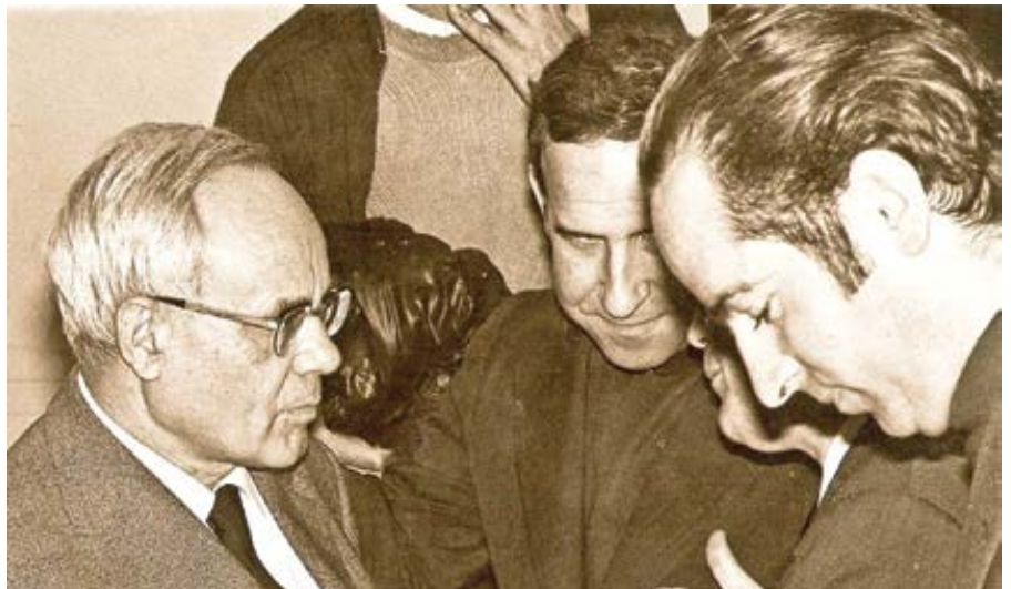
Karl Rahner.

Bůh, který je tři Osoby v jedné přirozenosti, stvořil člověka, aby mu při-