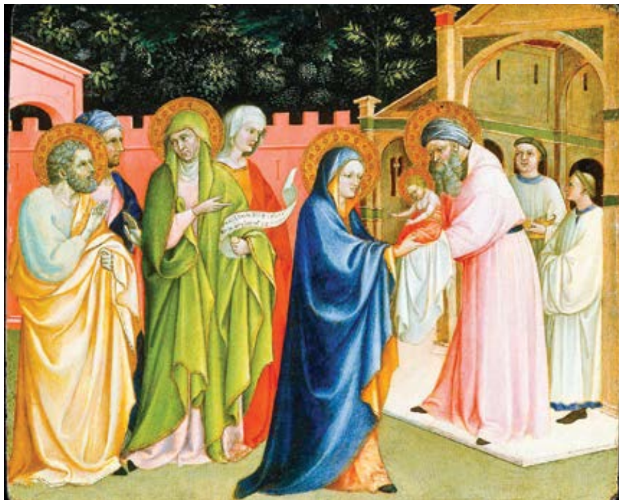
Álvaro Pires de Évora: Uvedení Páně do chrámu (cca 1430)

pochopit rabín Abraham Skorka: „Křesťanství převzalo funkci kněze z hebrejské Bible... také v našem vyznání příslušelo kněžství mužům. Ale dnes máme učitele, ne kněze.“ 4