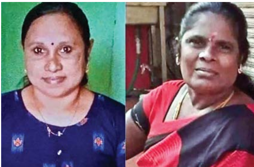
Roslin a Padma.

Katoličtí biskupové v jihoindickém státě Kérala vyjádřili své zděšení z obětování dvou žen. Tyto lidské oběti byly součástí obřadu prováděného k získání bohatství a prosperity.