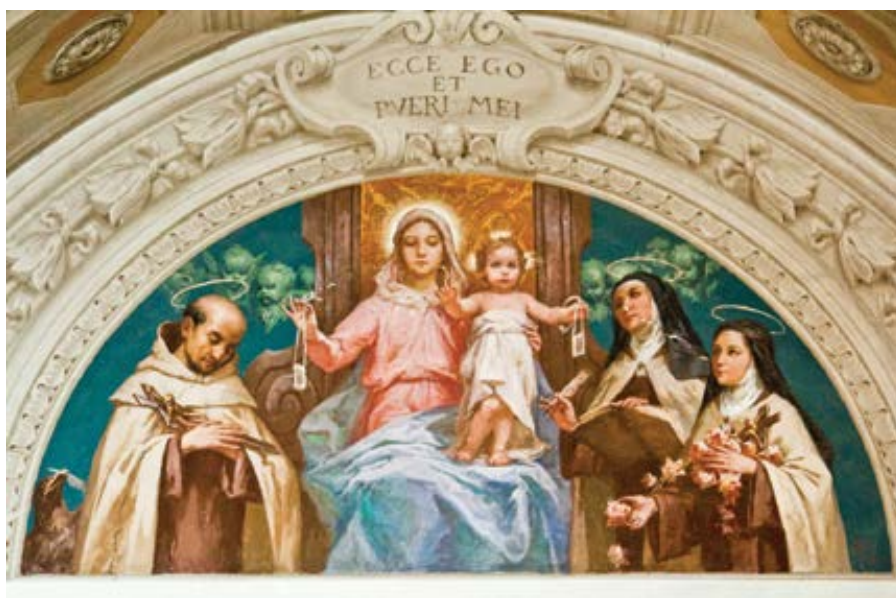
Kostel Santa Maria della Victoria v Římě: Předávání karmelitánského hnědého škapuliře sv. Janu od Kříže, sv. Terezií z Avily a sv. Terezií z Lisieux.

Tyto etapy se často označují jako cesta očišťování, cesta osvětlení a cesta sjednocení. Jejich názvy vyjadřují převládající činnost každé z nich.