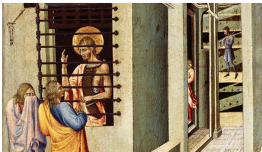
Giovanni di Paolo: Sv. Jana Křtitele navštěvují ve vězení dva učedníci (1455–1460)

Kristus věděl, jak Jan uvažuje, a proto neřekl: „Já jsem“, protože by to těm, kteří by to chtěli slyšet znovu, kladlo překážky. Mysleli by si totiž (i kdyby to neřekli), co mu řekli Židé: Svědčíš sám o sobě (J 8,13). Proto je učil svými zázraky a své učení jim předkládal jasněji a bez podezření. Svědectví skutků je věrohodnější než svě-