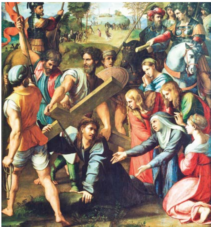
Rafael Santi: Nesení kříže (1516)

Opusťme na chvíli papežské stanovisko, které je bohatší než uváděné dva důvody, a podívejme se blíže na tyto akademické argumenty. Skutečně pouhý fakt, že dosud v církvi něco nebylo, neznamená, že to ani nebude. Tradice v církvi je právě o tom, že spolu s námi necháváme o případných novinkách chestertonovsky „hlasovat“ i své předky. Ovšem nebylo v církvi ještě vyzkoušeno