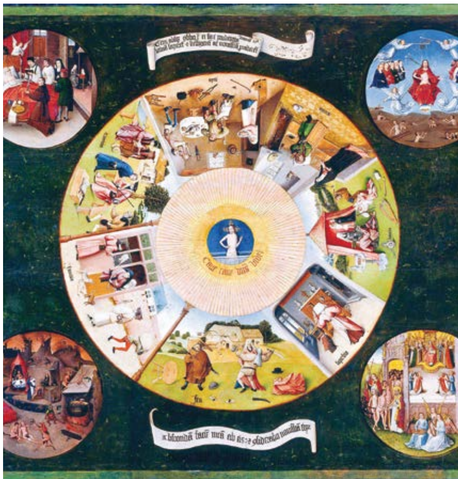
Hieronymus Bosch nebo jeho následovník: Sedm smrtelných hříchů a čtyři poslední věci člověka (1505–1510)

I to je ale problém, protože lehký hřích „oslabuje lásku“ a „je překážkou v pokroku duše při uskutečňování ctností a při konání mravního dobra“ a „úmyslný všední hřích, který zůstal bez lítosti, nás pohněhlou disponuje ke spáchání smrtelného hříchů“, ale lehký hřích (sám o sobě) „nezbavuje posvěcující milosti, přátelství s Bohem, lásky ani věčné blaženosti“ (KKC 1863).