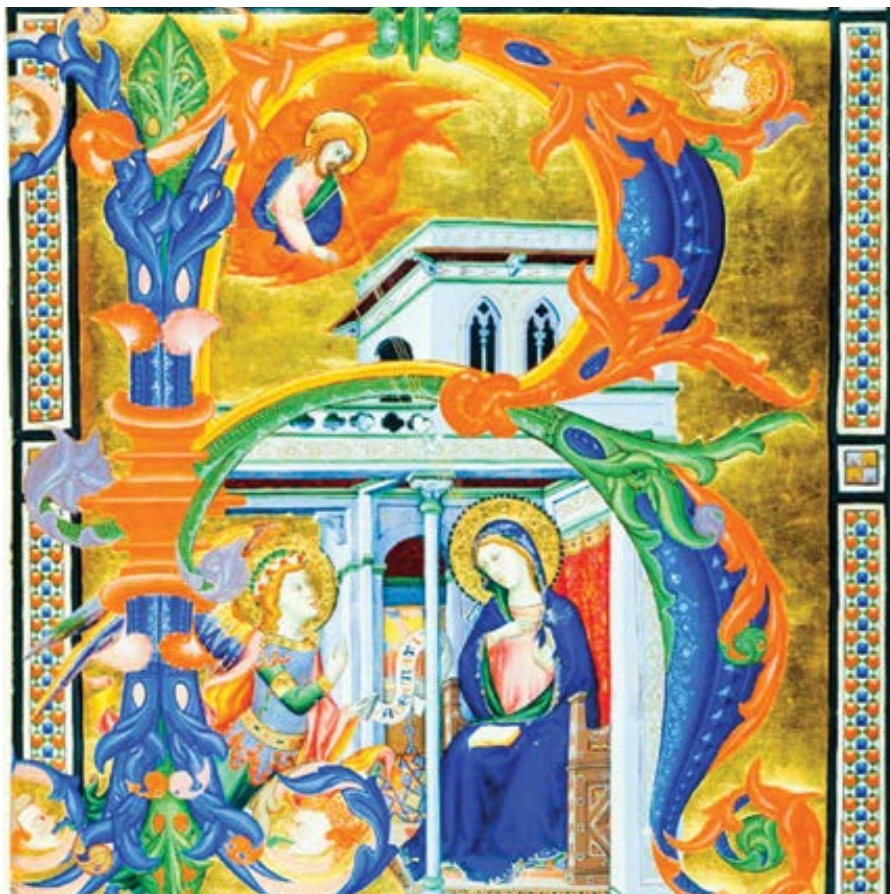
Silvestro dei Gherarducci: Graduál ze Santa Maria degli Angeli - Zvěstování v iniciále R (14. st.)