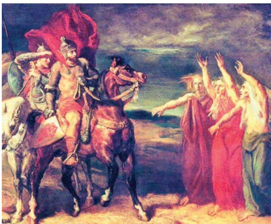
Théodore Chassériau: Macbeth a Banko potkávají na planině čarodějnice (1855)

Uvážíme-li, že poslední vlnu protikatolického pronásledování vyvolal nový skotský král Jakub I., je významné, že se Shakespeare právě tehdy rozhodl napsat hru o podlém skotském králi. Navíc, ačkoli je Macbeth skutečná historická postava, jistě není pouhou shodou okolností, že Mac-Beth znamená „syn Běty“, což je jen nepatrně skrytá nářezka na to, že Jakub pokračuje v tyranské tradici své předchůdkyně Alžběty I. Když uvážíme, že Alžběta nařídila popravu Jakubovy matky Marie Stuartovny, toto spojení bylo ze Shakespearovy strany geniálním satirickým tahem. Dalším projevem satirické brilantnosti je, jak Shakespeare staví do kontrastu ničemného skotského krále Macbetha s jeho velkým anglickým současníkem a protějškem sv. Eduardem Vyznavačem. Vyzdvihuje tak rozdíl mezi machiavelliovským protikatolictvím současné Anglie a ctnostnými katolickými