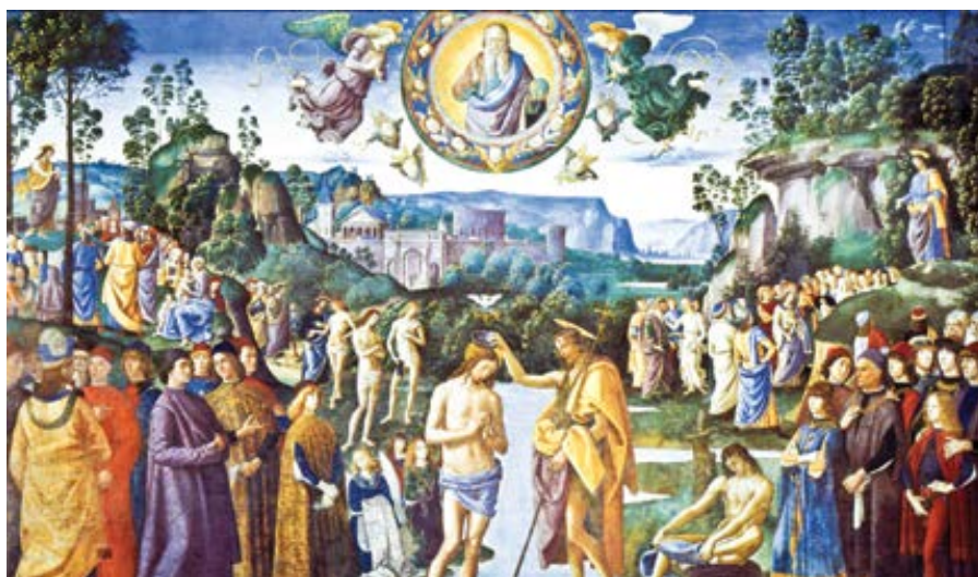
Perugino: Křest Páně (cca 1482)

Proto přišel ke křtu, abychom viděli, že přijetím lidské přirozenosti naplnil celé tajemství lidství. Ačkoli sám nebyl hříšník, přijal hříšnou přirozenost. On sám křest nepotřeboval, ale tělesná přirozenost druhých ano. (...) Jako by řekl: „Máš dobrý důvod, abys mě pokřtil – abych byl spravedlivý a hodný nebe. Jaký je však důvod, abych vás pokřtil? Všechno