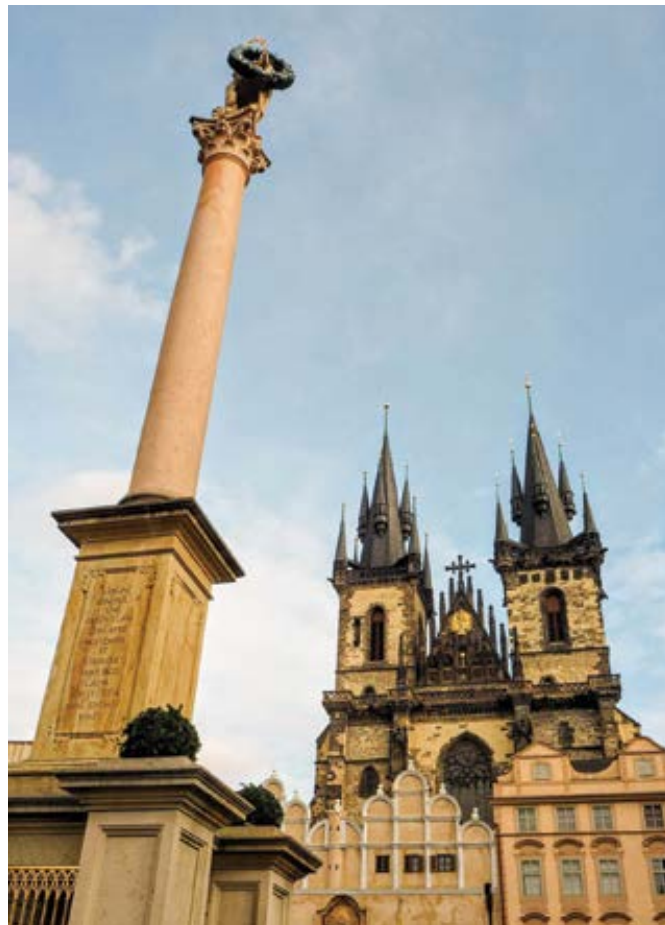
Na slavnost Neposkvrněného početí Panny Marie dekorovali poprvé pražští hasiči obnovený Mariánský sloup vítězným věncem po vzoru římských hasičů na Piazza di Spagna.

Advent je nejen dobou očekávání a půstu, ale i hluboké reflexe o člověku, životě a světě. Jan Pavel II. V encyklice Dives in misericordia - encyklika O Božím milosrdenství píše: „V dnešním světě narůstá pocit ohrožení. Roste onen existenciální strach, který je spojen především s vyhlídkou na válečný konflikt, který by vzhledem k dnes existujícímu arzenálu atomových zbraní nutně znamenal alespoň částečnou sebevraždu