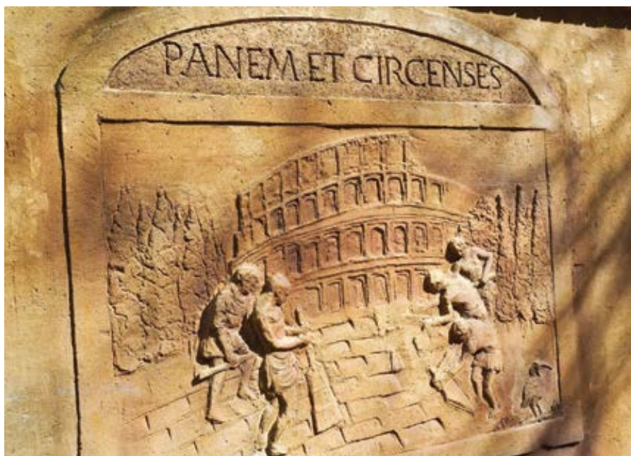
Reliéf „Chléb a hry“.

Del Noce si všímá, že svoboda žen „bývá ztotožňována s absolutní sexuální svobodou“. Tento postřeh by byl chápán jako pronikavý, i kdyby byl formulován dnes, ale vzhledem k tomu, že je desítky