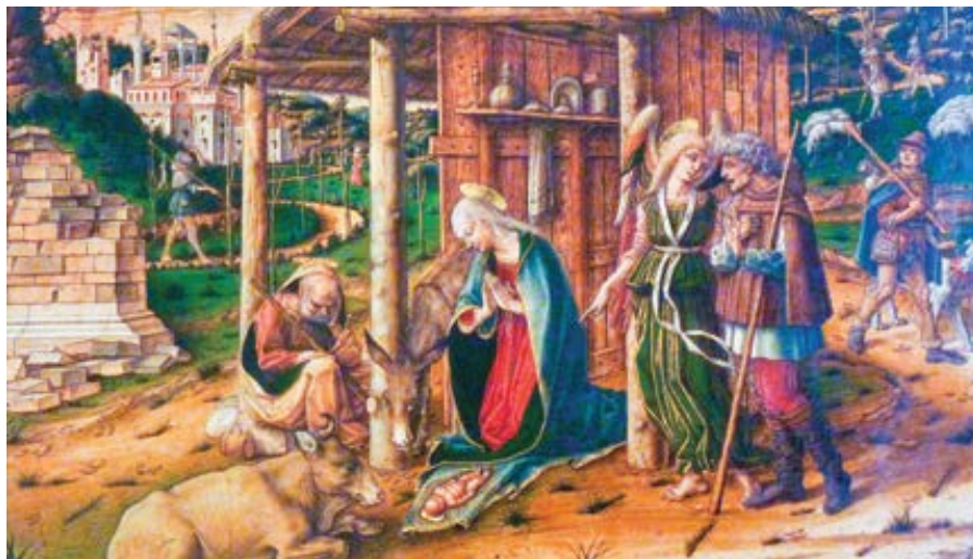
Carlo Crivelli: Klanění pastýřů (cca 1480)

Toto je tedy první soupis myslí pro Pána, pro něhož se všichni dávají zapsat,