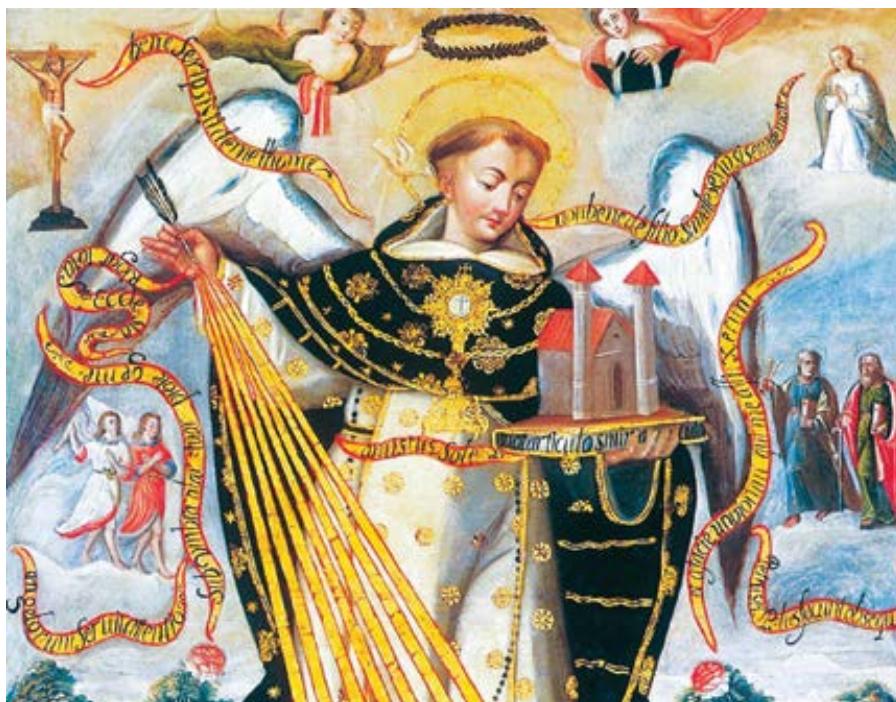
Sv. Tomáš Akvinský, ochránce univerzity v peruánském Cuzco (1690–1695)

Svatý Tomáš patřil k řádu kazatelů, nazývanému podle svého zakladatele „dominikáni“. Byl to první řád v dějinách církve, který považoval studium – tedy intelektuální práci – za svatou a posvěcující činnost samu o sobě, za něco, co stojí za to provozovat ne jako pouhý nástroj k ně-