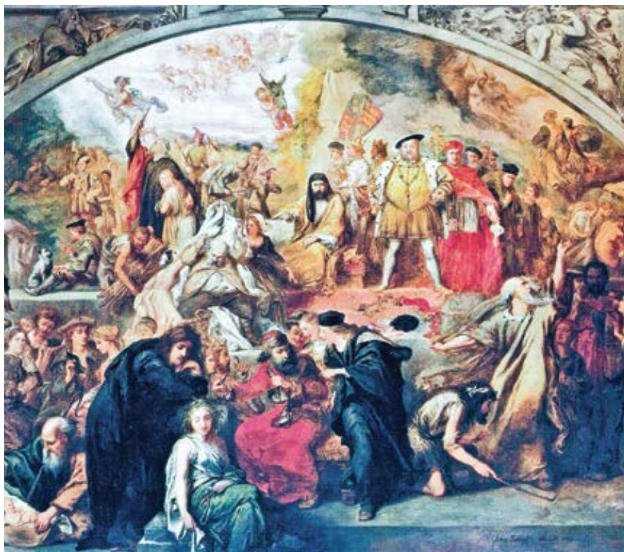
John Gilbert: Hry Williama Shakespeara (cca 1849)

Macbeth je tak odhalen jako opak Hamleta. Zatímco Hamlet začíná v hluboké depresi, kdy je v silném pokušení zcela propadnout zoufalství, v průběhu hry roste v ctnosti, až dosáhne zralosti křesťanského obrácení a je připraven přijmout svou vlastní smrt jako součást Boží laskavé prozřetelnosti: „Ne, ne, na