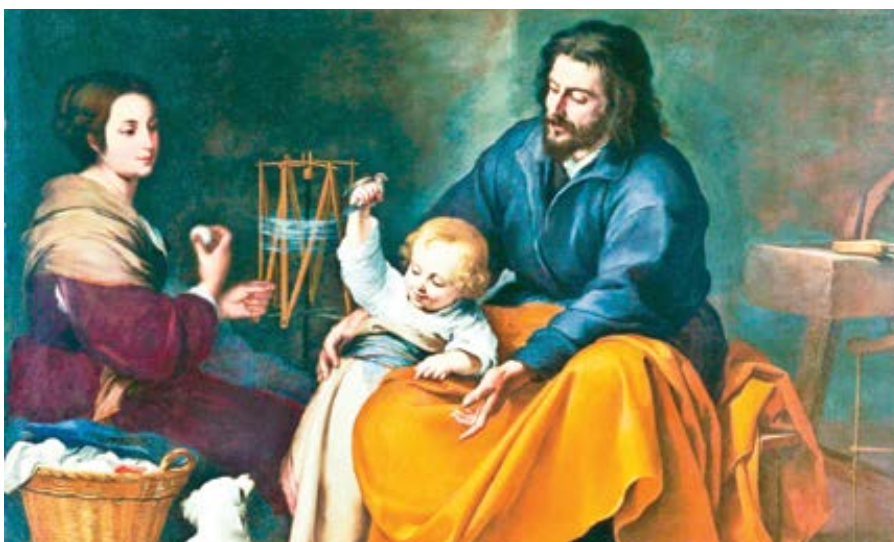
Bartolomé Esteban Murillo: Svatá rodina s ptáčkem (cca 1650)

Opakem mužnosti je zženštilost. Než se vaše politicky korektní citlivost rozruší při pohledu na slovo, které se trochu podobá „ženskosti“, nezaměňujte prosím tyto dva