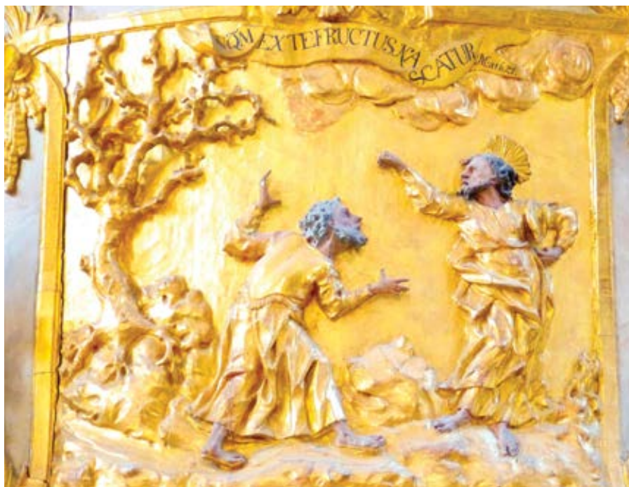
Podobenství o fíkovníku.

A s velkým strachem máme poslouchat slova „Poraz ho! Proč má zabírat půdu?“ Protože každý má svým způsobem místo v tomto životě a pokud nepřináší ovoce dobrých skutků, vyčerpává zemi jako neplodný strom. Na místě, na kterém sám