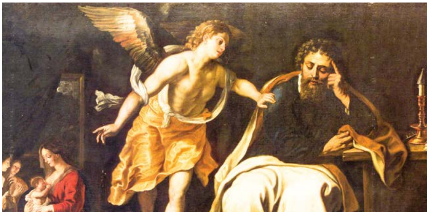
Gerard Seghers: Sen svatého Josefa (cca mezi 1625–1630)