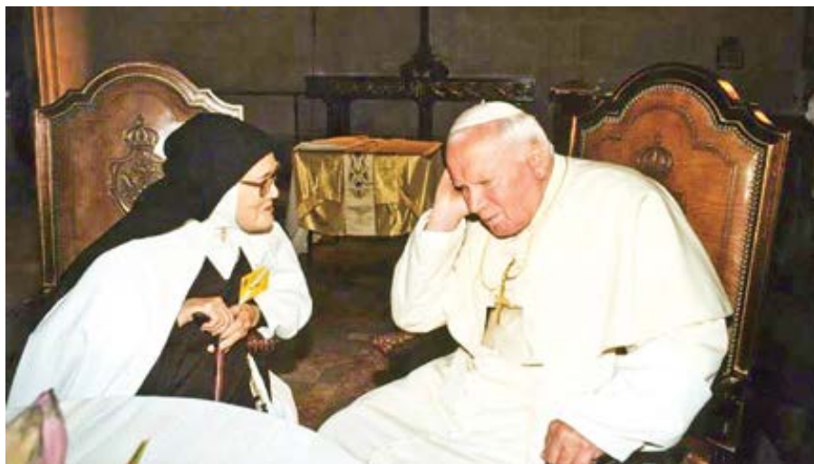
Sestra Lucie s Janem Pavlem II.

svaz jako rudá šelma z Apokalypsy podle prorockých slov druhého fatimského tajemství rozšířil své komunistické bludy po světě. Mnohé národy trpěly pod jhem bolševického komunismu a Pius XII. s nimi velmi soucítit. Dne 7. července 1952 tak publikoval svůj apoštolský list Sacro vergente anno , adresovaný národům Ruska, v němž Rusko zasvětil Neposkvrněnému Srdci Panny Marie. Také v tomto případě odpověď nebe nedala na sebe dlouho čekat: dne 5. března 1953 nenadále zemřel Stalin.