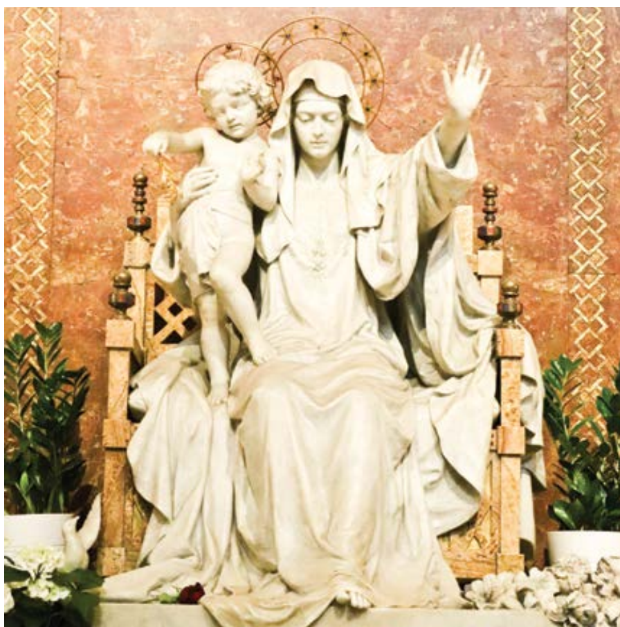
Socha Panny Marie, Královny míru v bazilice Santa Maria Maggiore v Římě.

S Ruskem se poprvé setkáváme v třetím zjevení dne 13. července 1917, kdy Matka Boží sdělila vizionářům své vrcholné poselství v podobě tzv. Velkého tajemství o třech částech. Pro nás je důležité to, co je obsaženo v druhé části tajemství, neboli v druhém fatimském tajemství: „Jestliže lidé udělají to, co vám řeknu, mnohé duše se zachrání a navrátí se jim pokoj. Válka se schyluje ke konci; nepřestanou-li však urážet Boha, začne během pontifikátu Pia XI. jiná, ještě horší. Až