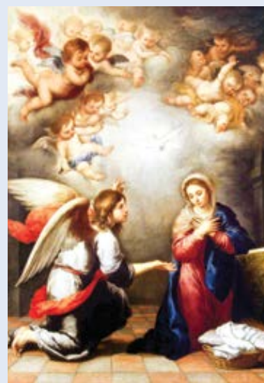
Bartolomě Esteban Murillo: Zvěstování (cca 1660)

Informace o pouti jsou dostupné na stránkách zvestovani.neposkvrnene.cz .