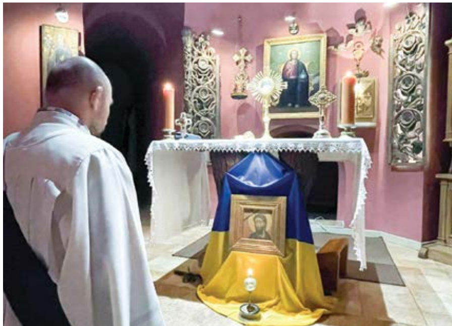
Kaple v dominikánském Centru sv. Martina de Porres v ukrajinském Fastivě.

„Dnes je pátek [4. 3. 2022]. Mnoho z nás se zúčastnilo nebo se zúčastní bohoslužby Křížové cesty. Prosím o modlit-