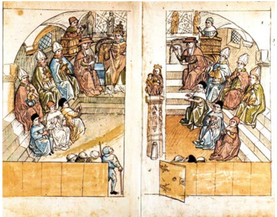
Kronika kostnického koncilu od Ulricha Richentalta v katedrále v Kostnici

Daleko známější je u nás Kostnický koncil (1414–1418), který se v povrchním českém národním sebevědomí dodnes interpretuje jako zlovolný komplot, který se nesešel kvůli ničemu významnějšímu, než za účelem pomstyctivého upálení hrdinného Jana Husa. Přitom víme, že koncil byl svolán kvůli nejzávažnější krizi v dějinách papežství. Bylo nutné sesadit hned tři papeže, z nichž každý si nárokoval papežský trůn, a poté ještě závazně potvrdit nového a jediného právoplatného papeže. Aby koncil tohoto cíle dosáhl, zvolil velmi choulostivou operaci, pomohl si „oslím mústkem“. Povýšil se totiž i nad svrchovanou papežskou autoritu a nárokoval si, že „obdržel svoji moc přímo od Krista a poslušností mu je povinen kdokoli a jakéhokoli postavení a hodnosti, byť si by to byl samotný papež“. Následně zvolený papež Martin V. pak dal sice věci obratem „do pořádku“, nicméně bula Heac sancta synodus (1415), obsahující tento blud tzv. „konciliarismu“, nadále zůstává součástí církví uznávaných koncilních dokumentů. Přitom i podle současné církevní disciplíny platí, že „papež nemůže být nikým souzen“, a také kanonické trestní právo dosud stanoví (zjevně anachronic-