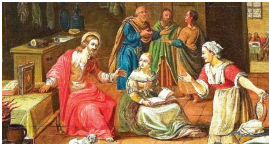
Georg Friedrich Stettner: Kristus v domě Marty (17. století)

Z toho je vidět, že vnitřní život, neboli život duše s Bohem, zasluhuje označení jako to jedno, čeho je třeba, protože prá-