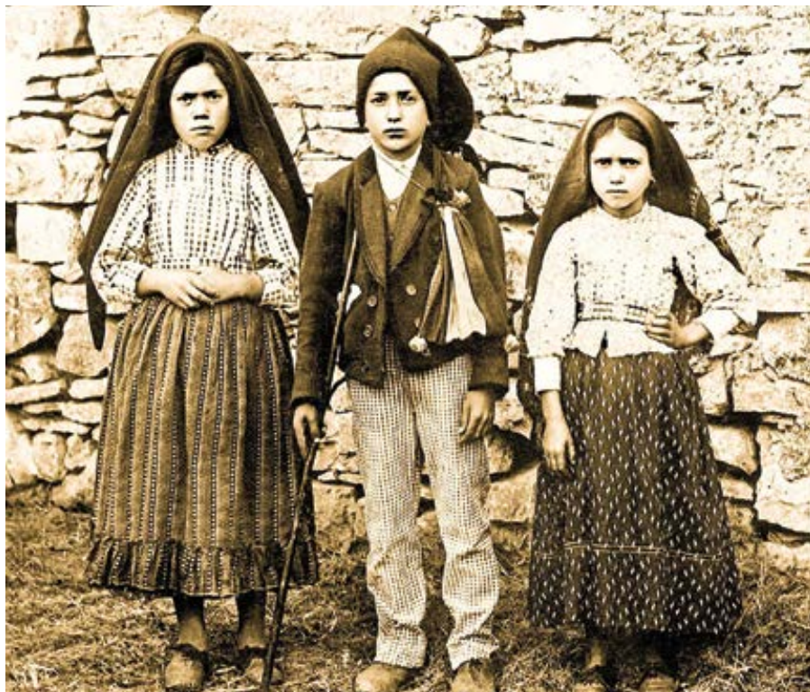
Fatimské děti, 1917.

nutí jiné, ještě hroznější II. světové války v roce 1939, připravované a předjímané již určitými událostmi v roce 1938, zvláště anšlusem Rakouska, a o neblahém působení Ruska.