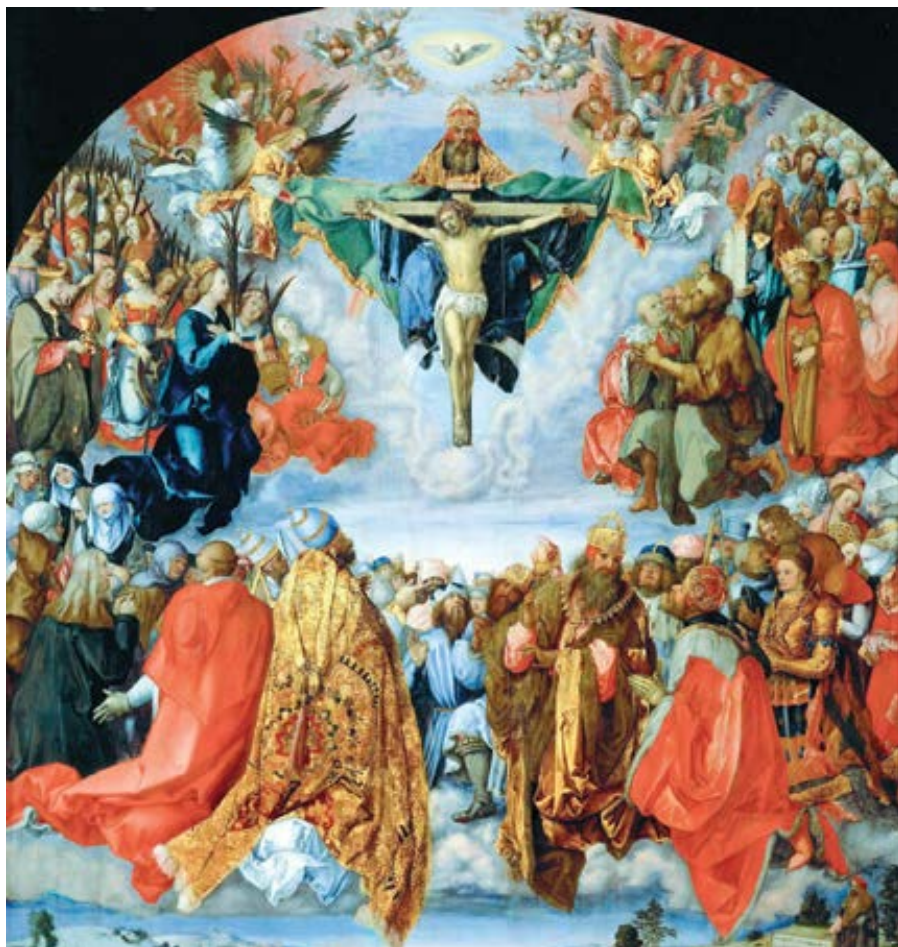
Albrecht Dürer: Landauerův oltář (1511)

skutečně a naplno. Opakovaně jsem mu v duchu suscipe Domine odevzdávala svůj život a prosila Ho, aby mi dovolil kráčet za Ním. Na každém kroku, v každé těžkosti, jsem se učila důvěře a odevzdání, a v Kristu, ukřižovaném Beránku, nalezla obraz a program následování.