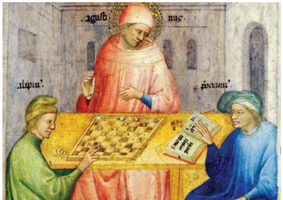
Nicolo di Pietro: Sv. Augustin a sv. Alypius navštěvují Ponticianu (cca 1413)

Pro Augustina to znamenalo naprosto nový život. Kdysi svůj každodenní život popsal takto: Napomínat nedisciplinované, utěšovat ustrašené, podporovat slabé, potírat odpůrce, střežit se před zlomyslnými, poučovat nevědomé, pobízet zapomnětlivé, brzdit svárivé, mírnit ambiciózní, dodávat odvahu malověrným, smířovat zneprátené, pomáhat potřebným, osvobodovat utiskované, ukazovat přízeň dobrým, snášet špatné a milovat všechny? Evangelium mne děsí – tato spásitelná bázeň nám brání žít pro nás samotné a nutí nás předávat naši společnou naději. Právě to bylo vlastním úmyslem Augustinovým: předávat naději ve svízelné situaci římského impéria, která postihovala, a dokonce zničila i římskou Afriku, a nakonec i život samotného Augustina. Naděje, která mu plynula z víry, jej v úplném protikladu k jeho introvertní povaze učinila schopným rozhodně a všemi silami se podílet na budování města. V téže kapitole Vyznání , kde jsme sledovali rozhodující motiv jeho nasazení pro všechny, praví: Kristus se za nás přimlouvá, jinak bychom zoufali. Mnohé a tíživé jsou slabosti, ale hojnější je Tvůh