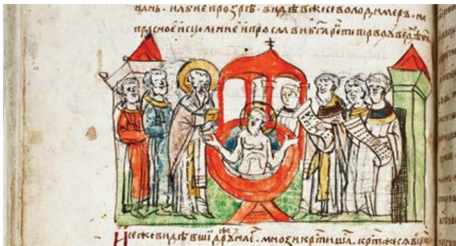
Křest svatého Vladimíra. Radziwiłłský letopis (kopie z 15. stol.)

Vznikem zcela samosprávné Pravoslavné církve Ukrajiny vyvrcholilo desítky let trvající úsilí ukrajinských věřících, kteří chtěli svou vlastní národní církev, svobodnou od jakýchkoli cizích náboženských autorit. Jako výraz ukrajinské duchovní nezávislosti byla tato samosprávná církev pro Moskvu výzvou. V pravoslavné terminologii si Pravoslavná církev Ukraji-