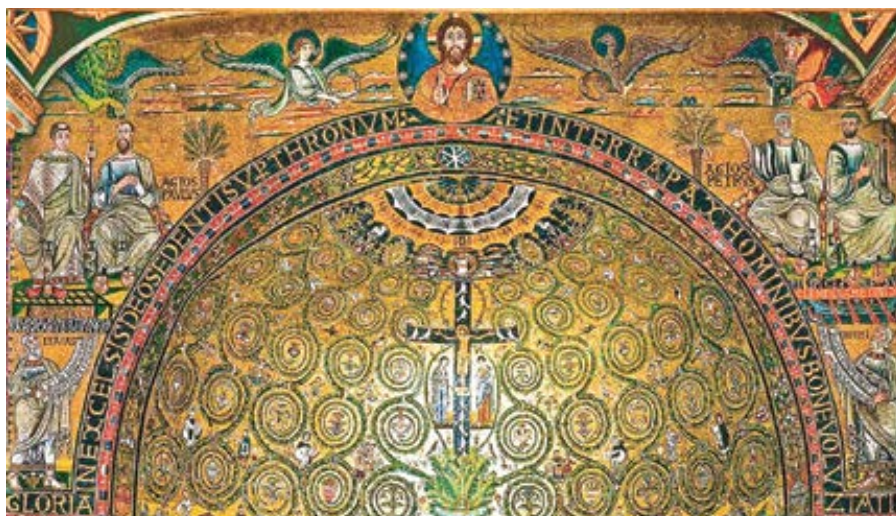
Mozaika v bazilice sv. Klementa v Lateráně.

příznivý vliv: Odvádí nás totiž od naší tendence zabývat se věcmi příliš systémově a snahy problémy (jednou provždy) vyřešit, a naopak nás nutí reagovat bezprostředně a průběžně pomáhat bližním v přítomném okamžiku (bez možnosti udělat si sebeuspokojující fajfku „splněno“). A to se po nás chce – sv. Matouš přece nenapsal do 25. kapitoly svého evangelia: „Pojďte požehnaní mého Otce, měl jsem hlad a vy jste do pěti let globálně vyřešili otázku hladomorů.“