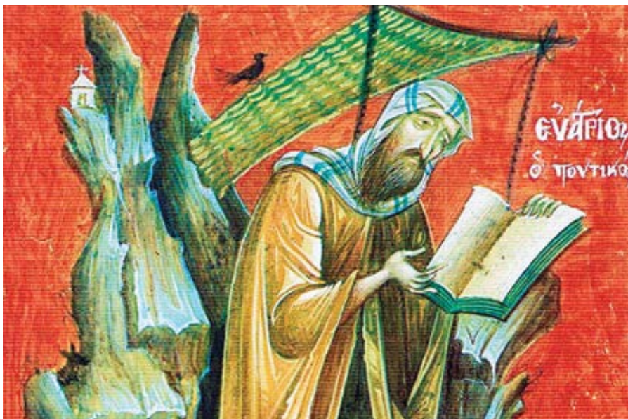
Evagrius Pontický.

Zbývá tedy kvietismus, uchýlit se do vnitřní citadely, pěstovat vnitřní zahradu, vyhýbat se mediálnímu nánosu, planým řečem a prázdnému společenskému životu, oddávat se duchovním cvičením, jejichž základem je rozhodné NE! propouštění svého já do smyslově–sociální diaspory světa. Pouštíme se do hledání konečné pravdy o nejvyšších věcech s vědomím, že jedině toto hledání může dát lidskému životu smysl, který – jak intuitivně cítíme –, musí mít. Přestáváme žít pro budoucnost, která nemůže být naší vlastní budoucností a je v každém případě chimérická. Smíříme se s tím, že naše pozemské působení je buď předehrou, nebo zbytečností.