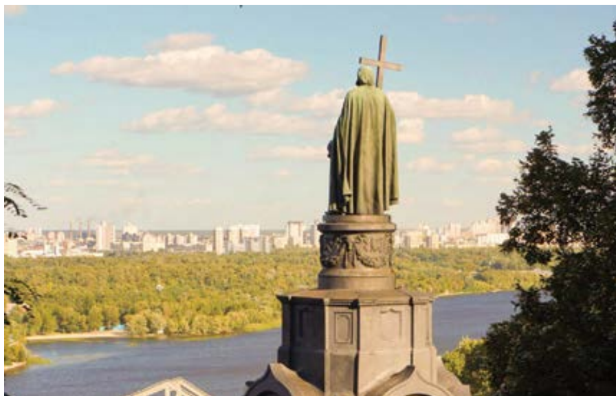
Památník svatého Vladimíra v Kyjevě.

Kyjev se stal nejdůležitějším náboženským centrem východních Slovanů.