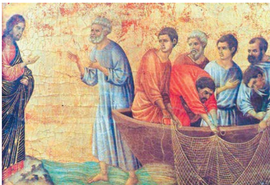
Duccio di Buoninsegna: Zjevení na Tiberiánském jezeře (1308–1311)

Břeh je zároveň okrajem moře, a proto označuje konec světa. Neboť jako Pán na tomto místě podal obraz církve, jaká bude, tak při prvním rybolovu podal obraz církve, jaká je nyní. Ježíš pak nestál na břehu, ale nastoupil do loďky, která patřila Šimonovi, a požádal ho, aby se trochu vzdálil od břehu. Při prvním lovu neházejí síť jen napravo, aby neznamenal jen dobré, ani jen nalevo, aby neznamenal jen špatné, ale libovolně: říká, abyste spustili síť k lovu (Lk 5,4). Tím máme chápat dobro smíšené se zlem. Zde však říká: