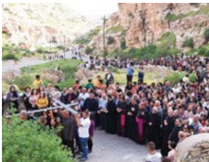
Křížová cesta v iráckém Karakoshi, duben 2022.

Zásadní podnět k dialogu a obnově dal papež František svou mimořádně sledovanou cestou do Iráku v březnu 2021,