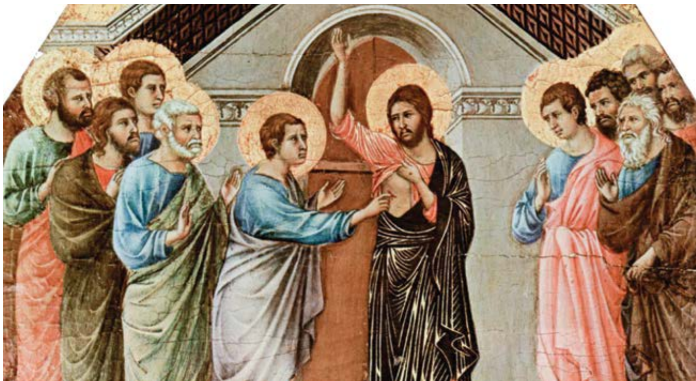
Duccio di Buoninsegna: Nevěřící Tomáš (1308–1311)