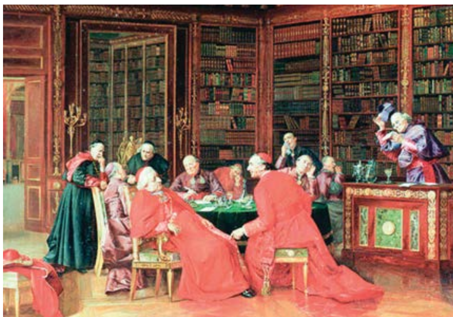
Francesco Brunery: Nudná konference (cca 1900)

Takové výroky prozrazují myšlení člověka, který odmítl svou povinnost biskupa a kardinála, ba dokonce i pokřtěného následovníka Ježíše Krista v kato-