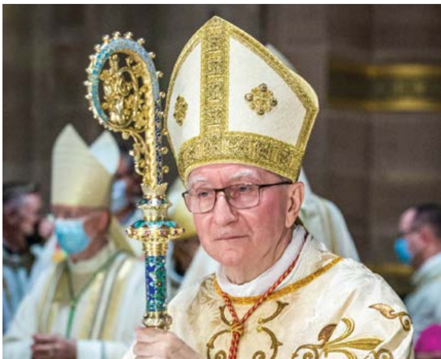
Kardinál Pietro Parolin.

Parolinova návštěva Moskvy v roce 2017 byla první cestou vatikánského