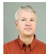
J. Eugene Clay The Conversation Přeložila Alena Švecová

Budoucnost Pravoslavné církve Ukrajiny je nejasná. Těší se podpoře několika svých sesterských církví, a zároveň čelí prudkému odporu Moskvy. Prozatím zůstává zdrojem sporů mezi Ruskem a Ukrajinou.