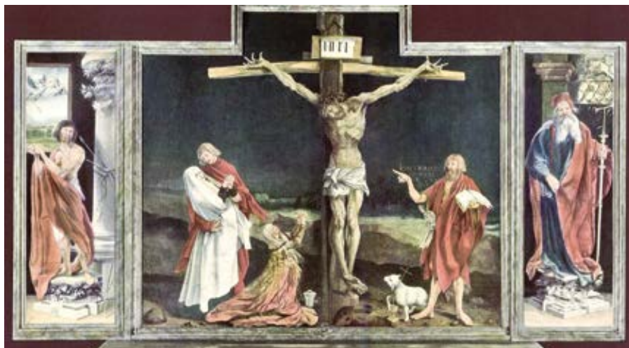
Matthias Grünewald: Insenheimský oltář (1512–1516)

Zpětně vzato, vlastně je trochu dobře, že předehrou ruské agrese byla kauza Covid-19 (bez ohledu na to, nakolik je nemocí těla a nakolik politickou lží a fac- kou základním lidským právům a svo- bodám). Covid-19 nám totiž dal zažít velmi rychlé a nepříjemné překvapení, vedl nás do souřadnic, které bychom před jeho propuknutím považovali za absurdní a nemyslitelné – a přesto se sta- ly zcela reálnými. Když nic jiného, víme nyní, co je nouzový stav, že je možný ži- vot i s velmi obtěžujícími omezeními a že se věci mohou dít hodně jinak, než by- chom si připustili, a nejsme tak snadno překvapitelní dopady probíhající války. Pád z lidstvem dosažených výšin se tak neodehrál rovnýma nohama do války,