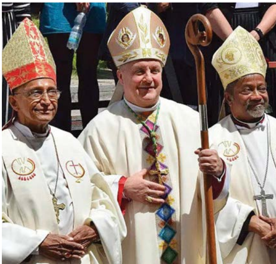
Královéhradecký biskup Mons. Jan Vokál, arcibiskupové z Indie Mons. Machado a Mons. Moras.

Příkladů jsou tisíce. Mezi dříve podporovanými dětmi jsou lékaři, technici, úředníci. Ale i u těch nejmenších dětí je už vidět pokrok. Když jsme navštívili rodinu, které dárce kromě školy pro děti pomohli