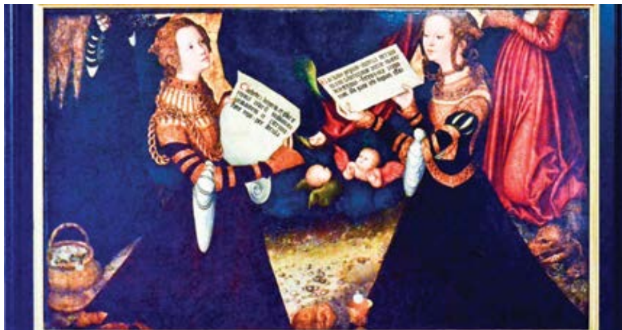
Pražský oltář Lucase Cranacha staršího: Sv. Kateřina a sv. Barbora (cca 1520)

Odborníci radí, že pokud chceme moudrost nazírat, je třeba nosit kříž jako knihu moudrosti, a tou je Kristus. V ní se máme vzdělávat, abychom porozuměli Božím tajemstvím. Proto v Písmu stojí (srov. Dt 31,26): Vezměte knihu tohoto zákona a uložte ji po straně schrány smlouvy Hospodina, vašeho Boha. Tam bude proti tobě svědkem. Tak lze trochu chápat i třetí podobu archy smlouvy, uloženou v Božím chrámu na nebesích (srov. Zj 11,19). Poznáváme ji jako Ženu Písma, u které jsou uložena nejen podstatná tajemství, ale je i bezpečnou archou spásy v naší době (srov. Gn 3,15). Aby nám to bylo jasné, Kristus oslovoval svou matku slovem „Ženo“. Dle Písma nás Kristus