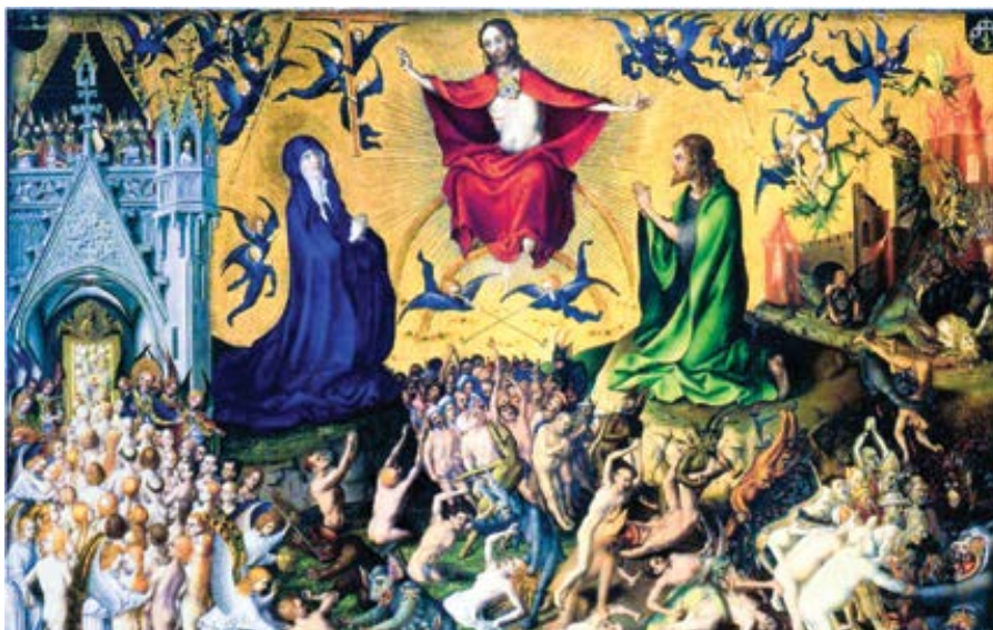
Stefan Lochner: Poslední soud (cca 1435)

Předchozí večer, jak mi řekla, utratila se svou sestrou a dvěma kamarádkami stovky dolarů za jídlo o šesti chodech. Pro ni a její společnost se podávalo osm nápojů s tematikou Dne mrtvých . Jako důkaz mi ukázala několik fotografií exotických nápojů. Řekl jsem jí, že ani nevyžadává unaveně po požití tolika alkoholu. „Ráno po probuzení jsem si dala speciál-