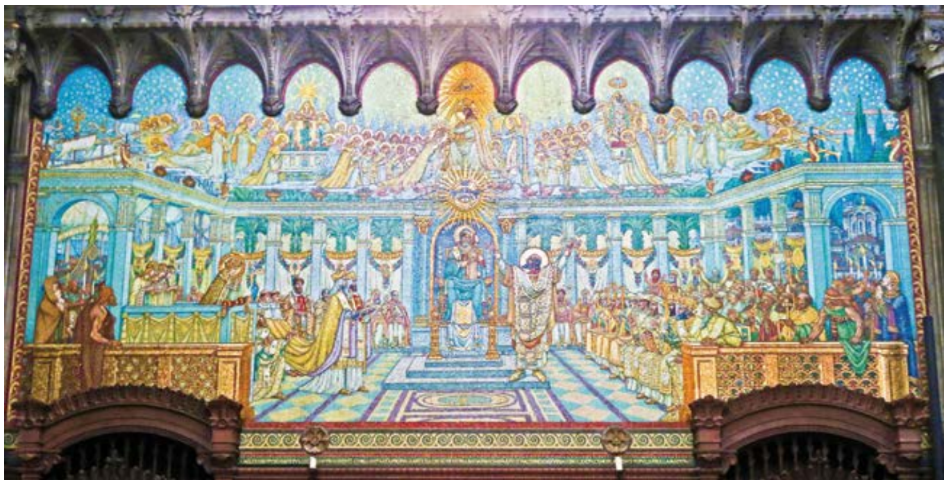
Mozaika v bazilice Notre-Dame de Fourvière v Lyonu: Koncil v Efesu v roce 431.