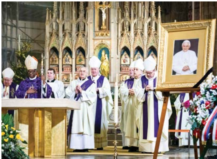
Zádušní mši sv. za zemřelého emeritního papeže Benedikta XVI. sloužil ve středu 4. ledna 2023 v pražské katedrále papežský nuncius Jude Thaddeus Okolo spolu s českými a moravskými biskupy.

Svatý papež Silvestr I. žil na přelomu 3. a 4. století a vedl církev za plné svo-