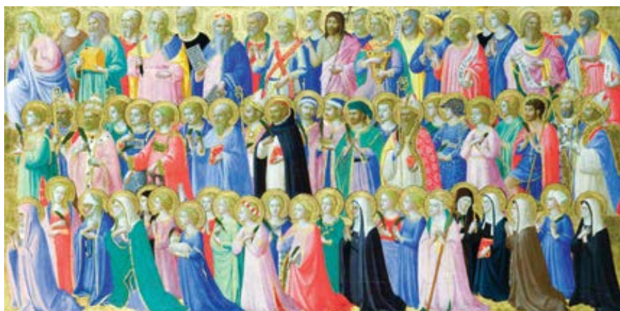
Fra Angelico: Předchůdci Krista se svatými a mučedníky (1423–1424)

dý člověk má také sklon ke zlu, pravděpodobně by bylo možné předejít mnoha katastrofám. Jedním ze způsobů, jak tento obrovský problém vyřešit, by mohl být ústavní princip vyžadující zvláštní kvalifikaci jako předpoklad pro přístup k vysokým vládním funkcím. Tak by mohly být vytvořeny instituce, které by kandidáty morálně a odborně vzdělávaly. Například ve Francii v tomto ohledu existuje škola veřejné správy. Jiné vyspělé země vychovávají své politické kádry na určitých univerzitách, stejně jako nadnárodní společnosti dávají přednost těm, kteří studovali na Harvardu. Další formou přípravy a získávání znalostí je politická kariéra.