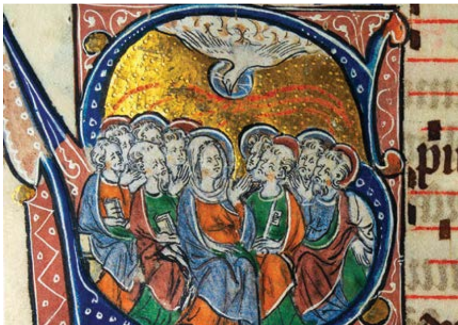
Soslání Ducha Svatého v Sherbrookském misálu z východní Anglie. (1310–1320).

Zavřené dveře nestály v cestě hmotě těla, v níž bylo božství. Nebyly otevřené, ale mohl jimi vstoupit ten, kdo při svém