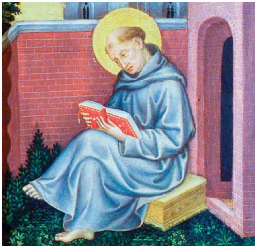
Gentile da Fabriano: Sv. Tomáš Akvinský (cca 1400)

Dvojí láska staví dvojí obec: sebláska, sahající až k pohrdání Bohem, staví obec pozemskou; láska k Bohu, vedoucí až k sebebohrdání, staví obec nebeskou. První se chlubí sama sebou, druhá v Bohu. První hledá svou slávu u lidí; Bůh, svědek svědomí, je největší slávou druhé. První pozvedá hlavu, opírajíc se o svou vlastní slávu, druhá říká svému