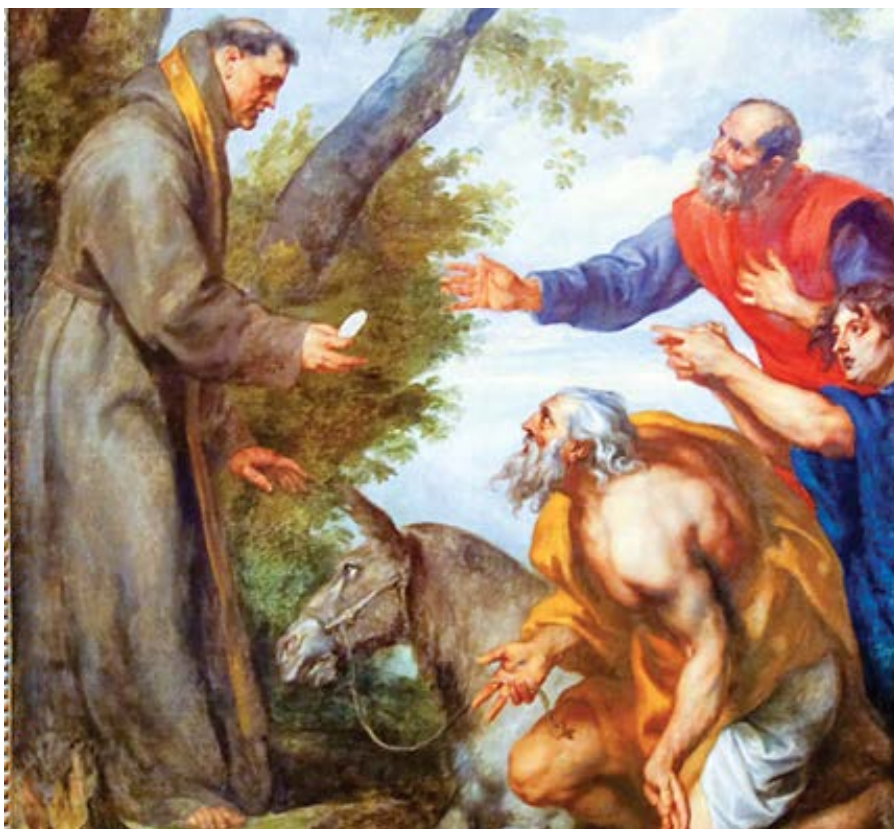
Anton van Dyck: Sv. Antonín Paduánský a zázrak s oslem (cca 1627–1630)

Dalším možným významem výrazu „chudí v duchu“ je, že označuje ty, kdo jsou pro svou lásku k Bohu oddělení od bohatství. Člověk může mít k bohatství daleko z řady důvodů. Může být líný nebo nerozvážný; může podléhat falešné ideologii, podle které je bohatství samo o sobě zlé. Nic z toho není nikterak záslužné. Avšak ti, kdo jsou od bohatství oddělení proto, že se přimkli k Bohu, zasluhují určitou odměnu. Takoví lidé vnímají peníze jen jako prostředek k tomu, aby mohli