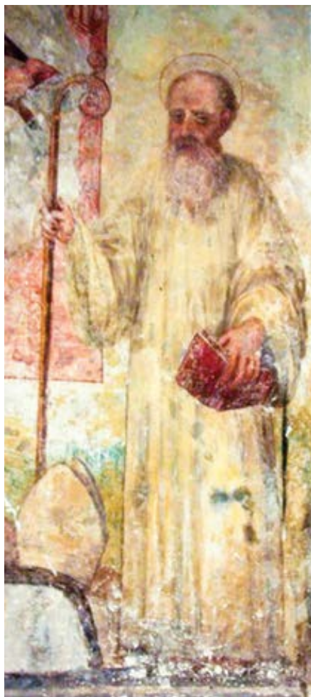
bl. Jáchym z Fiore, freska v katedrále Santa Severina (1573)

svou vlastní dynamiku a dokázalo zcela rozvrátit stávající pořádek.